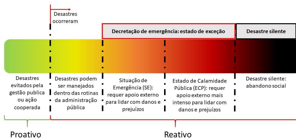
Fig.1: Caracterização de diferentes modos da gestão pública lidar com os desastres.

de posses que se somam a outras inseguranças e violências. Entre um ponto extremo e o outro, há ocorrências disruptivas cujos danos são avaliados como algo manejável pelos atores públicos e privados implicados – e que, assim, prescindem de decretação de emergência – e aquelas que exigem grande suporte externo para serem enfrentados, os estados de calamidade públicas.