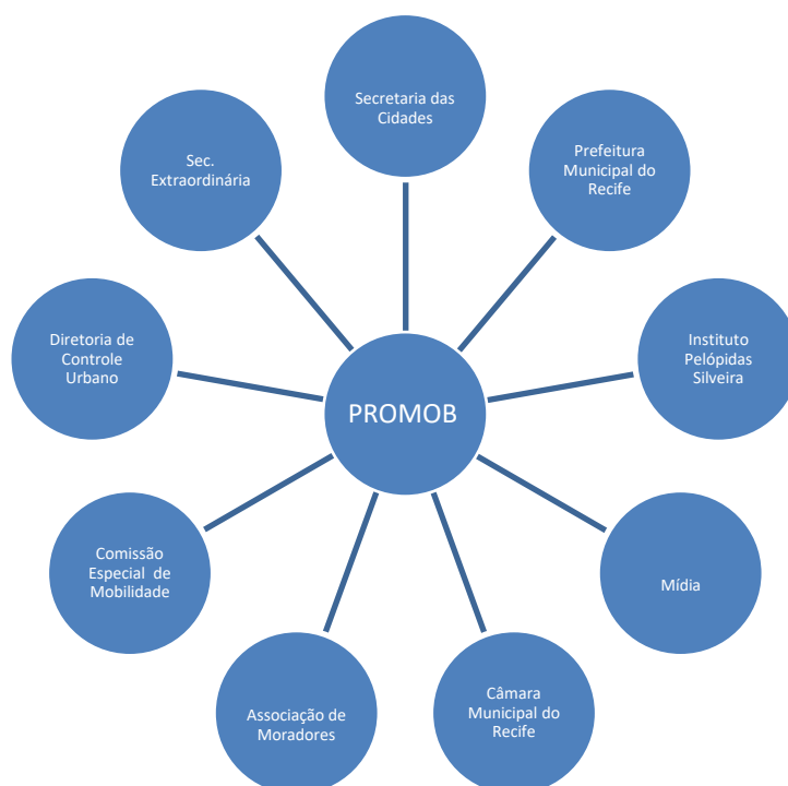
Figura 2 - Alguns sujeitos relevantes ao Promob

marginalizados do processo decisório pelas políticas de mobilidade, apesar de sofrerem efeitos diretos e indiretos de suas externalidades.