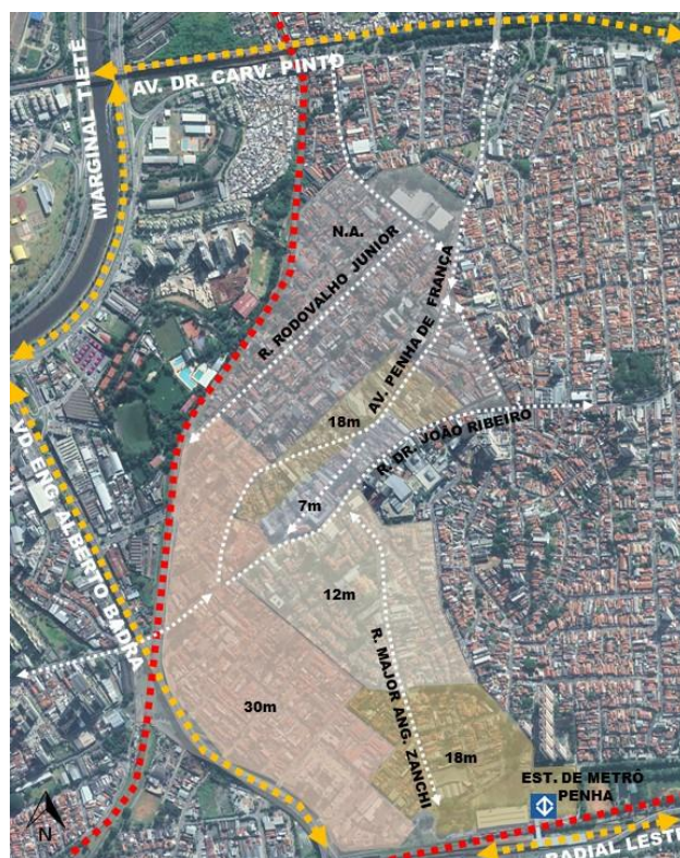
Figura 3. Regras de altura de gabarito estipuladas a partir do tombamento da área.

Conforme se verifica da comparação entre as Figuras 2 e 3, a aprovação do tombamento definitivo pelo Conpresp, neste ano, inverteu a dinâmica urbana aprovada pelo planejamento urbano na lei de zoneamento atualmente vigente no município de São Paulo. Ou seja, os gabaritos estabelecidos pelo tombamento são bem mais restritivos do que aqueles previstos em Zonas de Estruturação Urbana.