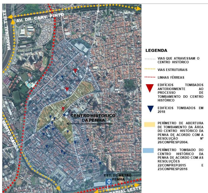
Figura 1. Centro Histórico da Penha. Demarcação de seu antigo e atual perímetro de estudo, bem como imóveis tombados.

Após abertura do processo de tombamento desses novos imóveis, o DPH ampliou o perímetro do chamado centro histórico da Penha, alegando falta de justificativa para o perímetro inicialmente indicado como Zepec, em 2004. Dessa maneira, considerou-se como centro histórico a antiga área da Freguesia da Penha, tal como se indicava no mapa da cidade de 1897. A nova área refere-se, assim, a um perímetro muito maior do que o perímetro original indicado no PRES da Penha, em 2004 (Figura 1). Dentro da área, foram tombados, finalmente, em 2018, 17 imóveis (Figura 1).