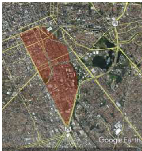
Figura 03. Área delimitada pelo IPPUC, para o Centro Tecnológico do Vale do Pinhão, que abrange o bairro Rebouças.

A realidade do bairro reflete a distância “entre a intenção e o gesto”, haja vista que, conforme indicado anteriormente neste trabalho, houve decréscimo de população e mudança de sua tipologia socio ocupacional entre 2000 e 2010. Com isso, novas iniciativas de revitalização ganharam corpo, tanto por parte da administração municipal, quanto dos agentes produtores do espaço urbano. Cabe aqui descrever sinteticamente cada uma das propostas recentes, identificando seus agentes promotores, para na sequência avaliar os interesses envolvidos nas intenções de transformação e seus efeitos sobre o espaço.