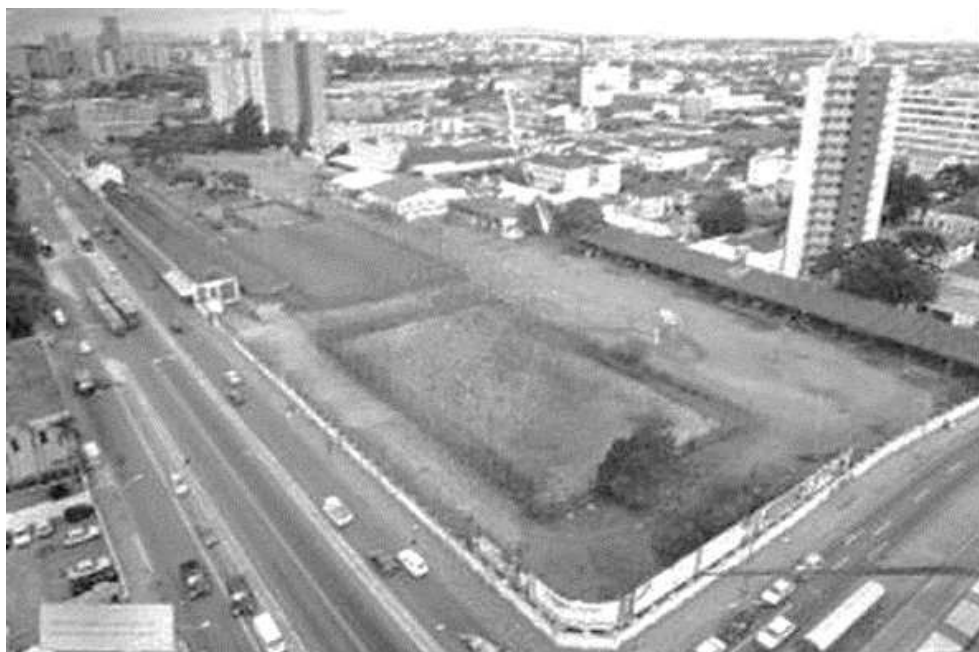
Figura. 01. Vista geral do terreno da Rede Ferroviária desativada nos anos 90. A grande área vazia no centro da imagem separava o bairro Centro, à esquerda, do bairro Rebouças, acima à direita (EFB, 2018)

Do ponto de vista urbano, o Rebouças estava separado do Centro pela Estação Ferroviária e sua estrutura férrea. O bairro manteve seu caráter industrial até a desativação da ferrovia no último quartel do século XX, quando então as iniciativas de ocupação do terreno da Rede tiveram início e as indústrias começaram a deixar a região. Nos primeiros anos da