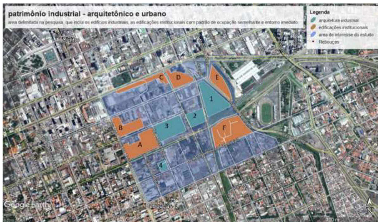
Figura 11. Mapa indicativo das edificações de caráter industrial e institucional, inseridas na área de estudos. Base do Google Earth, editada pela autora do texto.

A análise desta área concentra-se no padrão de ocupação dos lotes e na tipologia das edificações industriais e institucionais que configuram uma paisagem específica e guardam a memória do antigo bairro industrial. O objetivo é caracterizar a área, demonstrar sua importância no bairro e subsidiar futuras intervenções. Para isto, apoia-se no conceito de patrimônio urbano e nos estudos de tipologia e morfologia urbanas, conforme os apresenta Rufinoni (2013), no que concerne à relação antigo-novo, à preservação do conjunto e o que essa autora define como restauro urbano.