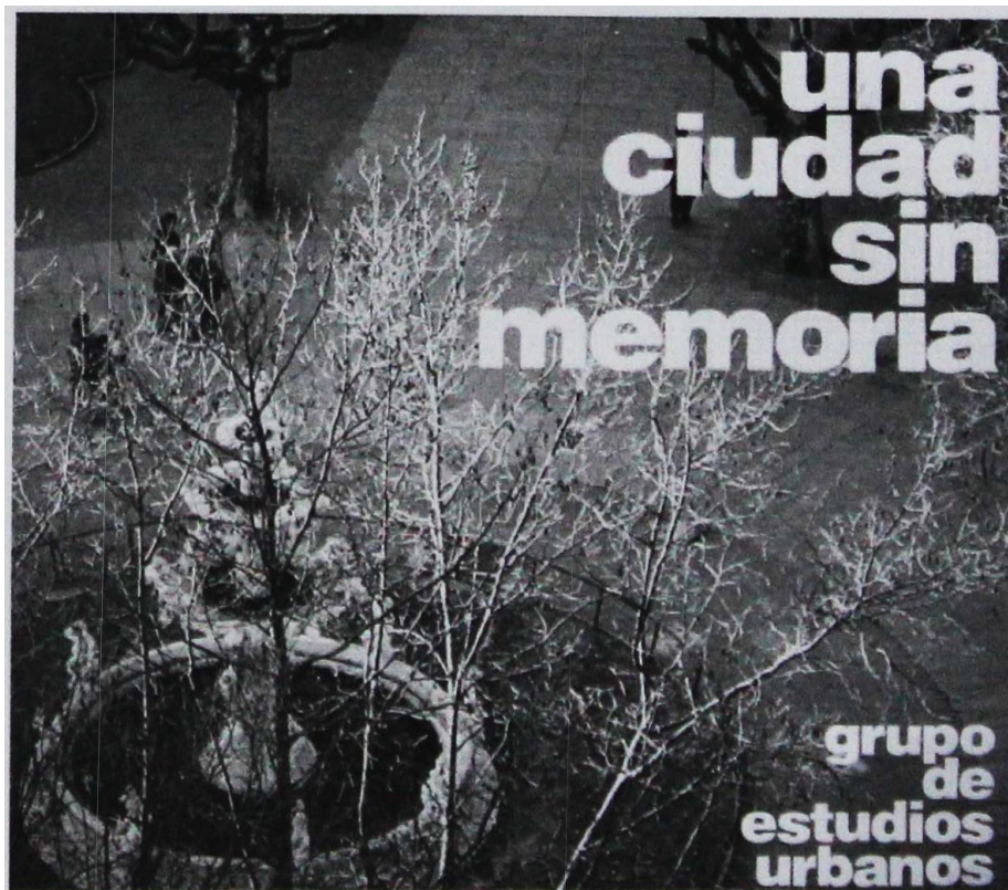
Figura 03: Audiovisual Una ciudad sin memoria , elaborado pelo Grupo de Estudios Urbanos , de 1982. Fonte: Giordano et al. (2014) - recorte das autoras.

própria sociedade (GIORDANO et al., 2014). Integrado por um amplo conjunto de estudantes e arquitetos, o GEU inicia sua atuação com a divulgação de um trabalho audiovisual intitulado Una ciudad sin memoria , denunciando a situação de especulação imobiliária que atravessava Montevideu enquanto cidade e, retratando, particularmente, a degradação da Ciudad Vieja , o centro histórico. Como avalia Ramón Gutierrez – em depoimento publicado em Giordano et al. (2014) –, o audiovisual narrava as carências da cidade, mostrava a cidade fragmentada, reivindicava os valores dos habitantes, seus modos de vida e sua identidade urbana.