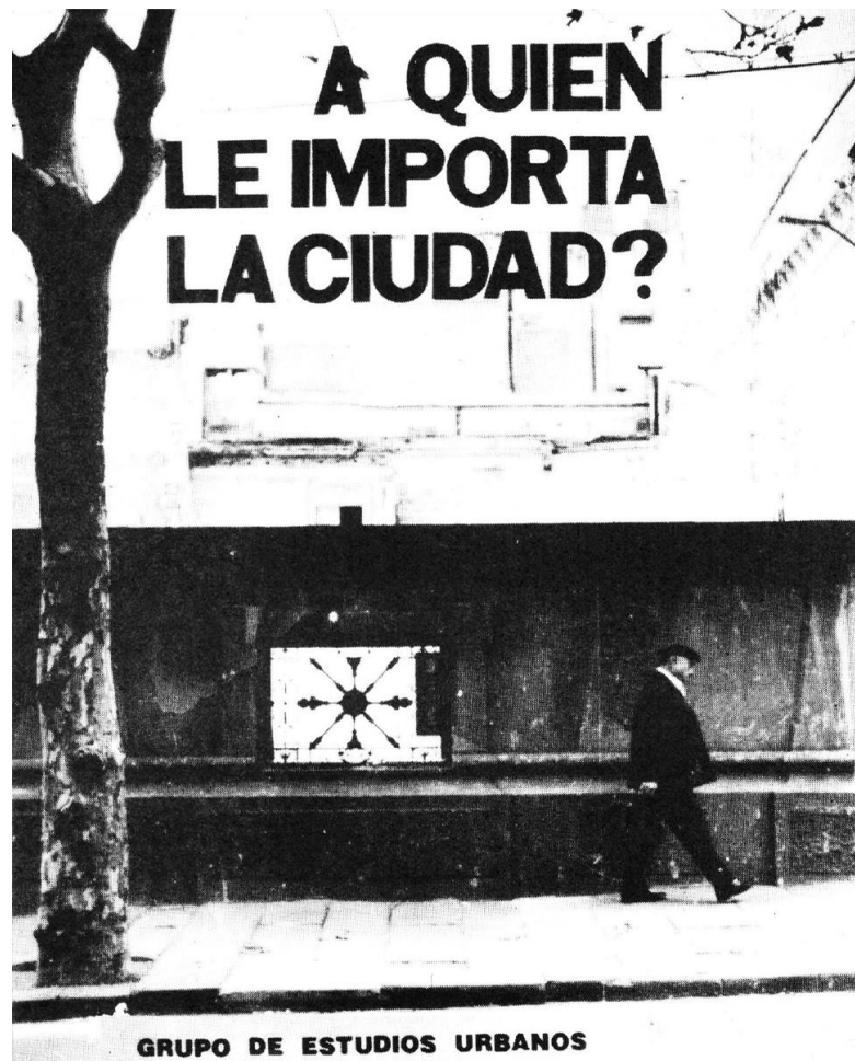
Figura 04: Audiovisual Una ciudad sin memoria , elaborado pelo Grupo de Estudios Urbanos , de 1983.

simbolizado, em que se pode ler a identidade dos que o ocupam, as relações que mantêm entre si e a história que compartilham.