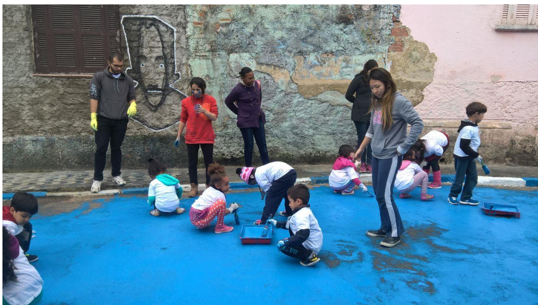
FIGURA 2 – Crianças de 4-6 anos participando de intervenção na Vila Suíça no bairro do Glicério-São Paulo/SP, autor desconhecido, 2016. Fonte: acervo pessoal