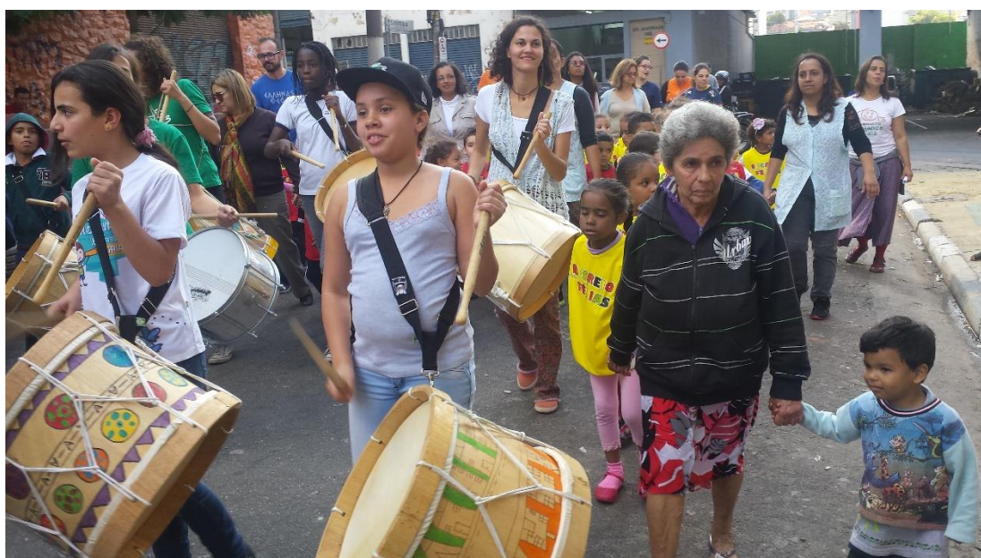
FIGURA 4 – Cortejo junino em homenagem a Gonzaguinha no bairro do Glicério-São Paulo/SP, por Sérgio Porto, 2016. Fonte: acervo pessoal

Talvez não evidente, mas considerando Huizinga (1938) o cortejo acima citado também configura como jogo . Mesmo não detendo algumas de suas características, guarda a sua maior qualidade que é o divertimento, num caráter de celebração e êxtase capaz de arrebatá-los aqueles que o praticam.