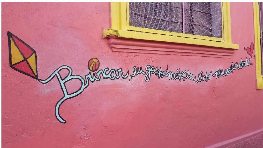
FIGURA 7 – Frase de criança participante do projeto Criança Fala. Intervenção artística de grafitteiros e voluntários na Vila Suíça no bairro do Glicério-São Paulo/SP, por Sérgio Porto, 2016.

A intervenção na localidade do Glicério nos permite perceber como os espaços e as relações dos indivíduos com esses são potentes: ' ele é matriz que informa todas as nossas relações na sua complexidade, ao mesmo tempo que é, como elas, o resultado de fatores culturais, sociais e institucionais' 46 .