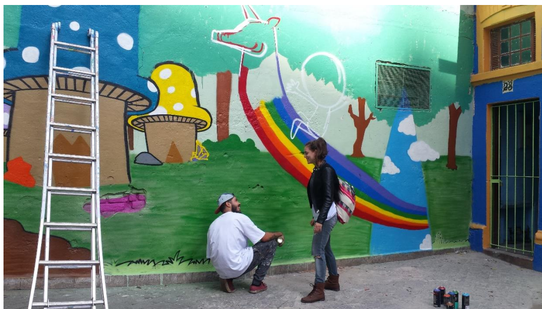
FIGURA 5 – Intervenção artística de grafitteiro na Vila Suíça no bairro do Glicério-São Paulo/SP, por Sérgio Porto, 2016.

A ação de ressignificação dos espaços públicos livres do Glicério foi capaz de reunir não apenas as crianças e seus responsáveis, como também pessoas em situação de rua, artistas, estudantes universitários, as escolas, coletivos, organizações sociais e outros atores.