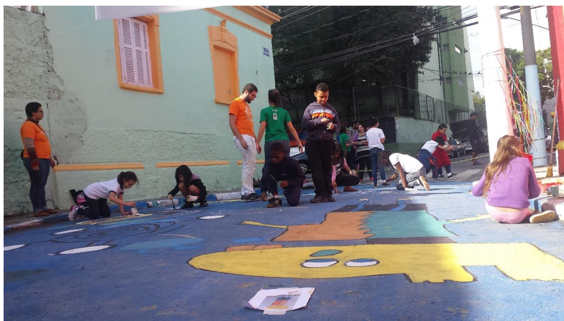
FIGURA 3 – Crianças de 8-12 anos participando de intervenção na Vila Suíça no bairro do Glicério-São Paulo/SP, por Sérgio Porto, 2016. Fonte: acervo pessoal

Essa ação, após breves diálogos com moradores curiosos e desejosos em demonstrar sua aprovação, evidenciou como o ato possibilitava a construção de sentimento de pertencimento com os espaços (em geral bem degradados) pelas crianças, tomando estes também como seus. As fronteiras entre os territórios são maleabilizadas, tendo as crianças o