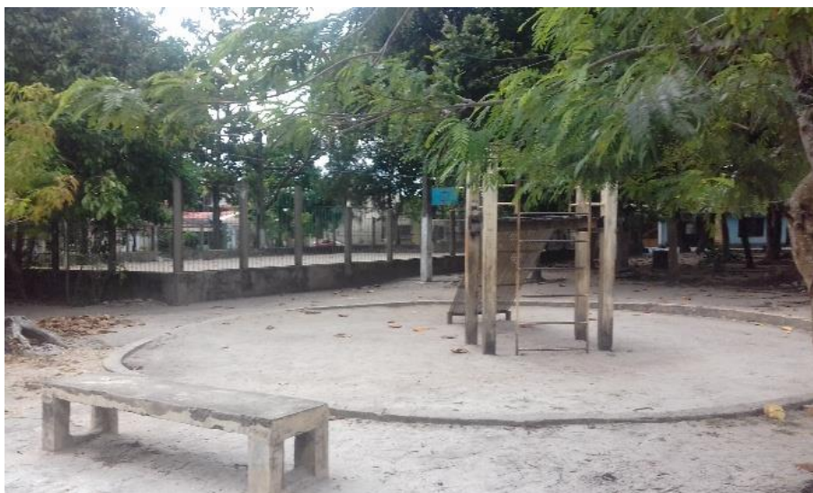
Figura 06: brinquedos infantis no CNMI

Outra situação observada refere-se aos brinquedos infantis, implantados em duas praças, mas que somente em uma, ainda estão em condições de uso (fig. 06).