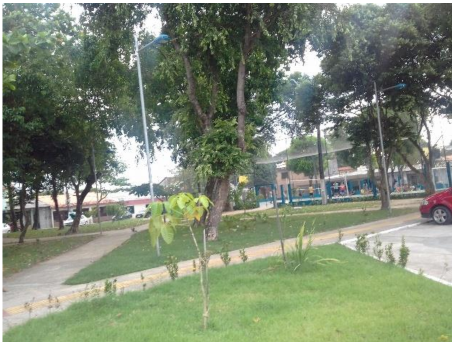
Figura 07: praça reformada e sem bancos no CNMI