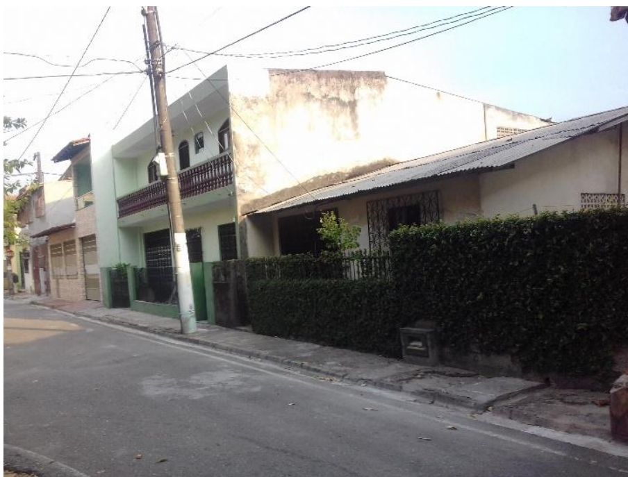
Figura 03: Conjunto Nova Marambaia I na atualidade