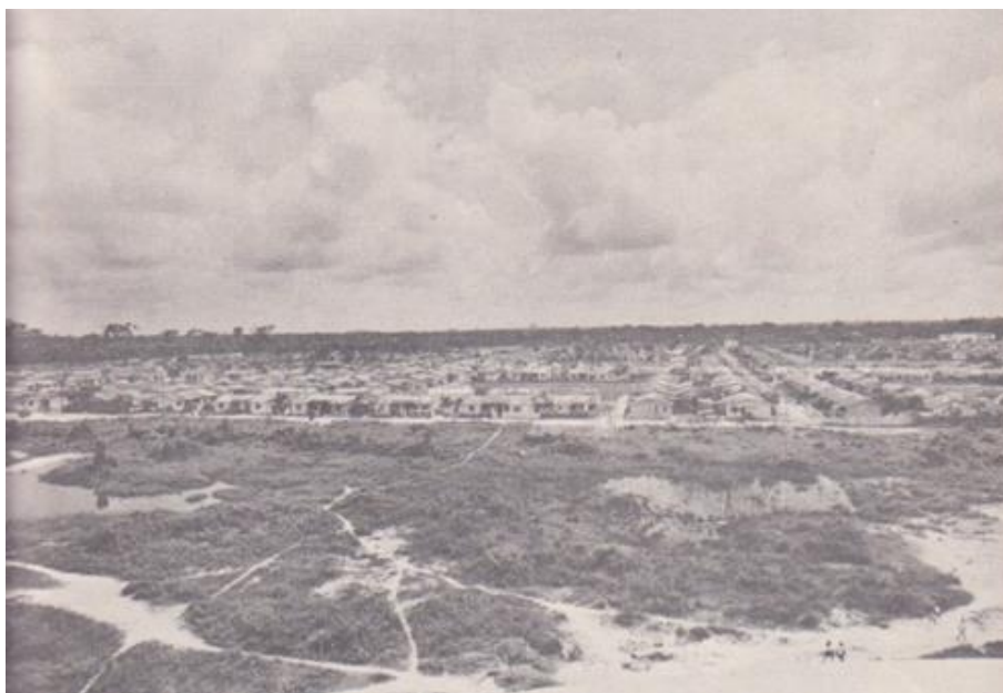
Figura 02: conjunto Nova Marambaia I, em 1971

equivalente atualmente à algumas partes do bairro do Reduto, onde está localizada a avenida Doca de Souza Franco; segundo Trindade Jr (2016), o referido conjunto contava originalmente com 834 unidades habitacionais padronizadas em alvenaria, dispostas cada uma, no centro do lote, apresentando uma tipologia única.