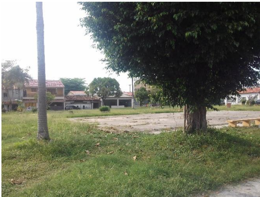
Figura 05: quadra no CNMI