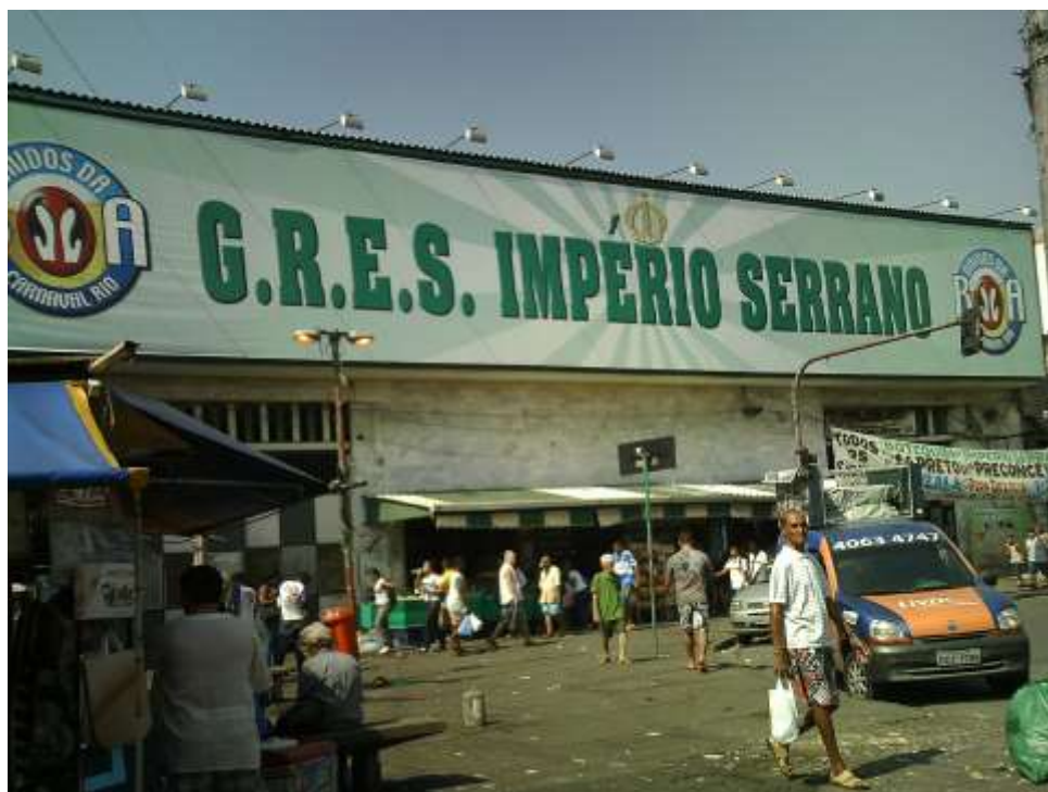
Figura 5: Quadra do Império Serrano

Ao lado das quadras das escolas, o samba de Madureira ainda sobrevive no espaço público através de eventos como a Feira das Yabás 6 (MADUREIRA DE PINHO, 2014). As redes de sociabilidade do samba que envolvem as famílias, como diz Santos (2016), sobrevivem não somente nos quintais mas também em festas que foram surgindo no bairro, ligadas às tradições afro-brasileiras, como é o caso desse evento que acontece no segundo final de semana de cada mês, sempre aos domingos, na Praça Paulo da Portela. Trata-se de uma feira gastronômica com culinária preparada pelas matriarcas de Madureira, e que também tem uma roda de samba importante, com artistas de peso locais. De acordo com Gonçalves (2016) essa feira resgata as tradições de um Rio de Janeiro colonial, como nas gravuras de Debret, em que se viam mulheres negras vendendo quitutes pelas ruas da cidade do Rio de Janeiro.