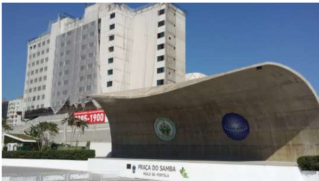
Figura 6: Praça de Eventos do Parque de Madureira

Além desses espaços específicos e privados, o samba ganhou um espaço público mais sofisticado, em que o poder público buscou a tradição cultural local como motivo para que um novo espaço construído fosse apropriado com maior intensidade pelo público: o grande palco do Parque de Madureira. A construção de uma grande praça de eventos, com um palco de grandes dimensões trouxe o incentivo governamental para o samba local. Essa ideia é reforçada ao se verificar a colocação dos emblemas das duas escolas de samba ao fundo do palco, mostrando de maneira simbólica a importância do samba em Madureira, e a apropriação do poder público dessa imagem para uma obra que inaugurava em um contexto de mostrar a valorização dos subúrbios, em um momento de obras olímpicas em toda a cidade. Ao trazer o samba e sua mais perfeita tradução, com duas tradicionais escolas, o Parque buscou se aproximar da cultura local, e criar um espaço de apresentação de grandes atrações musicais, e um espaço de lazer reforçado pela presença de bares em torno dessa área do parque.