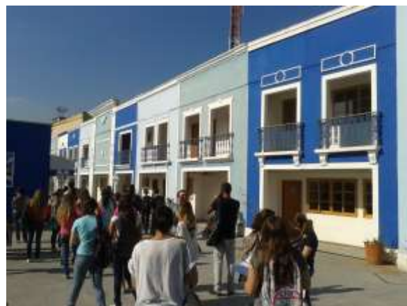
Figuras 3 e 4: Fachada e interior da quadra da Portela, 2013

A outra escola de samba famosa do bairro, a Império Serrano, mesmo localizada em área mais central, junto à estação de trem do Mercado, mantém a tradicional estrutura do galpão, tendo condições financeiras mais modestas, e dessa maneira não podendo criar espaços mais sofisticados para sua promoção. Fundada no Morro da Serrinha em 1947 (LOPES, 2012), a Império Serrano se localiza hoje em área bastante central do bairro, mantendo seus bailes e ensaios dessa maneira bastante integrados ao bairro e aos seus moradores. Mesmo que nominalmente ligados aos morros locais, tanto a Portela como o Império Serrano passaram a se situar no meio do bairro, em posição de destaque urbano, buscando ampliar o número de frequentadores de suas atividades musicais, sociais e culturais.