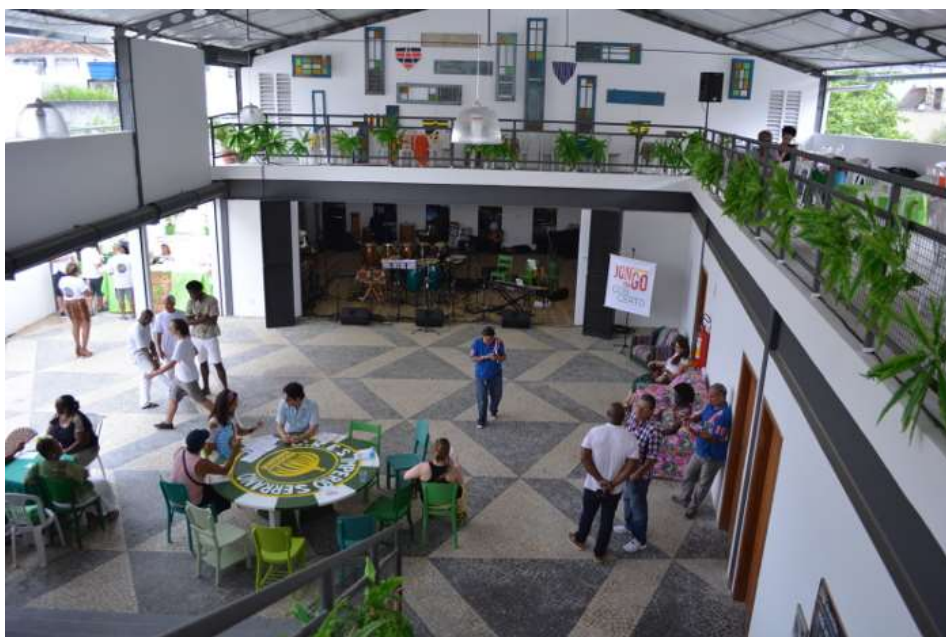
Figura 7: Interior da Casa do Jongo da Serrinha, 2015.