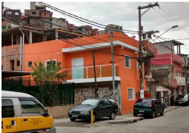
Figura 4 – Fachada redecorada