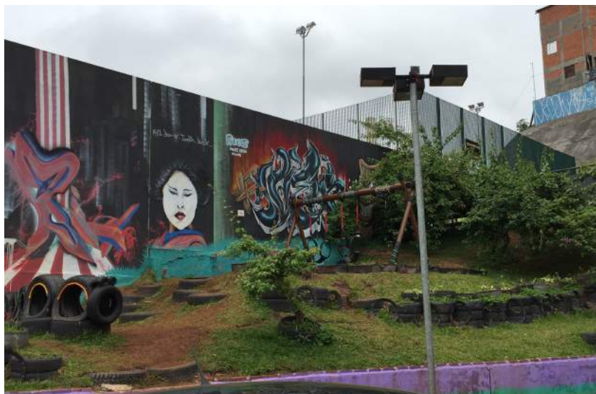
Figura 3 – Parque infantil construído por coletivo local