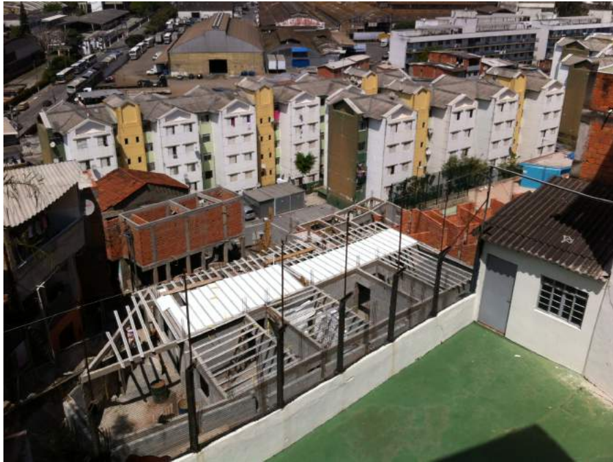
Figura 1 – Reocupações do crime