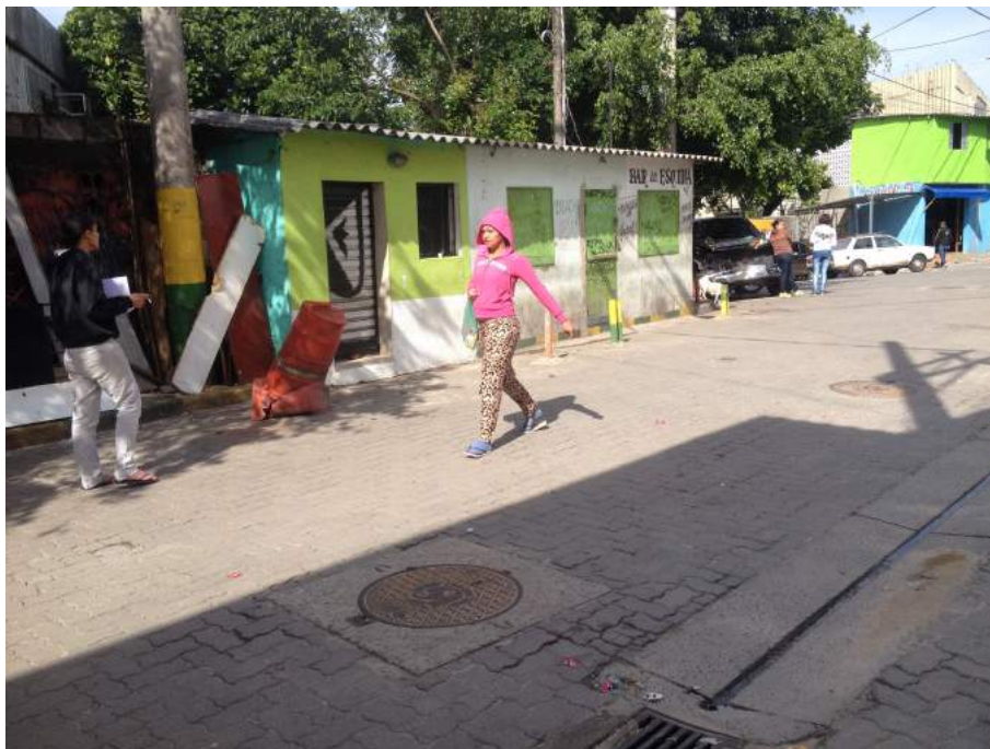
Figura 2 – Reocupações residuais: comércios