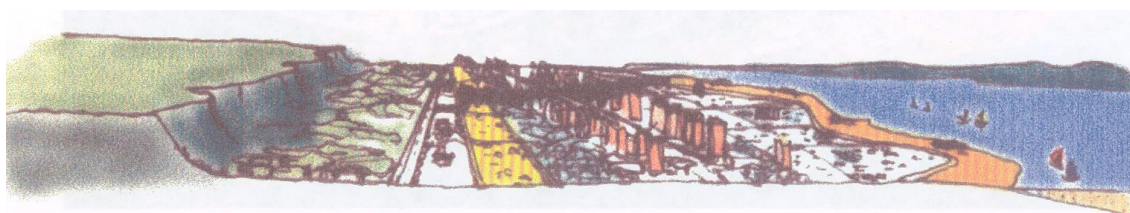
Figura 2 – Croqui do projeto com a localização do perímetro urbano entre os elementos paisagísticos.