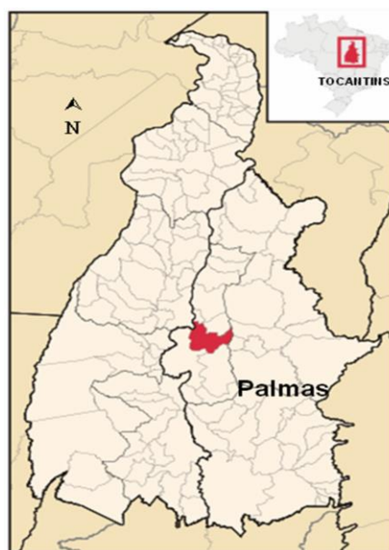
Figura 1 – Localização da cidade de Palmas.