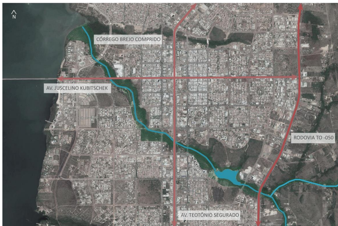
Figura 6 – Localização do Córrego Brejo Comprido no perímetro urbano.

Fonte: Google Earth, 2018. Adaptado pelos autores.