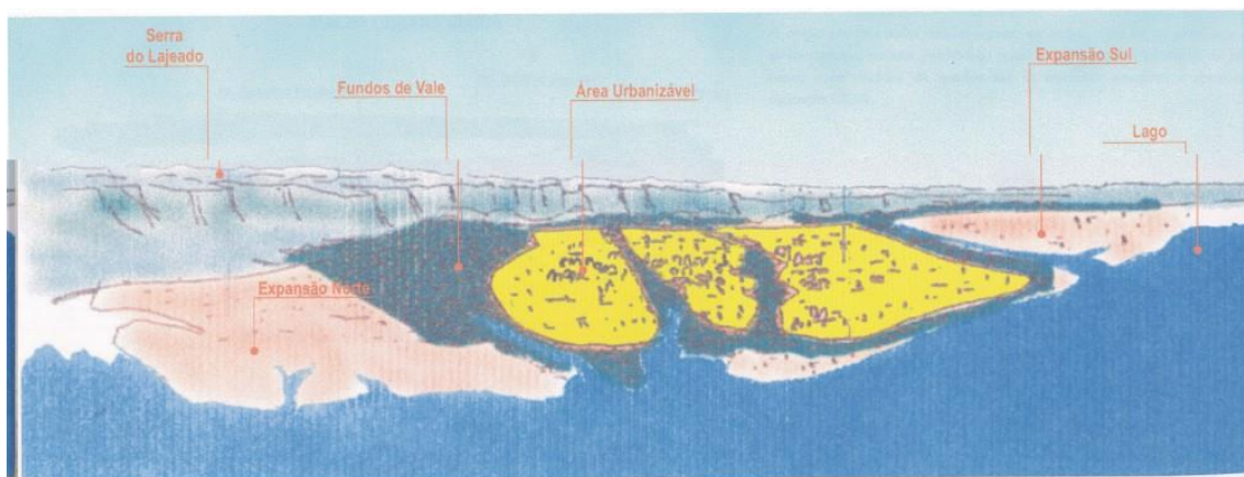
Figura 3 – Croqui da área urbanizável e fundos de vale que seguem de encontro ao futuro lago.