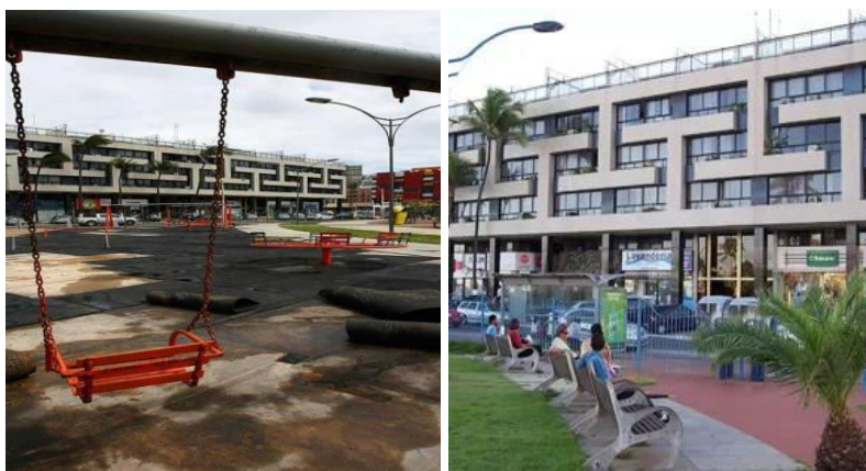
Figuras 1 e 2: Praça Nossa Senhora da Luz – Bairro Pituba – Salvador-Ba, em dois momentos.