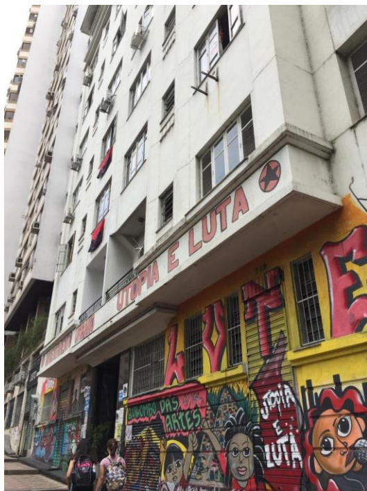
Figura 2: Ocupação Utopia e Luta, no centro de Porto Alegre