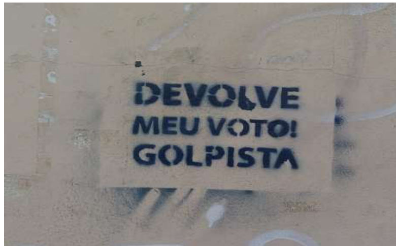
Fotografia 14: Estêncil Subversivo. Autor desconhecido – Arquivo pessoal dos autores.

O Estêncil Subversivo é utilizado em manifestações sociais e intervenções urbanas que buscam de forma direta alcançar os transeuntes, grupos sociais, agentes políticos com poder de decisão. Esse estilo se assemelha ao da pichação politizada, no entanto, prioriza-se trabalhar com imagens ou com frases metafóricas. E ao utilizar o estêncil, os artistas se resguardam das ações policiais que já assimilaram que “pixo é vandalismo e graffiti é arte”. E quando o ato da pintura dá com uma única cor e é realizado a mão livre, os agentes policiais entendem que se trata de pichação e quando há cores, quando se utilizam de máscaras para que a pintura seja feita dentro de um padrão estético, o agente a considera bonita e assim não criminaliza a ação, mesmo que as frases sejam de cunho político contundente.