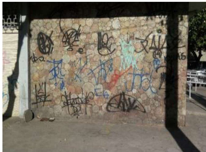
Fotografia 11: Pichação Estilo reprodução realizada com tags de pichadores na Avenida Alberto Torres, centro da Cidade.

Enquanto a Pichação Estilo Reprodução prioriza a repetição da marca do pichador por meio da sua assinatura, as denominadas tags. Esse estilo é utilizado principalmente por pichadores iniciantes, onde busca por meio da reprodução exaustiva de sua tag o reconhecimento na sociedade e entre os demais pichadores. O suporte para a realização das pinturas é cuidadosamente selecionado. A fotografia 11 demonstra a preferência de pichadores pelos muros revestidos com pedras, o que torna a pintura “eterna” pelo grau de dificuldade de limpeza dos muros e assim a assinatura se torna “eterna” ou até que o muro seja demolido.