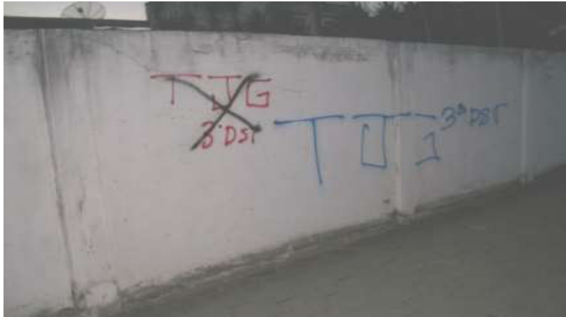
Fotografia 10: Pichação ligada às facções do tráfico. Rua Dr. Pereira Nunes.

Enquanto a Pichação Estilo Reprodução prioriza a repetição da marca do pichador por meio da sua assinatura, as denominadas tags. Esse estilo é utilizado principalmente por pichadores iniciantes, onde busca por meio da reprodução exaustiva de sua tag o reconhecimento na sociedade e entre os demais pichadores. O suporte para a realização das pinturas é cuidadosamente selecionado. A fotografia 11 demonstra a preferência de pichadores pelos muros revestidos com pedras, o que torna a pintura “eterna” pelo grau de dificuldade de limpeza dos muros e assim a assinatura se torna “eterna” ou até que o muro seja demolido.