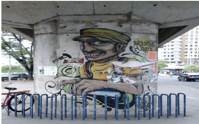
Fotografia 1: Graffiti realizado pelo Progressivo Artcrew no ano de 2011, na área central da cidade.

Foi então, a partir da realização do encontro de grafiteiros que se formou o grupo “Progressivo Artcrew (PAC)”, a partir da união de grafiteiros, sejam eles de Campos ou de municípios vizinhos. A Progressivo ArtCrew se mantém em Campos até os dias atuais.