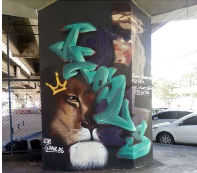
Fotografia 2: Graffiti 3D feito no viaduto pelo grafiteiro Kane KS.

JESUS sob um Leão. Simbologias advindas de religiões neo-pentecostais que se embrenham em áreas periféricas e passam a ser referências para grafiteiros inseridos nesses contextos urbanos.