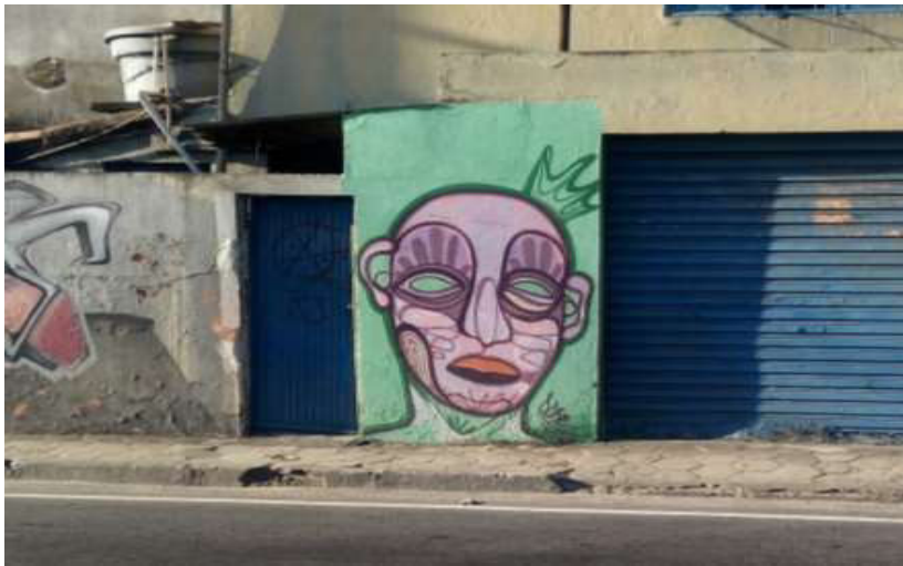
Fotografia 9 Graffiti Domeio realizado na Avenida 28 de Março.

Por fim, o estilo de Graffiti Domeio, um estilo único criado pelo grafiteiro Murilo Domeio, onde utiliza de traço mais firmes e marcados, assemelhando-se a características tribais para a composição de sua arte. As máscaras criadas por Domeio encontram-se inscritas em lugares dispersos na cidade, em muros pintados com cores fortes (Fotografia 9) que passam a ser incorporadas ao traço do artista. É como se o proprietário do imóvel tivesse preparado o muro para receber tais obras que costumam permanecer por muito tempo na cidade.