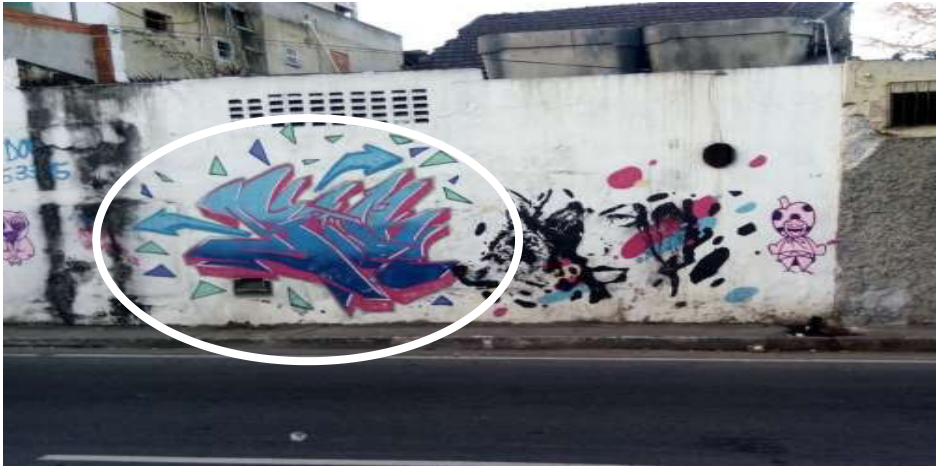
Fotografia 3 Graffiti Wildstyle realizado na Avenida 28 de Março pelo grafiteiro Gouk.

O Bomber, também conhecido também como vômito ou throw-up. Estilo caracterizado por apresentar letras cujas aparências são de expressões gordas e que parecem estar vivas. Essa técnica, geralmente utiliza-se de duas ou três cores, sendo ela a forma mais praticada por grafiteiros e pichadores iniciantes, por não requerer muita habilidade técnica e nem conseguem se posicionar politicamente.