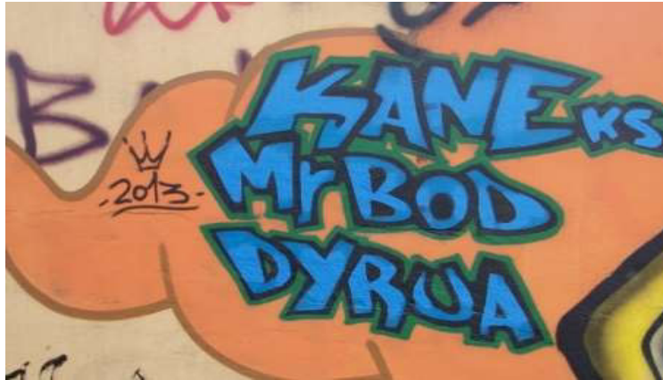
Fotografia 5: Graffiti estilo Letras Grafitadas. Praça da República, Centro, Campos dos Goytacazes (RJ).

O Graffiti artístico ou livre figuração, um estilo mais elaborado em técnica, estilo e expressão de ideias. Os artistas apresentam elementos que fazem parte do mundo do grafiteiro, ou seja, esta modalidade é caracterizada por proporcionar a liberdade artística do seu autor, bem como a incorporação de caricaturas, personagens de histórias em quadrinhos, figurações abstratas e realistas e discutem temas políticos discutidos em um dado contexto sócio-geográfico-histórico-cultural. Na representação a seguir (Fotografia 6), obra criada por uma crew de grafiteiras denominada Teta-a-toa, as artistas discutem questões de gênero, o papel da mulher na sociedade e as formas de trabalho em que as mulheres atuam e atuam na cidade de Campos dos Goytacazes (Fotografia 7).