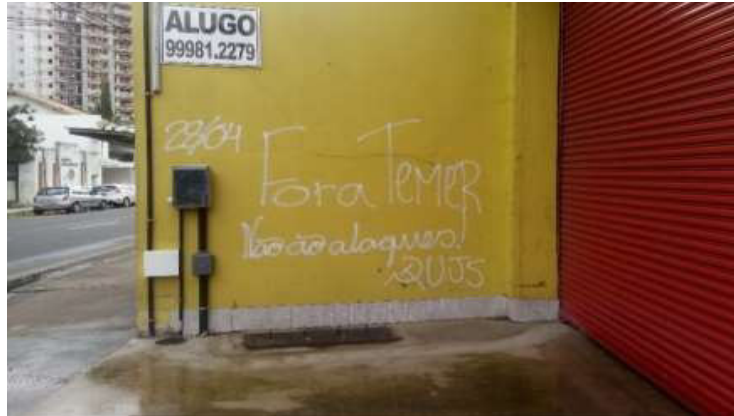
Fotografia 12: Pichação Politizada na Av. Pelinca.

sempre são criadas ao mesmo tempo em que acontecem marchas, passeatas ou atos que devem criar comunicação com pessoas que não tenham participado dos atos, mas que as fazem pensar sobre o tema.