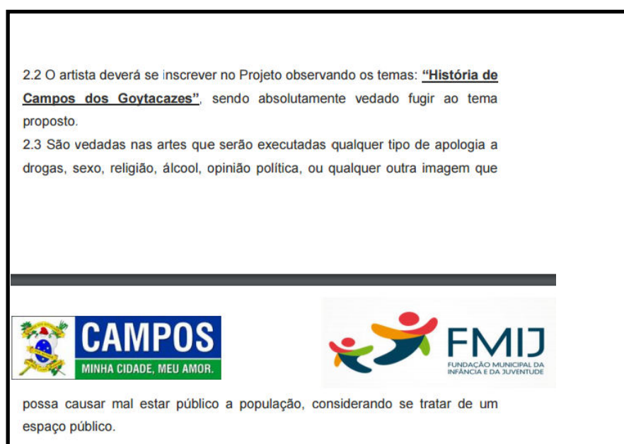
FIGURA 1: Fragmento do Edital do Primeiro Festival de Graffiti em Campos dos Goytacazes, no ano de 2016.

Se em sua essência o graffiti foi originado como uma arte urbana subversiva e efêmera, onde grafiteiros utilizavam de tags para assinar seus trabalhos, hoje, na cidade Campos dos Goytacazes, o que vimos é um processo de transformação da arte urbana, onde o graffiti perdeu seu caráter marginal e os artistas passam se integrar em contextos até então não acessados, como as escolas de artes, as oficinas oferecidas em centros culturais ou serem chamados para atuarem em oficinas oferecidas pelas secretarias municipais de cultura, de entretenimento ou da infância e da juventude e até mesmo para decorar quartos de crianças e jovens de classes abastadas. Em Campos dos Goytacazes, quando o graffiti é produzido a partir dos festivais financiados pela municipalidade (Figura 1), as pinturas deixam de ser uma arte marginal e passam a ser uma expressão aceita pela sociedade.