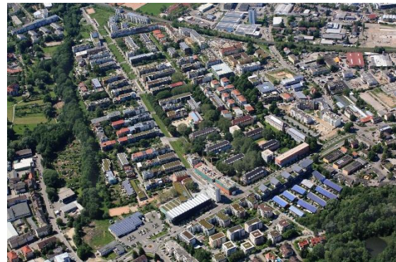
Figura 4- Imagem aérea de Vauban em 2012.