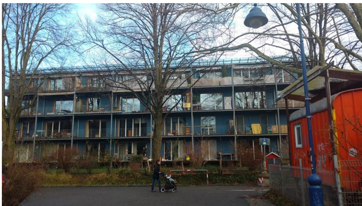
Figura 7- Bloco do Baugruppe : “Wohnen + Arbeiten”.

Quanto aos custos finais dos Baugruppen em Vauban e em outros distritos de Freiburg, em comparação aos preços do mercado imobiliário tradicional, foi disponibilizado pelo conselheiro do GRAG, Roland Veith, no ano de 2006, para o pesquisador Joseph Little, por e-mail , os valores médios por m 2 / área útil, incluindo a porção referente aos custos da terra. É válido lembrar que no Baugruppe não existe um agente que lucre com a habitação, sendo os valores apresentados representações fidedignas dos valores do terreno e da construção, além dos possíveis valores de venda, se fosse o caso (LITTLE, 2007).