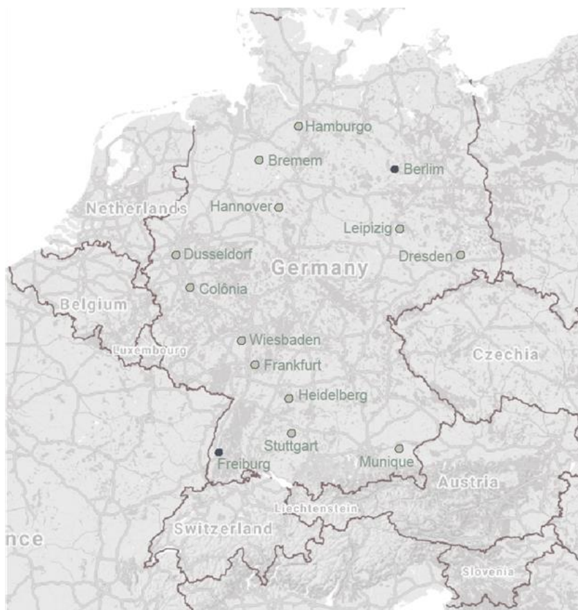
Figura 1- Mapa da Alemanha e marcação das cidades de Freiburg e Berlim.

A ausência de opções habitacionais nos centros urbanos não é uma novidade para os pesquisadores das cidades contemporâneas. Raquel Rolnik em seu livro, a Guerra dos Lugares , de 2015, alerta sobre os perigos da financeirização da habitação e da transformação da habitação em apenas um ativo financeiro, diz ainda o quanto esse processo não reserva em si nenhum ineditismo, mas que é fruto da desconstrução contínua da habitação como um bem social e a sua conversão incessante em apenas uma mercadoria. Tendo em vista essas críticas, o presente artigo irá demonstrar qual o impacto da experiência de coabitações habitacionais na Alemanha, intitulada Baugruppen – na tradução livre, grupos de construir –, como uma alternativa a maneira usual de se pensar a construção das habitações e, por conseguinte a construção da própria cidade através das habitações.