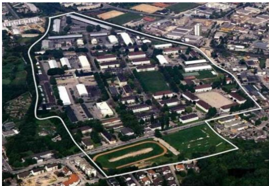
Figura 3- Imagem aérea de Vauban, em 1992.