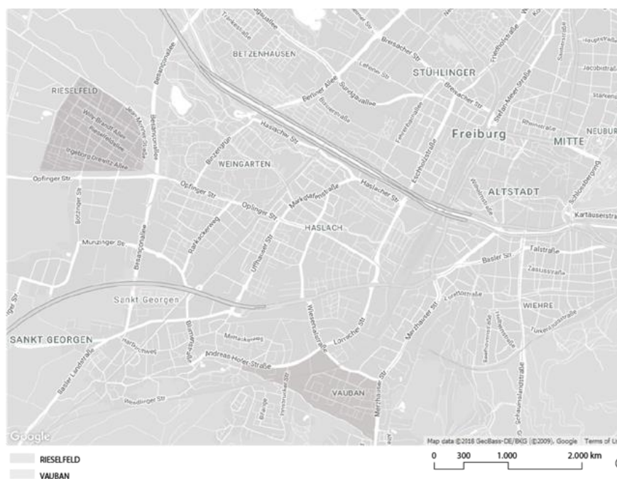
Figura 2- Mapa da cidade de Freiburg com a marcação dos bairros de Riesel Feld e Vauban.

Freiburg (HAMIDUDDIN & DASEKING, 2014). Ao contrário do que se possa pensar inicialmente, não foram os estudantes ou ecologistas que se mostraram veementemente contra a ideia, e sim os vicultores que, por medo das consequências que as usinas pudessem trazer para a produção de vinhos, se manifestaram em oposição aos desejos governamentais e atrasaram a construção das usinas em um processo que durou mais de dez anos, o que deu tempo suficiente para que a população se articulasse e encontrasse outras formas de geração de energia para a cidade (MOURA, 2010).