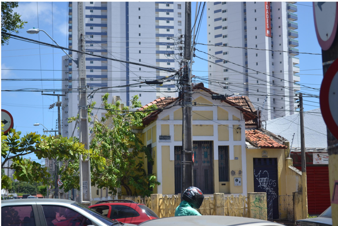
Imagem 1: Frente de verticalização resultante da instituição da ZOP, no Centro de Fortaleza: Av. Dom Manoel.