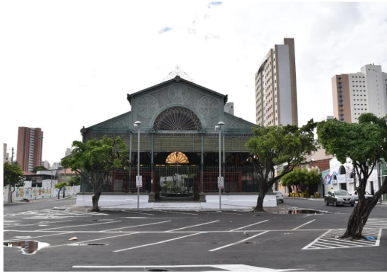
Imagem 2: Verticalização recente no entorno imediato dos Pinhões.

Vale ressaltar que tais instrumentos democráticos figuram no Estatuto em caráter indicativo, exigindo regulamentação por cada município brasileiro, através de cada Plano Diretor ou lei específica. Já outros advieram da referência a experiências localizadas de