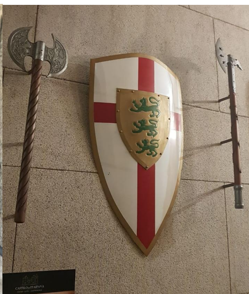
Figura 4 - Escudo e machados ornando parede interna do Castelo.

No entanto, o objetivo do Castelo de Itaipava como empreendimento não é informar, mas sim transportar o consumidor a um mundo de fantasia em uma lógica de parque temático onde qualquer menção à uma realidade ordinária poderia quebrar o encanto. É exatamente por isto que foi construído no pátio de estacionamento um enorme monumento, uma estátua cuja função é preservar a memória do “nobre cavaleiro medieval” e que foi edificada em grande escala possibilitando se vista da estrada. A placa memorativa possui dizeres que exaltam a persona armada, destacam suas características de valentia e dizem ser esta a figura de um “homem de honra e de caráter exemplar”. Não há ponderação sobre terem sido homens de guerra treinados para matar, integrantes de uma nobreza exploradora de uma classe servil e não há nenhuma menção sobre a data de inauguração deste monumento. Porém, para alguém de olhar crítico, é de fácil constatação que este monumento ao cavaleiro medieval não é contemporâneo ao castelo, mesmo que isto esteja implícito pela ausência de informação. A pedra da base do monumento não é a mesma das paredes do castelo e possui porosidades distintas. O material da armadura da estátua é o mesmo material das outras estátuas que decoram os ambientes do Castelo (Figura 4) e parece ser alguma liga de zinco e cobre que é conhecida popularmente como latão.