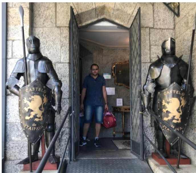
Figura 5 - Armaduras ornando a entrada principal do Castelo de Itaipava.

No caso do Castelo de Itaipava, o visitante consumidor da cultura da indústria cultural em nenhum momento questiona-se o porquê da existência de um castelo de traços medievais em pleno solo brasileiro, um país sem história medieval. Da mesma forma, em nenhum momento a empresa administrante concede a informação do porquê desta excentricidade e o único esforço informativo é a existência de uma única placa com dizeres extraídos da dissertação de Mestrado da Arquiteta Ana Salade (2013) que aponta o castelo como um projeto renomado à sua época.