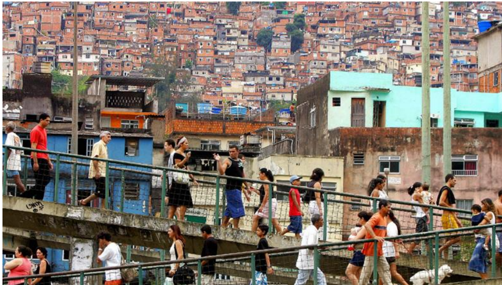
Figura 1. Rocinha, Rio de Janeiro.