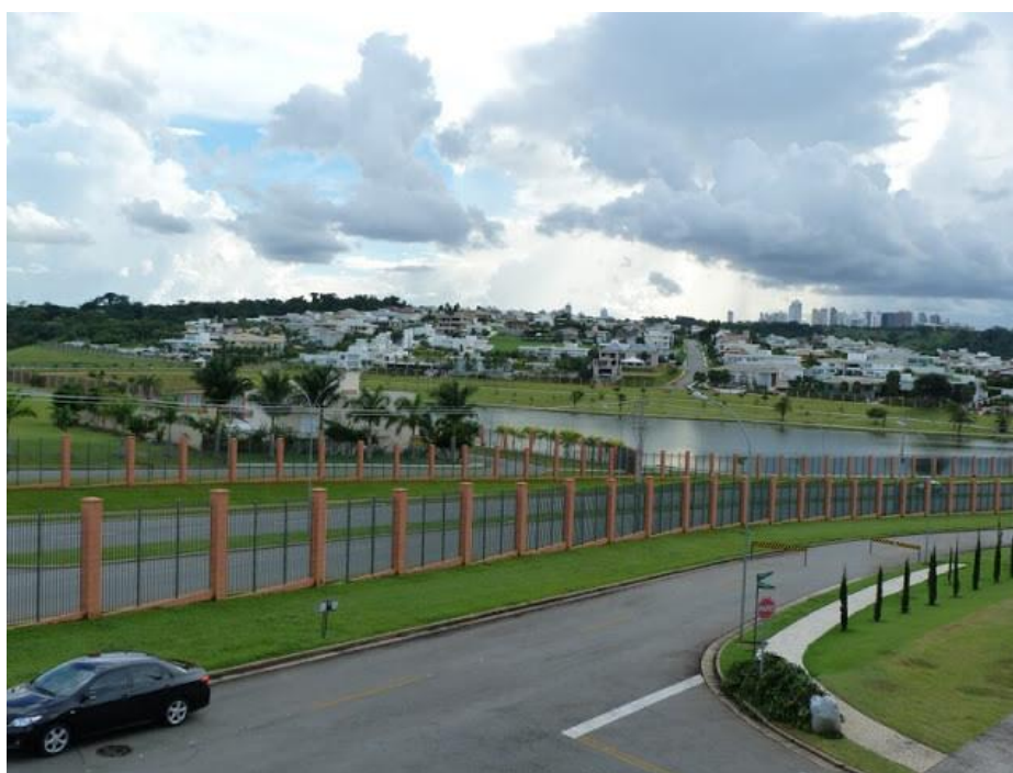
Figura 5. Grades de um condomínio horizontal fechado em Goiânia, Brasil.

caracteriza esta opção de moradia é a procura de se resguardar dos problemas cotidianos das cidades como a falta de segurança; e por isso também acontece uma materialização física de limites entre grupos sociais e uma delimitação do abastecimento de equipamentos urbanos dentro numa área específica (figura 5); assim os moradores dispõem do que necessitam e evitam a vida coletiva.