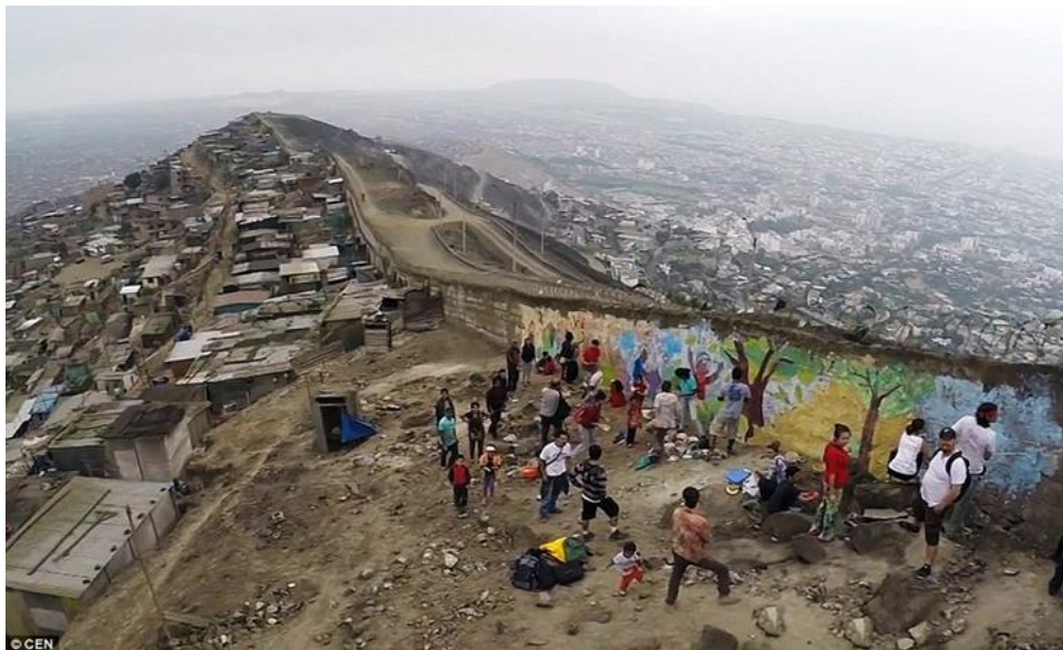
Figura 3. Muro divisor de bairros em Lima, Peru.