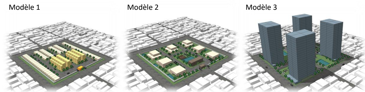
Figure 2 – Trois modèles de communautés fermées

C'est possible d'identifier trois formes principales de communautés fermées (Figure 2) : les condominiums pour la classe moyenne, avec des petites maisons horizontales ou des tours de quatre étages et très peu d'espaces communs (modèle 1) ; les grands complexes urbains horizontaux de maison de luxes avec un importante centre de loisir (modèle 2) ; et les condominiums verticaux, avec des tours de bâtiments et des espaces de loisirs collectifs (modèle 3) (MELGAÇO, 2012). Indépendamment de la diversité des noms, concepts et métaphores utilisés pour désigner ces formes urbaines, leur prolifération est notoire lorsqu'on analyse l'urbanisation brésilienne (SPOSITO, 2009).