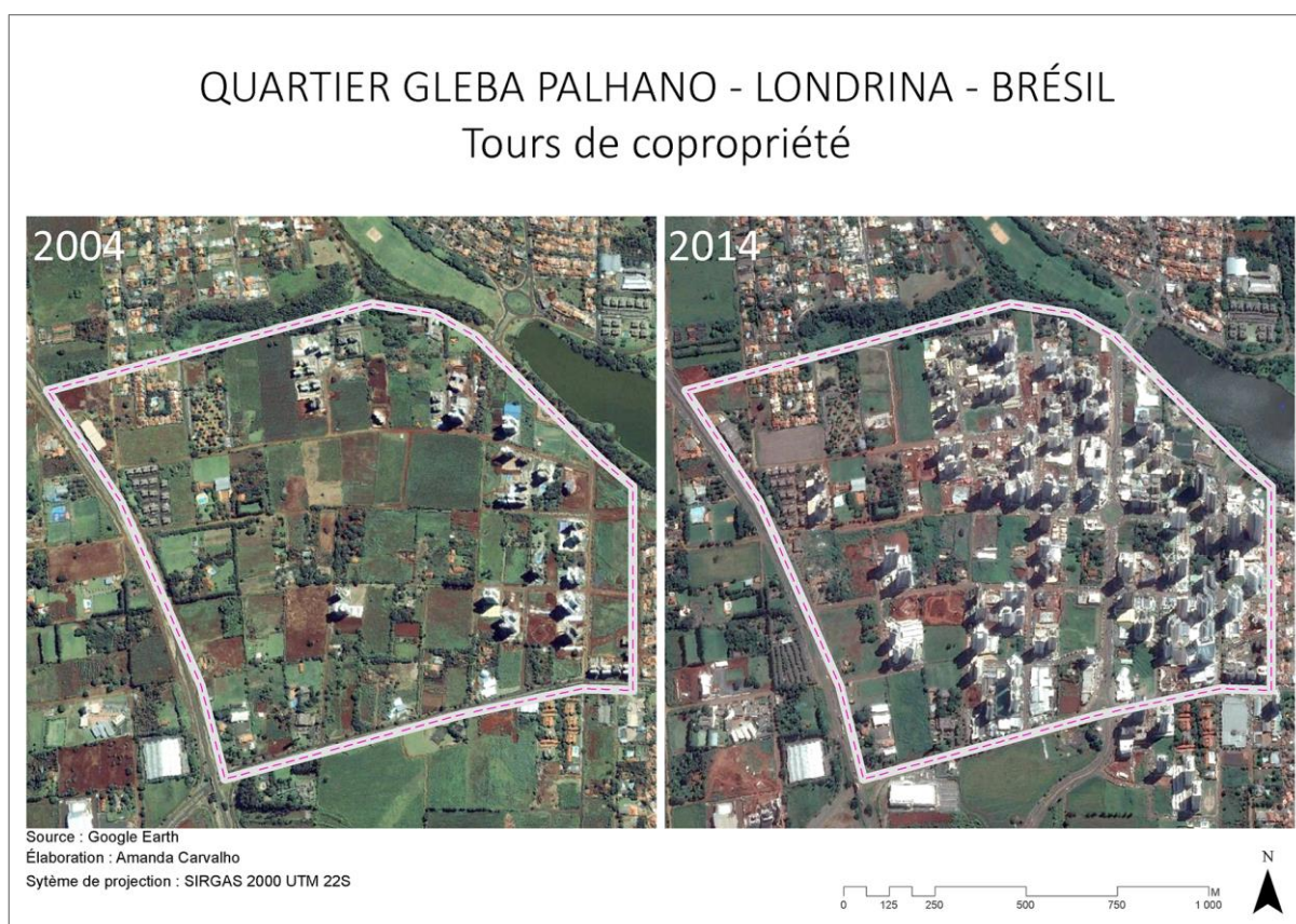
Figure 5 - Quartier Gleba Palhano - construction de tours de copropriété | 2004-2014

ségrégation socio spatiale abordent surtout les « gated communities » horizontaux, présentant une dynamique particulièrement différente des quartiers ouverts de tours de copropriétés. Le fait d'avoir une barrière physique pour accéder à l'intérieur de condominiums crée, entre autres, de la discontinuité dans le tissu urbain et de la séparation forcée entre les résidents qui y habitent et ceux de quartiers avoisinants. Cependant, les quartiers de tours de copropriétés sont ouverts et ne présentent pas de barrières physiques, mais d'une certaine manière ils semblent produire une barrière sociale, qui est construite socialement, historiquement et mentalement dans l'inconscience de la population. Autrement dit, les quartiers de tours de copropriétés ne conforment pas des enclaves physiquement fermées, mais socialement fermées.