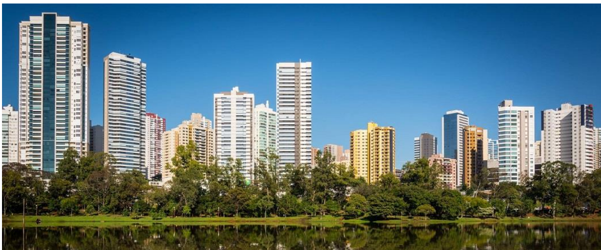
Figure 1 - Quartier Gleba Palhano

Afin de vérifier ces hypothèses, nous proposons l'étude de cas du quartier « Gleba Palhano », situé à Londrina dans la région sud du Brésil. Depuis la fin des années 1990, le quartier se développe de façon intense et débridée, sans considérer les problèmes urbains qui s'en découlent. La « Gleba Palhano » est un quartier, essentiellement résidentiel, destiné à la classe moyenne et aisé, et actuellement présente une grande concentration de tours de copropriétés comme le témoigne la Figure 1.