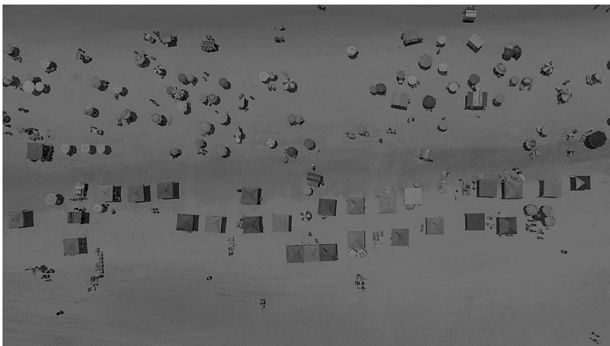
Figura 1- imagem áerea da praia Brava de Matinhos.

Na análise da distribuição dos turistas, veranistas e trabalhadores ambulantes na faixa de areia ao longo da Orla é possível identificar alguns padrões espaciais de ocupação(Figura 1). A imagem mostra dois espaços diferenciados destinados aos turistas: o primeiro deles abriga os proprietários de tendas(geralmente na cor azul ou verde) que são grupos maiores de famílias ou amigos que pagam semanalmente pelo serviço de montagem e manutenção da estrutura. E o segundo espaço, delimita uma faixa de guarda sóis mais próximo ao mar que abriga os turistas e veranistas de passagem, ou de grupos menores e mais itinerantes. Percebe-se ainda que os carrinhos dos ambulantes guardam entre si uma distância de aproximadamente 50 metros que ocasionalmente pode variar conforme a dinâmica geomorfológica da praia. Assim quando ocorrem chuvas e temporais em geral há formação de pequenos riachos de água pluvial que desembocam no mar e por muitas vezes se constituem como empecilhos para o acesso ao comércio ambulante.