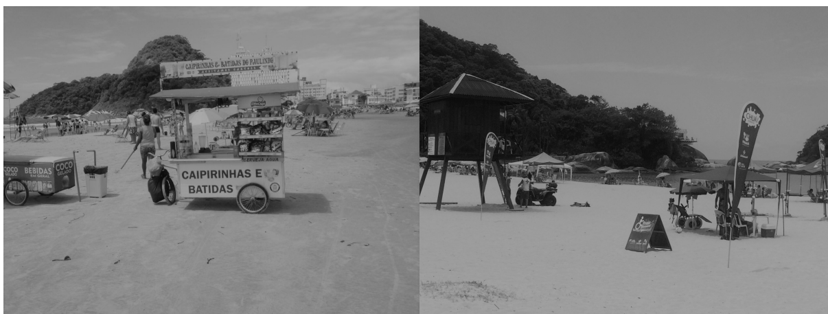
Figura 2 e 3 – Comércio ambulante na praia Brava e estrutura de ducha e guarda vida na praia Mansa.

Na análise da distribuição dos turistas, veranistas e trabalhadores ambulantes na faixa de areia ao longo da Orla é possível identificar alguns padrões espaciais de ocupação(Figura 1). A imagem mostra dois espaços diferenciados destinados aos turistas: o primeiro deles abriga os proprietários de tendas(geralmente na cor azul ou verde) que são grupos maiores de famílias ou amigos que pagam semanalmente pelo serviço de montagem e manutenção da estrutura. E o segundo espaço, delimita uma faixa de guarda sóis mais próximo ao mar que abriga os turistas e veranistas de passagem, ou de grupos menores e mais itinerantes. Percebe-se ainda que os carrinhos dos ambulantes guardam entre si uma distância de aproximadamente 50 metros que ocasionalmente pode variar conforme a dinâmica geomorfológica da praia. Assim quando ocorrem chuvas e temporais em geral há formação de pequenos riachos de água pluvial que desembocam no mar e por muitas vezes se constituem como empecilhos para o acesso ao comércio ambulante.