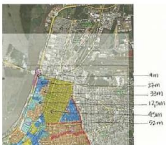
Figura 1a. Limites de altura estipulados pelo PDDUA em 1999.

Em uma possível tentativa de atrair a construção civil para densificar o território, desde o PDDUA de 1999 o limite de alturas é alto e contínuo uma em parte da área do 4º Distrito, abarcando trechos dos bairros Floresta, São Geraldo e Navegantes - em amarelo na figura 1a –, contudo, o limite desta área foi ampliado de 45m para 52m na versão do plano de 2010 - em vermelho na figura 1b - (TITTON, 2012), sendo esta a única mancha contínua de limite máximo de altura, pois no restante da macrozona 1 este limite só é permitido em grandes avenidas. Nas figuras 1a e 1b abaixo é possível observar também que aumentaram os limites para construção em outras partes do 4º Distrito, conforme indicam as setas com os valores de alturas.