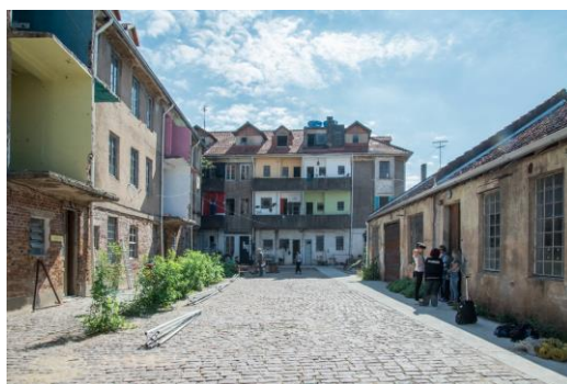
Figura 4. Vila Flores.

Destacamos na atuação da sociedade civil e seus impactos no debate sobre a renovação do 4º distrito a importância da chegada da Associação Cultural do Vila Flores. Inserida na discussão sobre Patrimônio Histórico, a Associação é resultado de uma iniciativa familiar de restaurar de um conjunto de prédios históricos para a construção de um espaço cultural, abrigando grupos vinculados a iniciativas de economia criativa. O espaço é hoje referência no território, possuindo forte atuação no bairro Floresta e realizando diversas atividades culturais que mobilizam diversas pessoas na cidade.