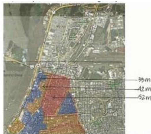
Figura 1b. Limites de altura estipulados pelo PDDUA em 2010.