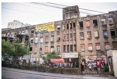
Figura 5. Assentamento 20 de Novembro.

Outro ator importante no bairro Floresta é o Movimento Nacional de Luta por Moradia (MNLM), a partir do Assentamento 20 de Novembro, no qual também são realizados diversos eventos políticos, sociais e artísticos. O Assentamento é fruto da ocupação de um prédio vazio, pertencente a União, em 2007, trazendo para o debate da cidade a relação entre moradia social e áreas centrais de Porto Alegre (MARX e ARAÚJO, 2016). Depois de uma década de luta, as cerca de 18 famílias que moram no prédio, vão garantir o seu direito à moradia. Em 2018, o MNLM conquistou o direito de uso para habitação de interesse social. O Assentamento conta com um Projeto de Revitalização sustentável do espaço que prevê a criação de espaços multidisciplinares para geração de renda, lazer e, inclusive, educação infantil (FLECK, 2018 13 ).