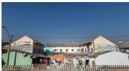
Figura 6. Vila dos Papeleiros.

Destacamos também que no 4º distrito, na rua Paraíba, no bairro Floresta, localiza-se a oficina de reciclagem dos catadores (Arevipa), bem como abriga um ponto tradicional de prostituição de mulheres e travestis. Uma rua sobre a qual “ninguém fala” 14 . Em realidade, a rua não figura nas ações de revitalização num sentido propositivo, mas compõe o contexto discursivo de degradação, violência e desqualificação da paisagem urbana do 4º distrito.