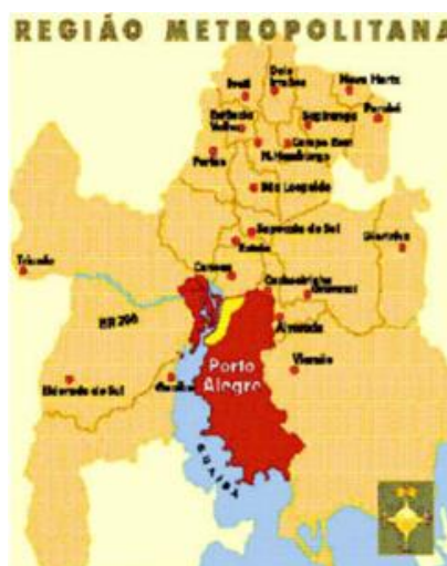
Figura 2. Mapa com a localização do 4º distrito na Região Metropolitana de Porto Alegre: