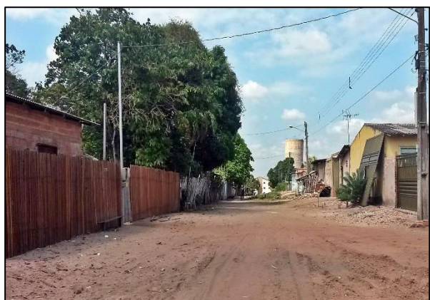
Figura 06 - Ocupação Rua Palhão.