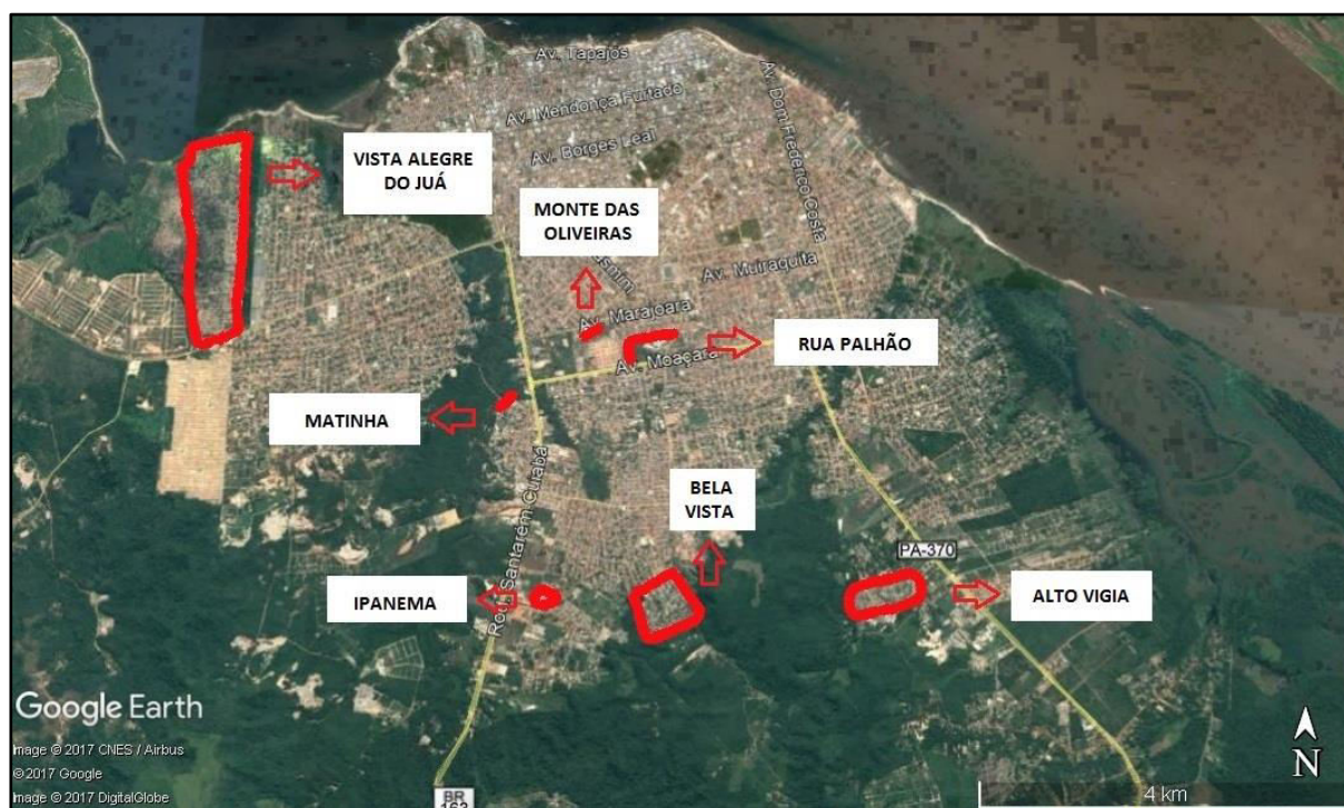
Figura 01 - Mapa das principais ocupações urbanas em Santarém-PA.