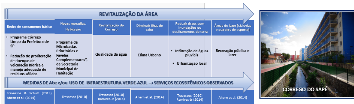
Figura 3: Atividades associadas com infraestrutura verde e azul e serviços ecossistêmicos.

Considera-se que as melhorias nas condições do curso d'água (limpeza, canalização, etc.) e entorno visam garantir melhor condições de habitação aos moradores, redução de riscos a alagamentos e deslizamentos de encostas, redução de proliferação de doenças de veiculação hídrica e manejo adequado de resíduos sólidos. Essas melhorias agregam diversos serviços ecossistêmicos urbanos, dentre os quais destacam-se serviços culturais provisionados por herança cultural e serviço potencial de educação. Na Figura 3 estão sintetizados algumas medidas de Abe, que valorizam a infraestrutura verde e azul, no projeto de revitalização do córrego do Sapé.