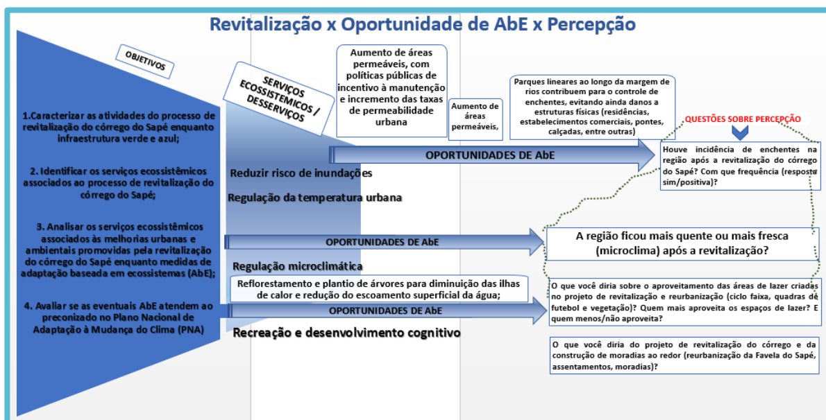
Figura 2: Análise de percepção com os objetivos específicos da pesquisa e aplicação do questionário