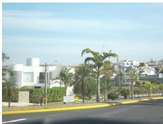
Figuras 19 e 20 – Homogeneidade padrão construtivo Resid. Damha III e Resid. Damha II Fonte: Arquivo pessoal. 2018.