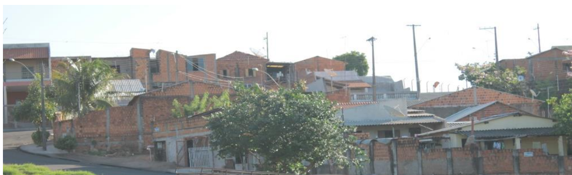
Imagem 16 – Homogeneidade Jardim Humberto Salvador