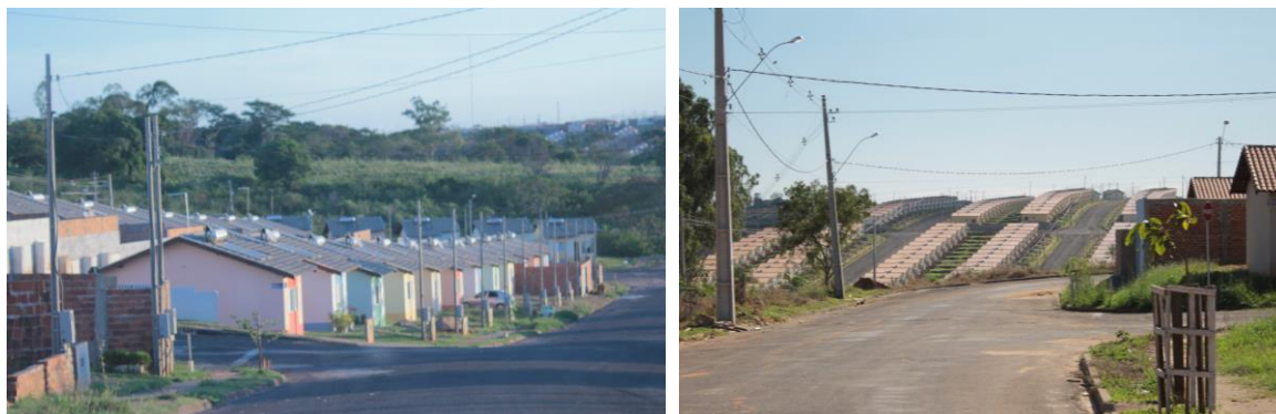
Figuras 13 e 14 – Homogeneidade Conjunto João Domingos Neto

Figura 16, se refere ao Jardim Humberto Salvador, com grande presença de edificações auto-construídas.