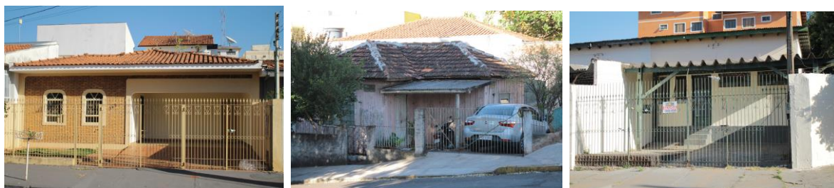
Figura 01 a 03 – Diversidade de padrão construtivo no Jardim Bongiovani e Vila Liberdade

Esta diversidade no conteúdo material formador da paisagem urbana pode ainda ser encontrada até os dias atuais, como é possível ser observado pelas Figuras 01 a 06, capturadas na proximidade do Jardim Bongiovani e Vila Liberdade, bairros localizados ao sul do Córrego do Veado. As imagens incluem residências de madeira, algumas outras originais do conjunto habitacional que foi implantado nessa área em 1967, e outras de residências de padrão mais elevado. Também pode ser observado nas Figuras 07 a 10, capturadas nas proximidades da Vila Glória.