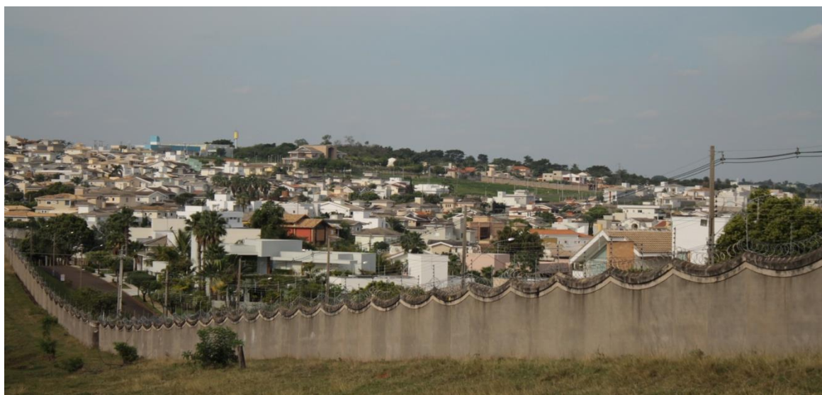
Figura 21 –Residencial Damha I