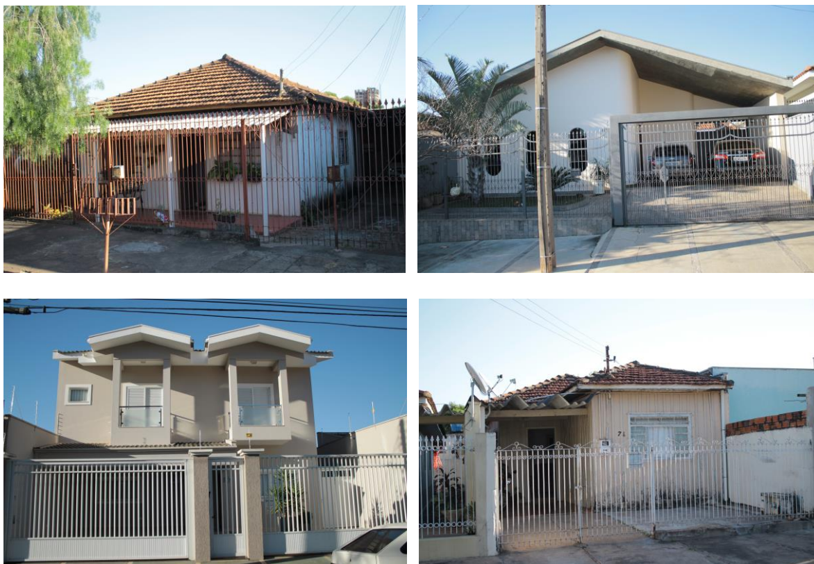
Figura 07 a 10 – Diversidade de padrão construtivo na Vila Glória Fonte: Arquivo pessoal. 2016.

Enquanto estas primeiras imagens demonstram os diferentes padrões construtivos presentes nestas áreas, as Figuras 11 e 12, capturadas na área pericentral entre o Parque do Povo, a Avenida Manoel Goulart e a Avenida Cel. José S. Marcondes, demonstram como este conjunto edificado se constitui como elemento material formador da paisagem urbana. Nestas imagens é possível observar uma grande diversidade de texturas, gabaritos, cores, massas vegetativas, materiais, etc.