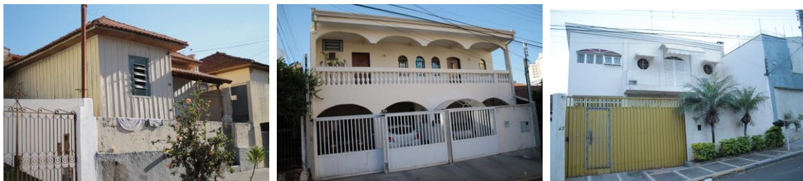
Figura 03 a 06 – Diversidade de padrão construtivo no Jardim Bongiovani e Vila Liberdade Fonte: Arquivo pessoal. 2016