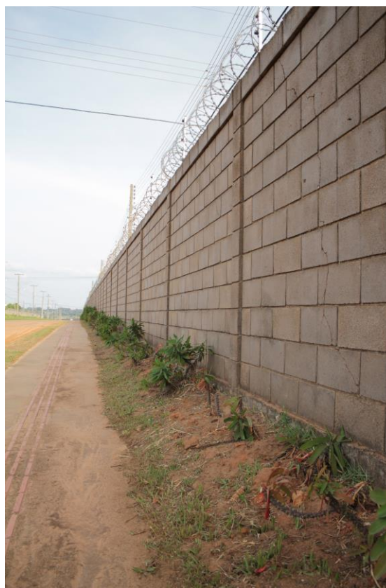
Figuras 17 e 18 – Muros e elementos de segurança- Residencial João Paulo II e Resid. Damha Beatriz