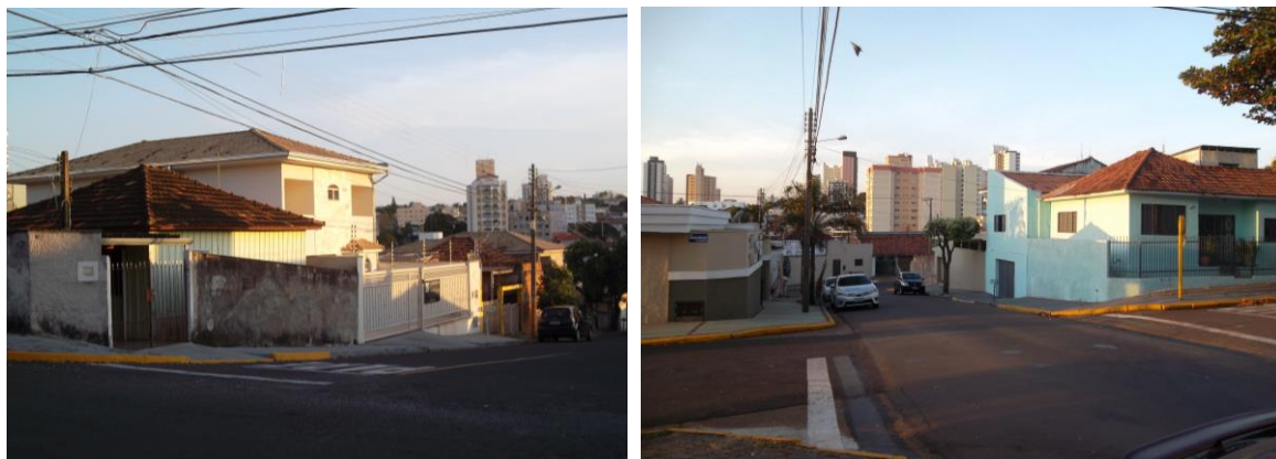
Figura 11 e 12 – Diversidade do conteúdo material paisagístico da área pericentral