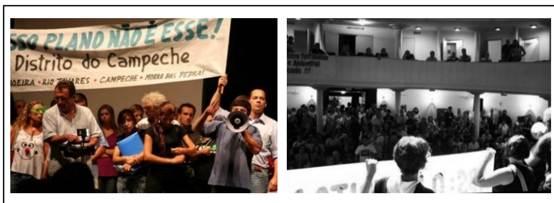
Figura 04. Audiência Pública Municipal no TAC. 18 de março de 2010.