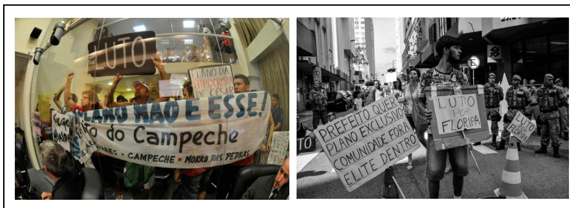
Figura 05: manifestações em frente à Câmara Legislativa municipal