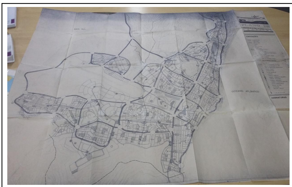
Figura 02: mapa de vias locais, de pedestres e equipamentos urbanos do Plano de Desenvolvimento do Campeche

Em 1989, o Instituto de Planejamento Urbano de Florianópolis – IPUF deu início a elaboração do Plano de Desenvolvimento da Planície Entremares (conhecido por Plano de Desenvolvimento do Campeche - PDC). Este amplo e pretencioso projeto previa a construção de largas rodovias, parque tecnológico e diversos empreendimentos imobiliários e comerciais, sobre a vasta área de planície onde se encontra o bairro do Campeche, localidade de frágeis ecossistemas que, até meados os anos 1980, possuía uma urbanização pouco consolidada, e que combinava os usos rurais ao que ainda hoje se constitui em um elemento da identidade local, associada à pesca tradicional. No ano seguinte, foi redigida a “1ª Carta dos Moradores do Campeche sobre os Projetos de Urbanização da Área”, a qual, partindo da rejeição do projeto da prefeitura, colhia reivindicações dos moradores, sendo este o primeiro conjunto sistemático de propostas para a elaboração do que viria posteriormente a se constituir no plano diretor comunitário.