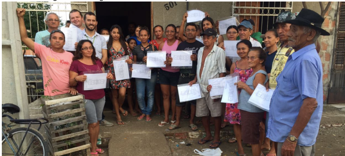
Figura 7 – Entrega dos desenhos técnicos para moradores do Assentamento Jean Silva

de maneira inadequada em casas autoconstruídas, tem seu espaço previsto considerando a redução de custo e do impacto da intervenção quando da reforma das residências.