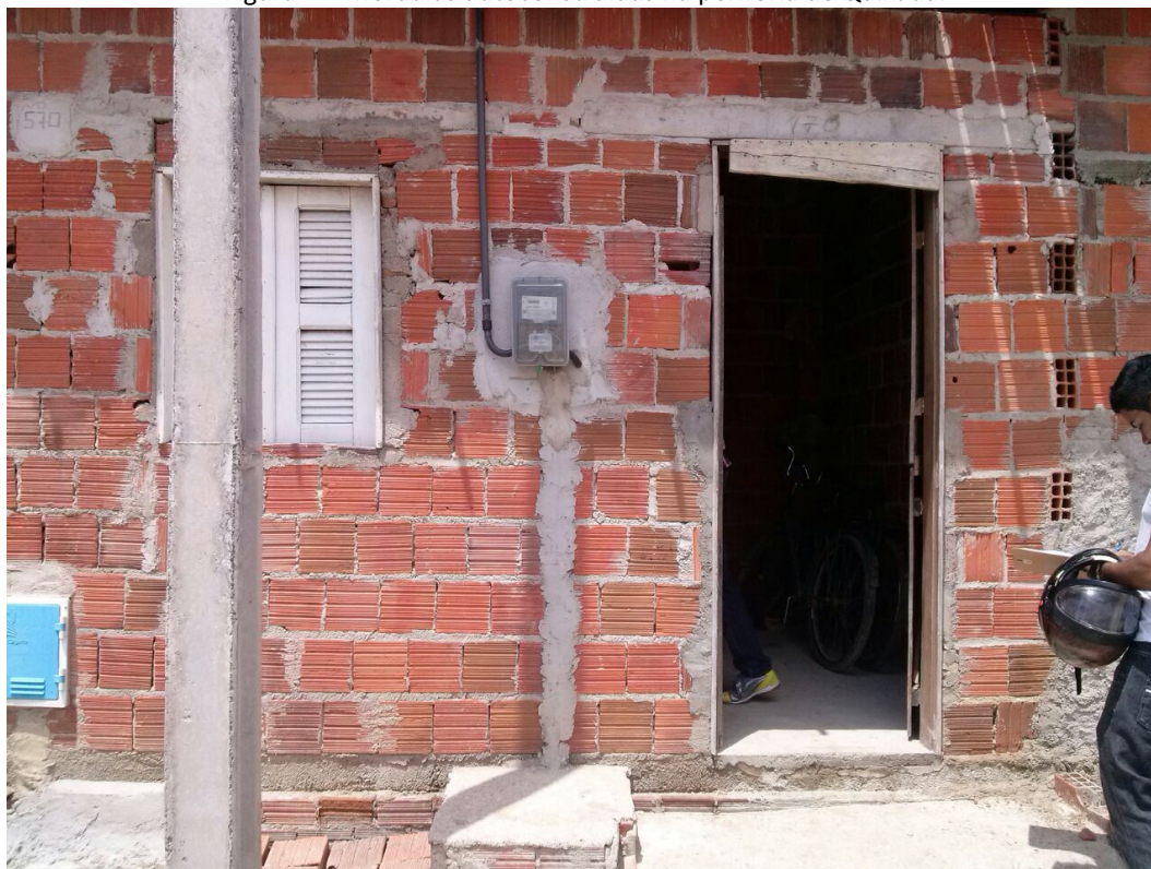
Figura 1 – Moradias autoconstruídas na periferia de Quixadá.

O conceito de autoconstrução se refere ao processo no qual os próprios moradores assumem a gestão da produção de suas moradias, adquirindo material, contratando profissionais ou atuando diretamente na construção ou reforma de suas moradias. Não se limita às obras onde os moradores trabalham diretamente. Inclui também as realizadas por profissionais pagos, geralmente da mesma vizinhança e que atuam sob gestão direta dos proprietários. Neste caso, os moradores se constituem como empreendedores, mas não necessariamente da mão de obra, embora seja comum o trabalho de familiares como ajudantes, eventualmente em mutirões.