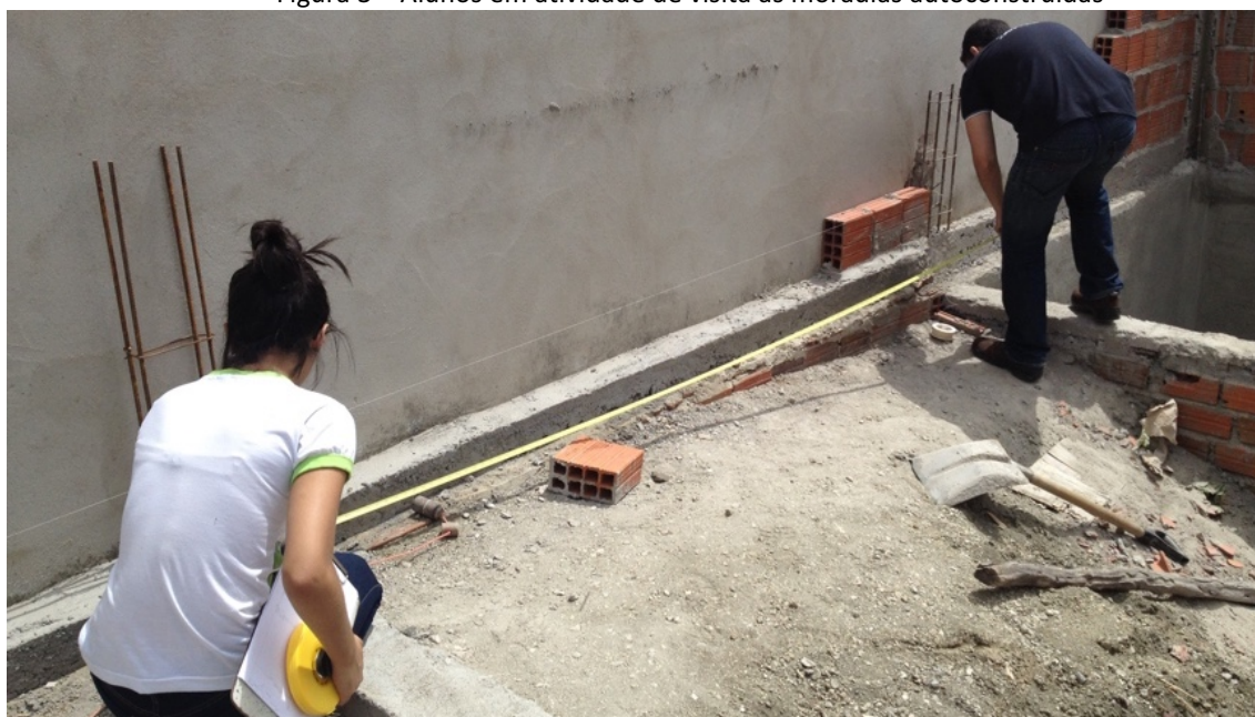
Figura 3 – Alunos em atividade de visita às moradias autoconstruídas

Para as duas áreas assessoradas pelo Escritório Modelo, foram identificadas como demandas: desenhos técnicos que orientassem as famílias que ainda iriam construir nos lotes vagos e orientações técnicas para aquelas cuja casa já havia sido iniciada ou concluída mas precisava de melhorias. Como forma de buscar entender e analisar a realidade das famílias e das edificações por ela ocupadas, foram feitas visitas de campo para medição das casas e coleta de dados sobre as casas e também aspectos socioeconômicos das famílias.