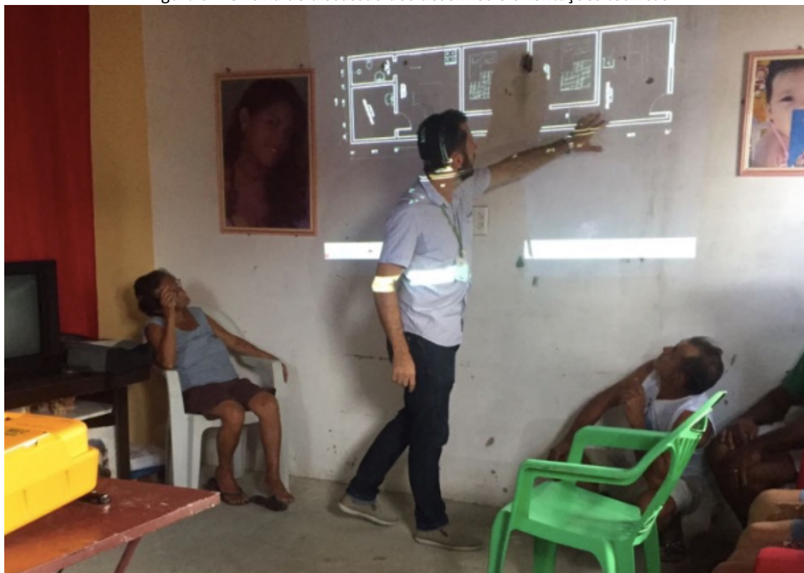
Figura 5 – Oficina de discussão dos desenhos e orientações técnicas

seguinto um planejamento e um conjunto de orientações técnicas, exatamente o oposto do normalmente se observa na prática.