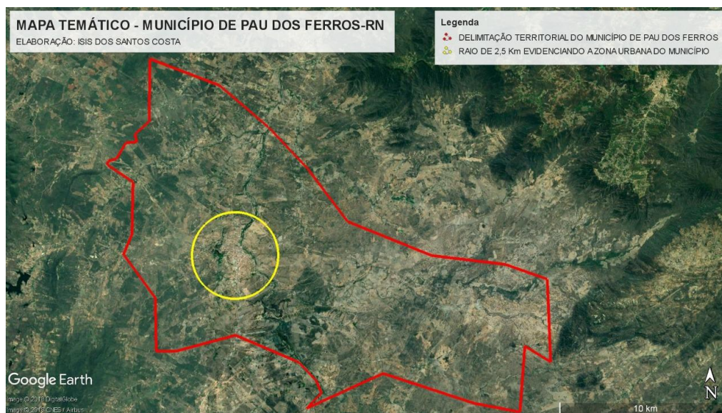
Figura 1: Localização do Município de Pau dos Ferros pela ferramenta computacional Google Earth Pro