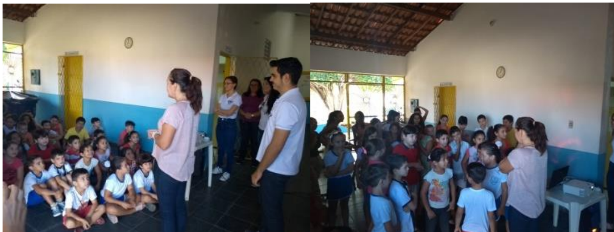
Figura 4: Palestras realizadas nas escolas com as crianças do município.

juntamente com sua coordenadora. A Figura 4 a seguir mostra os registros fotográficos realizados pelos discentes na etapa.