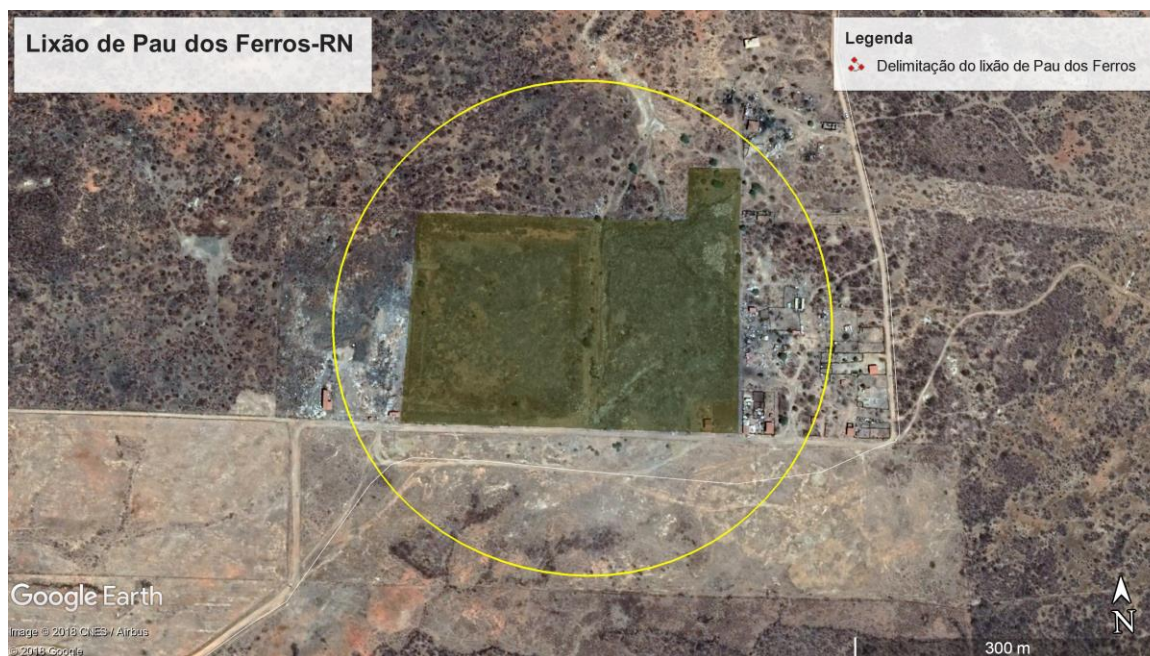
Figura 2: Lixão de Pau dos Ferros a partir da ferramenta computacional Google Earth Pro

A Figura 2 a seguir mostra a imagem do atual lixão de Pau dos Ferros, retirada da ferramenta computacional de georreferenciamento Google Earth, nela é possível verificar o quantitativo de lixo posto no ambiente.