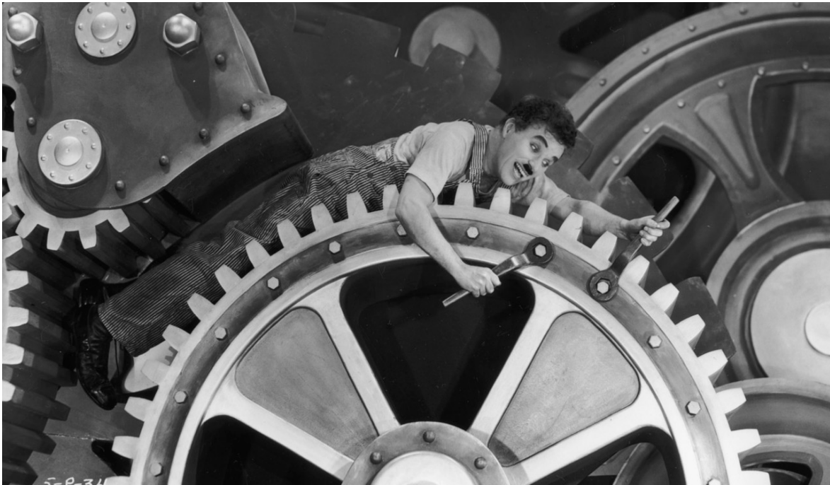
Fig. 2 - Tempos modernos , de Charles Chaplin, 1936.

maquímicos, agendas programáticas e atividades ditas funcionais (vide a nomenclatura dos dias da semana considerados úteis ).