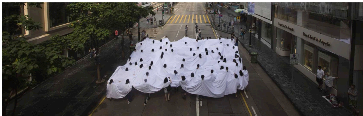
Fig. 6 - Performance Divisor , de Lygia Pape (original de 1968) reeditada em Hong Kong, 2013.

Talvez essa nova postura garantisse a possibilidade de absorvermos em nossas práticas projetuais o entendimento sobre dinâmicas plurais, de adaptação aos distintos contextos, à flexibilização tão necessária em nossas cidades múltiplas e dissonantes. Talvez um novo paradigma do tempo relativizasse a ideia de firmitas como um dos grandes pilares da arquitetura e nos liberasse para um urbanismo contemporâneo de usos mais fluidos, ocupações mais dinâmicas, materiais perecíveis, arquiteturas nômades e efêmeras de qualidade, outras mobilidades e uma visão aberta e transformadora sobre patrimônio, museificação e cristalização das cidades. Talvez, enfim, a arquitetura, o urbanismo e o planejamento urbano, pudessem repensar sua função e lançar mão de outros modos de participação estética-política, novas maneiras de fazer, de dar visibilidade e de pensar a cidade e seu projeto: heterogêneo por natureza e em constante transformação no tempo.