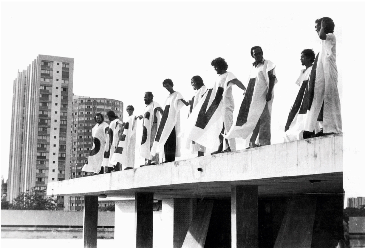
Fig. 5 – Registro fotográfico da performance Poesia Viva , de Paulo Bruscky, 1977.

Para Rancière, as artes poderiam reconfigurar essa distribuição geral de atividades através de suas próprias maneiras de fazer. Não seria necessariamente uma mudança posta em ação, mas talvez a transformação de pensamentos sobre as ações ou sobre formas de participação nas experiências sensíveis que são a base da política. Rancière indica que é nesse nível da vida comum das pessoas, do recorte sensível do comum, de suas formas de visibilidade e de sua distribuição que a questão estética/política se impõe. Esta seria uma chave para outras maneiras de fazer e, principalmente, de pensar o processo de projeto, de entender o tempo do e no projeto das cidades: do tempo heterogêneo.