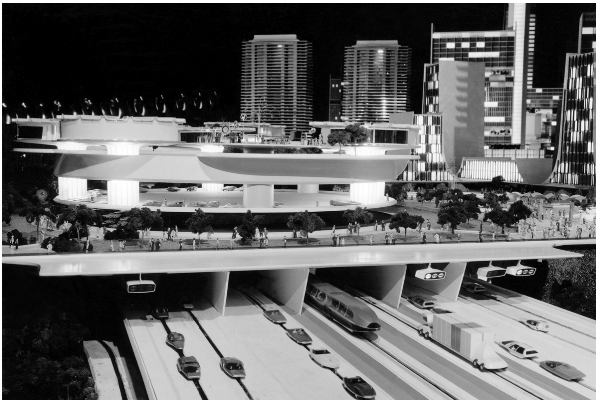
Fig. 4 – Maquete da exposição Futurama , promovida pela General Motors, Nova York, 1939.

Não bastasse a aceleração constante a que a sociedade moderna se submetia e, dialeticamente, promovia, o estado de permanente construção e reconstrução de Nova York e de seus ícones urbanos desempenhava um papel de comunicação, como exemplo a ser seguido por todo ocidente. Para Berman