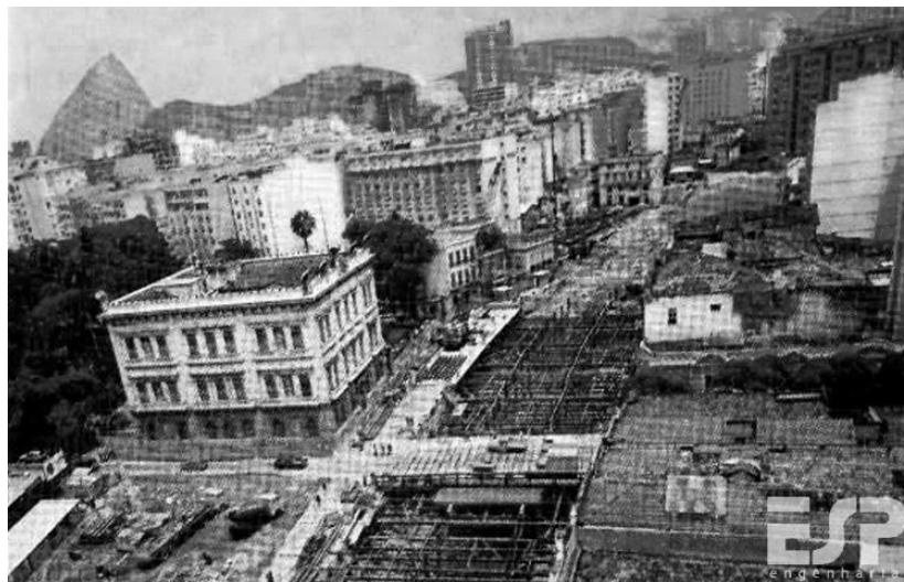
FIGURA 1 - A foto acima mostra a obra do metrô na altura da Rua Silveira Martins em frente ao Palácio do Catete, podemos notar o terreno vazio onde se encontrava antes a Escola Rodrigues Alves.

A demolição de grande parte do casario de numeração ímpar da Rua do Catete destruiu o cenário bucólico, embora sombrio, daquela rua. O largo que se abria no espaço fronteiro ao Palácio do Catete, após um percurso estreito em curvas, era de uma dramaticidade inigualável. Hoje, uma ampla perspectiva se abre de longe, acabando com aquele fator que a urbanista portuguesa Maria da Luz chama de espaço da surpresa. (PCRJ, 2017)