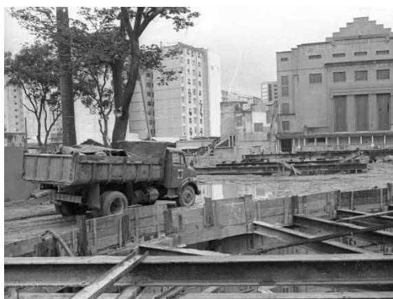
FIGURAS 5 E 6 - As fotos acima mostram a verdadeira terra arrasada que se transformou o Largo do Machado e a Rua do Catete durante as obras do Metrô nos anos 70.