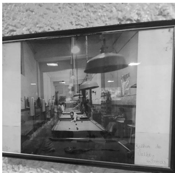
FIGURA 9 e 10 - Antiga fachada Café Lamas no Largo do Machado e Salão de Bilhar Café Lamas no Largo do Machado, não existe mais o salão no novo endereço.