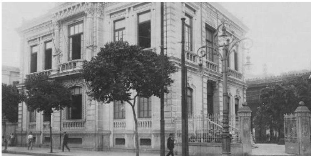
FIGURA 2 - A foto mostra a Escola Rodrigues Alves, na esquina da Rua do Catete com a Rua Silveira Martins. O imóvel foi demolido durante as obras do metrô na década de 1970.