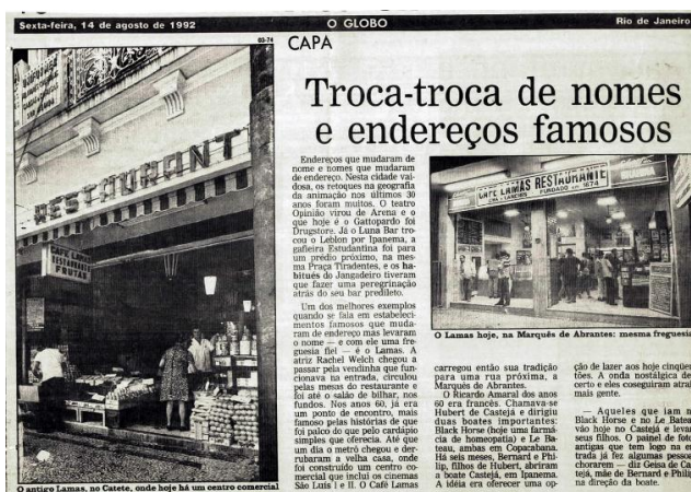
FIGURA 8 - A imagem acima mostra uma reportagem do Jornal O Globo do dia 14/08/1992 abordando famosos estabelecimentos que mudaram de localização no Rio de Janeiro e cita o Café Lamas, mostrando o antigo no Catete e o novo no Flamengo.

Qualquer sujeito percebe estas possibilidades, à sua maneira, e se orienta de modo diferente em relação a elas (...) cada fragmento (cada pessoa) é diferente dos outros, mesmo tendo muitas coisas em comum com eles, buscando tanto a própria semelhança como a própria diferença. É uma representação do real mais difícil de gerir, porém parece-me ainda muito mais coerente, não só com o reconhecimento da subjetividade, mas também com a realidade objetiva dos fatos. (Burke, 1992, p. 72).