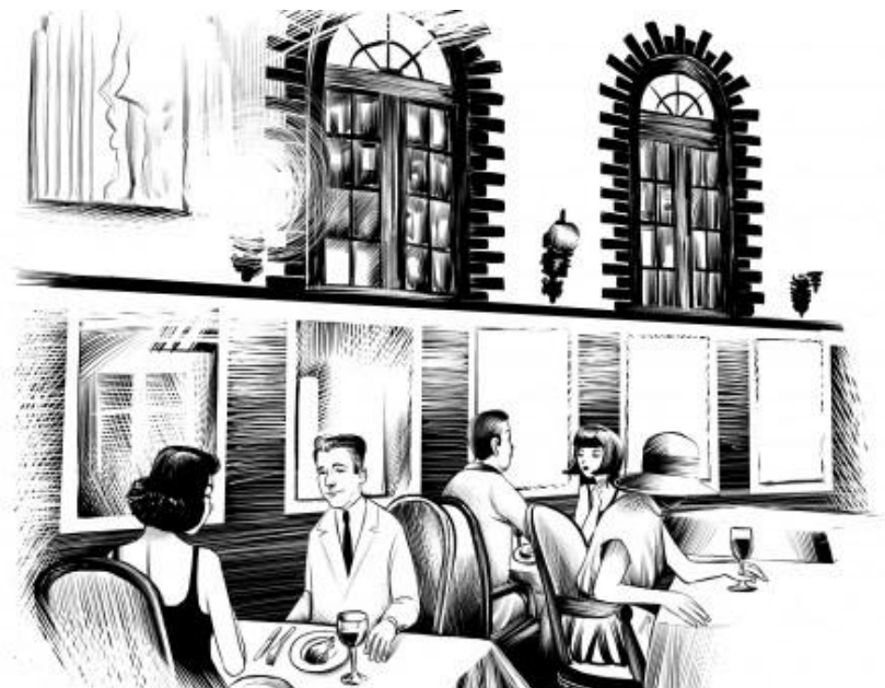
FIGURA 7 - A imagem acima mostra um desenho do Lamas da Paladar do Jornal Estadão

O estabelecimento assistiu, entre outros momentos e fatos históricos, a uma mudança de sistema de governo (de monarquia para república); ao fim da escravidão; à troca da capital federal; a duas longas ditaduras e a nove moedas diferentes. Na sede original, conheceu longas fases de boemia, com direito a mesas de sinuca nos fundos. Teve frequentadores como Rui Barbosa, Di Cavalcanti e Oscar Niemeyer.