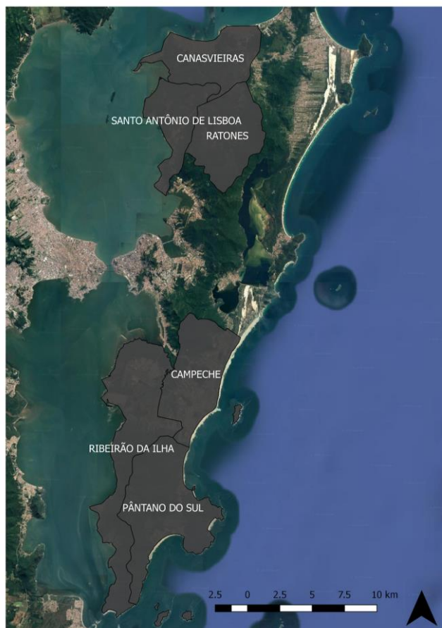
Imagem 2 - Distritos que contém AUEs em Florianópolis