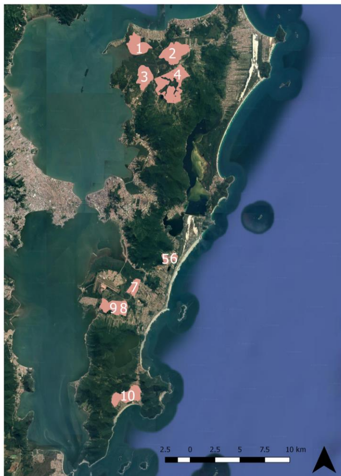
Imagem 1 - Localização das AUEs em Florianópolis