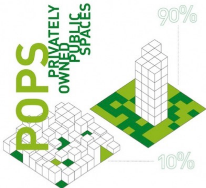
FIGURA 2 - Lógica de Ocupação dos Espaços Urbanos com os POPS