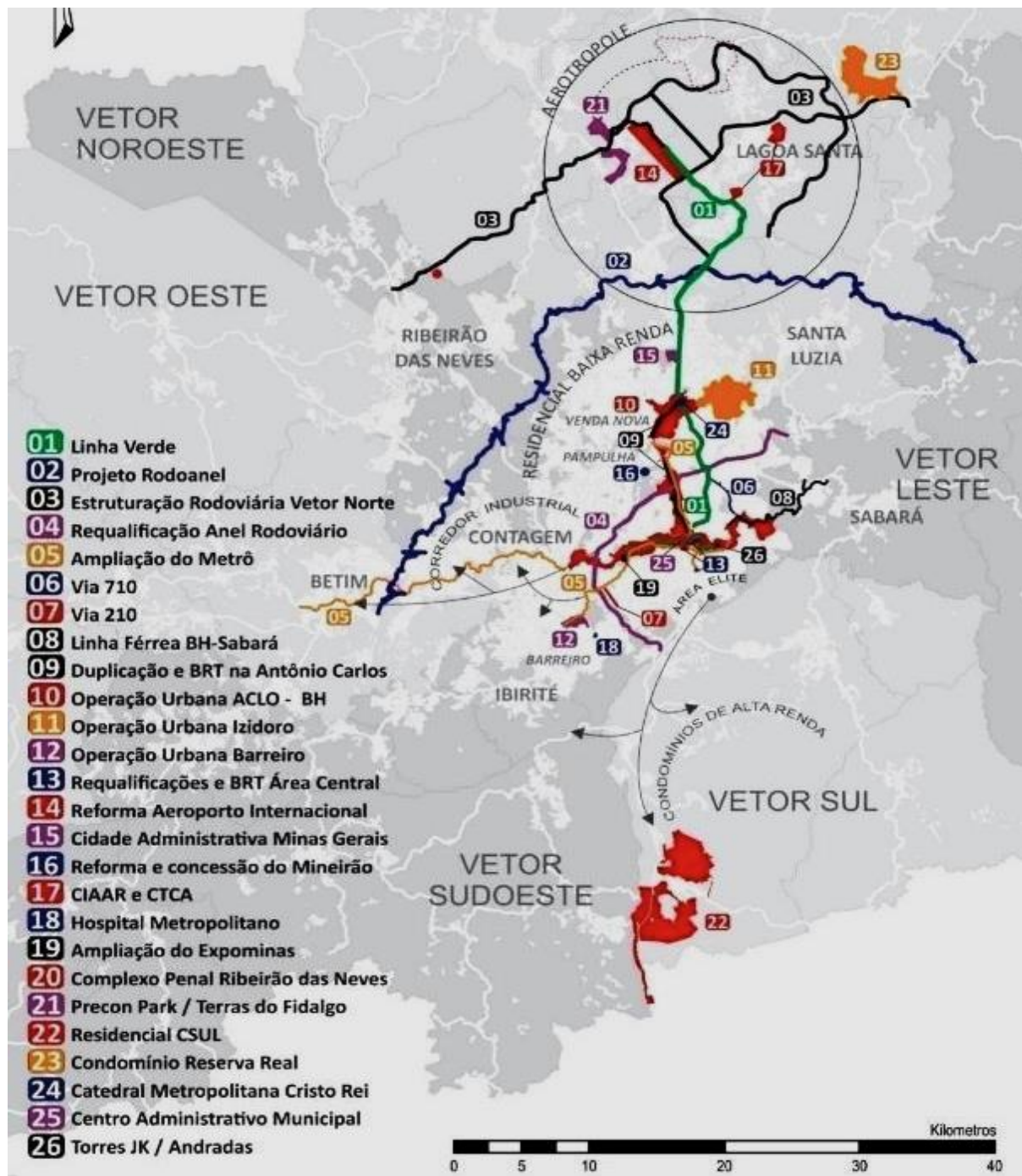
FIGURA 1. Mapa com a localização dos GPU estudados na RMBH (AUTOR, ANO)