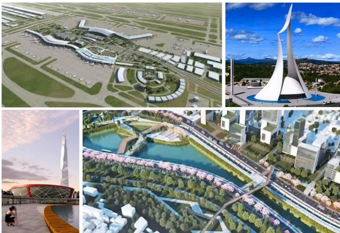
FIGURA 4. Uso de imagens na produção de GPUs na RMBH: (1) ampliação do aeroporto internacional para viabilizar conceito de aerotrópole; (2) Catedral metropolitana projetada por Oscar Niemeyer; (3) Projeto da maior torre da América Latina que passou por diferentes configurações nos anos seguintes; e (4) Parque a ser viabilizado por Operação Urbana .

campo técnico para o campo simbólico, de mais difícil confrontação e maior eficácia em campo marcado por capitais políticos, econômicos especulativos e culturais. Nesse contexto, a abstração é um meio eficaz de aproximar o espaço urbano local com as frágeis referências internacionais, construindo uma legitimação por analogia e intensificando a potencial criação de consensos em torno de determinados GPU.