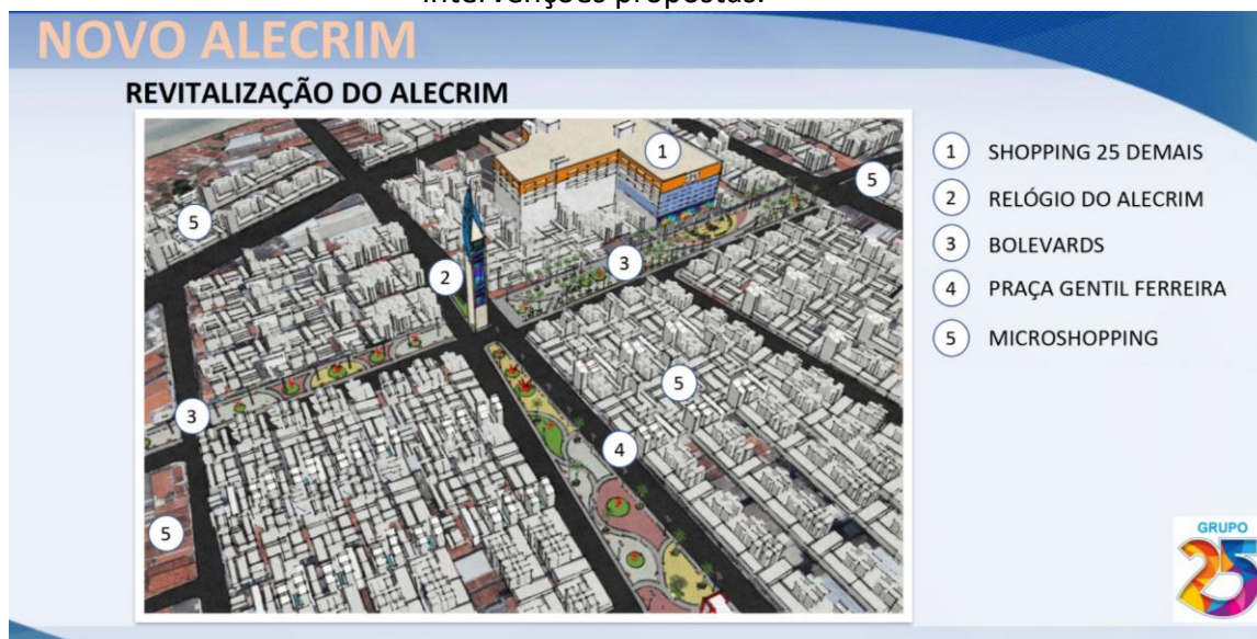
Figura 1 – Trecho de apresentação do Grupo 25 com indicação de parte das intervenções propostas.

E, por outro lado, o Camelódromo, seria transformado em um “espaço de convivência” (mas ele não já se configura como tal?) dando a possibilidade aos camelôs de “migrar para um dos três novos centros comerciais que estão previstos para serem construídos” (SILVA, 2017). Na mesma entrevista, o secretário não hesita em comentar sobre os interesses privados que norteiam as modificações no bairro: “A prefeitura estabeleceu uma relação com o grupo empresarial e empresário não investe sem previsão de retorno. Então estão investindo em uma área da cidade por acreditarem no retorno, estão expandindo o negócio deles” (SILVA, 2017).