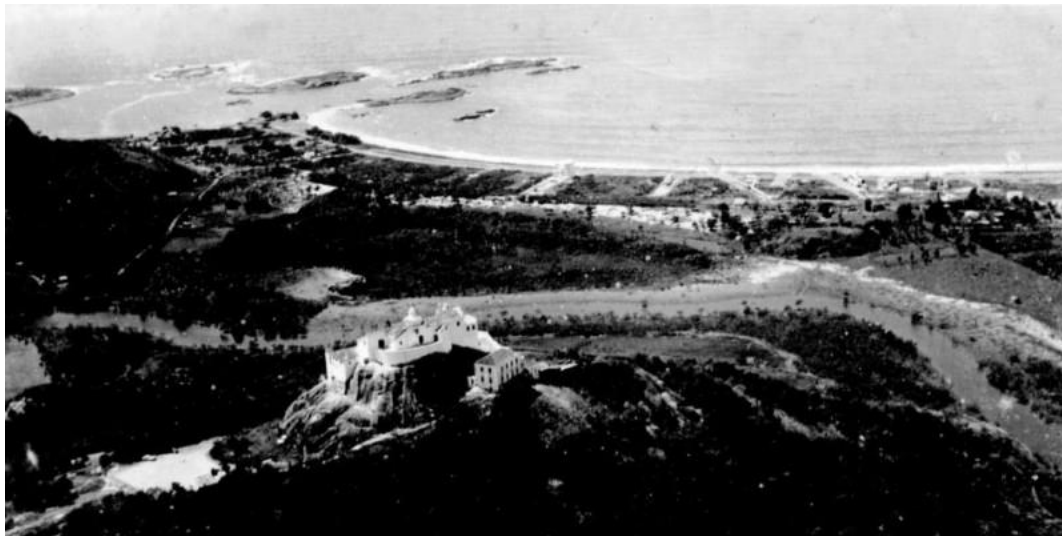
Figura 2: Rio da Costa passando entre os morros do Convento e Morro do moreno (1950)