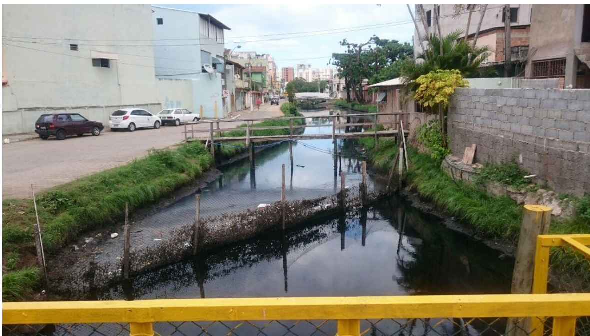
Figura 7: Trecho ocupado do canal da Costa, no bairro Divino Espírito Santo, Vila Velha/ES

Além disto, a falta de trabalho e qualificação da mão de obra dos milhares de pessoas chegaram ao município, geraram outro problema social, o desemprego. Estes fatores alavancaram o empobrecimento urbano, aumentando invasões e construções irregulares de baixa e média renda, em toda a periferia municipal, incluindo as margens dos canais (figura 7).