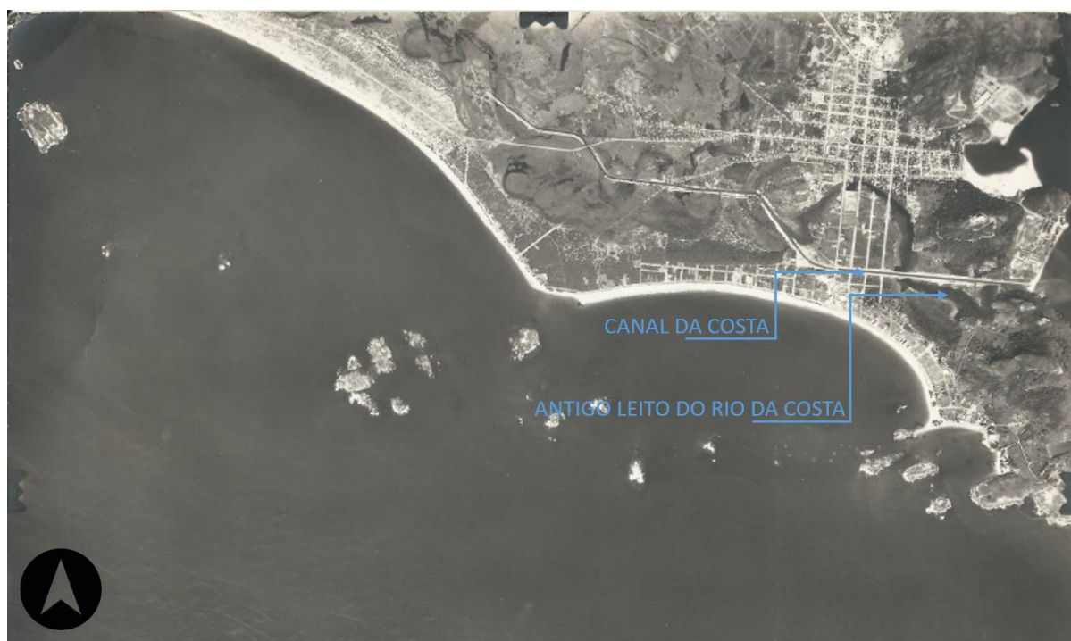
Figura 6: Foto aérea litoral de Vila Velha com destaque para o canal da Costa

A retificação do canal da Costa dragou as águas do rio da Costa, expandindo a área do centro de Vila Velha em direção ao litoral (figura 4). Os aterros nas áreas alagadas, justificados oficialmente como higienização e combate a doenças trazidas por mosquitos, ocasionou a ocupação das praias da Costa e a praia de Itapuã. Este movimento favoreceu a valorização imobiliária destas áreas, que com o passar dos anos se tornou de grande interesse do mercado imobiliário e sendo posteriormente ocupadas pela classe média alta.