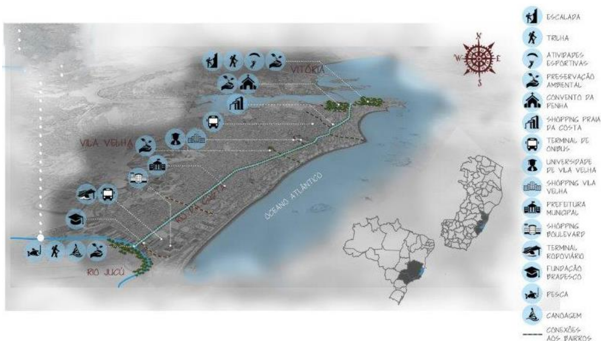
Figura 8: Ocupações ao longo do Canal da Costa