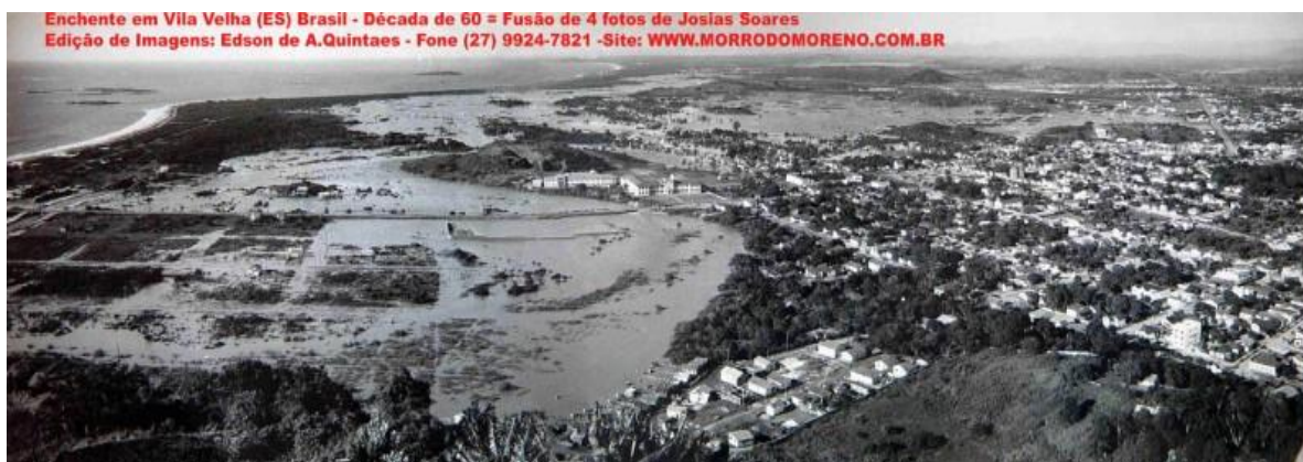
Figura 4: Vista de Vila Velha na histórica enchente de 1960