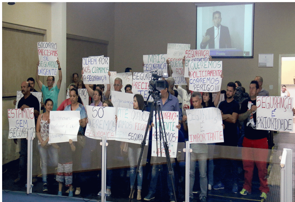
Figura 3: Imagem do protesto na Câmara Municipal de Valinhos, pedindo mais segurança no bairro, realizado por moradores do São Bento do Recreio em 5/12/2017.