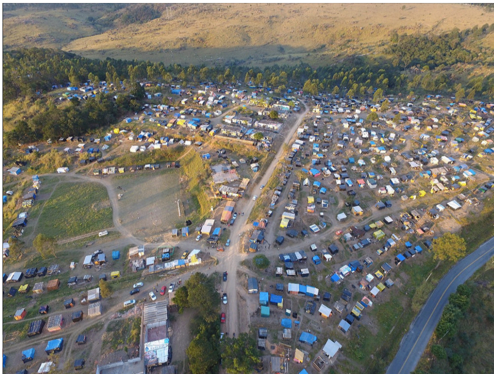
Figura 6 – Foto do Acampamento “Marielle Vive!”