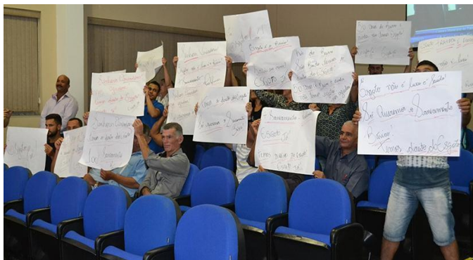
Figura 2: Moradores do loteamento São Bento do Recreio protestam na Câmara de Valinhos em 11/04/2017, solicitando a ligação da rede de tratamento de esgoto sanitário.

Ainda assim, referido assentamento ainda espera a regularização das demais quadras irregulares do loteamento e algumas obras de infraestruturas, como foi possível verificar nos protestos feitos pelos moradores e ocorridos ao longo do ano de 2017 (ver figuras 2 e 3).