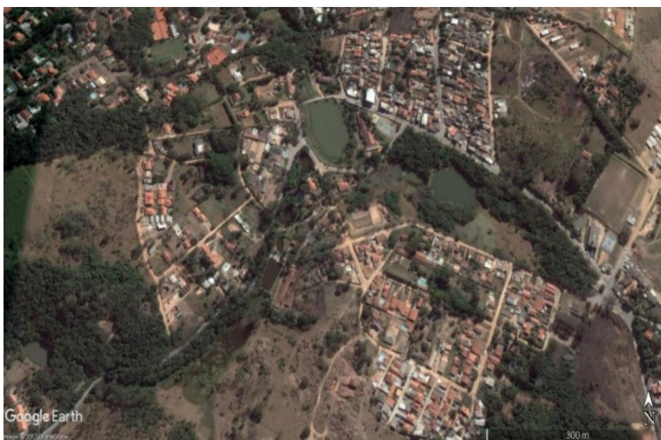
Figura 1: Foto aérea do loteamento São Bento do Recreio em 2016

A Fazenda São Bento, ou São Bento do Recreio, quando adquirida por Horácio de Salles Cunha, em 28 de dezembro de 1940, era constituída de uma área de 80 alqueires de terra, aproximadamente 193,6 hectares, equivalendo a 1.936.000 m 2 de área, conforme dados extraídos da Transcrição nº 1.725, livro 3-C, fl. 36, do CRI de Itatiba, sendo subdividida a partir de 1956. Em princípio, foram lavradas escrituras públicas de venda e compra regularmente registradas no CRI competente. As glebas rurais desmembradas variavam de 1.000 m 2 a 132.200,00 m 2 , mas o registro desses desmembramentos não continha a precisão da metragem e localização de cada gleba, nem a apuração do exato remanescente da fazenda original.