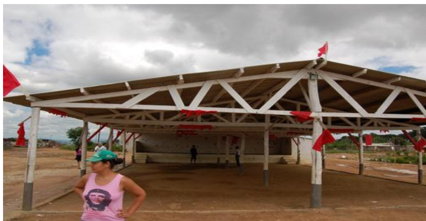
Galpão da Praça Zumbi dos Palmares.

Analisando tal Projeto, que se encontra arquivado porque o vereador que o propôs não foi reeleito, há o parecer da Assessoria Jurídica afirmando que leis não podem gerar privilégios a cidadãos e que o Poder Legislativo não pode impor ao Poder Executivo prática específica, no caso, a desapropriação da área para fins de garantir aquelas famílias o direito à moradia. No entanto, em que pese a Constituição Federal impor ao Poder Público o princípio da isonomia, que impediria a concessão do direito a moradia aos moradores do “Pinheirinho”, ele deve ser visto em conjunto com os demais princípios e garantias.