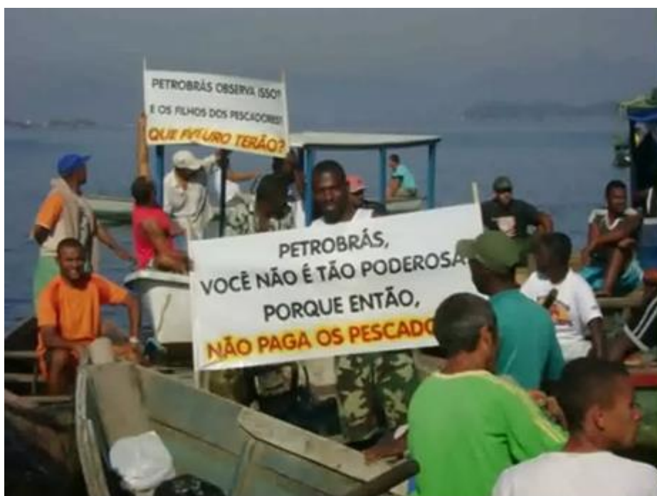
Figura 3. Manifestação no mar da AHOMAR.

Inicialmente, verifica-se que as principais estratégias de ação do grupo estariam em “manifestações no mar” 23 (figura 3) e pela via legal, principalmente pelo acionamento do Ministério Público.