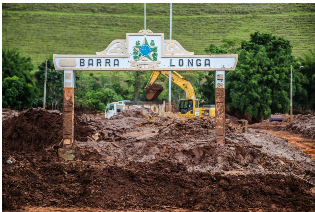
IMAGEM 02 — imagem da praça Manoel Lino Mol após a chegada da lama de rejeito. Foto: Daniela Fichino. Fonte: Justiça Global. Disponível em: http://www.global.org.br/wp-content/uploads/2016/01/AZ0A3483.jpg . Acessado em: 15 de outubro 2018

Relacionado a reconstruções dos espaços de lazer, em uma ordem cronológica, o primeiro entregue pela empresa foi a quadra da escola, que mesmo sendo um imóvel estatual não possui acesso público. Seguindo, a reconstrução da praça, da prainha e do campo de futebol aconteceram simultaneamente. No entanto, a praça Manoel Lino Mol – praça central da cidade – tratada pela Samarco com grande ênfase pois, foi a principal imagem divulgada nas redes sociais sobre os impactos em Barra Longa (imagem 02). A reconstrução da praça contou com um plano de consulta popular denominado “A praça que queremos”, porém, o apelo e escolhas que a população demandou de nada adiantou para a elaboração do projeto da praça. Ao final, a reconstrução foi feita de acordo com as escolhas dos técnicos e ainda contém pavimentação com blocos compostos parcialmente por rejeito, concretizando o desastre/crime no espaço físico da praça. O que chama atenção, no entanto, é a velocidade em que ocorreu a obra, entregue em 30 de outubro de 2016, antes mesmo da remoção dos rejeitos de minério nas áreas externas e dentro das casas da praça, em outras partes do município, especialmente na zona rural, na qual ainda se encontram áreas com rejeitos após 3 anos do rompimento.