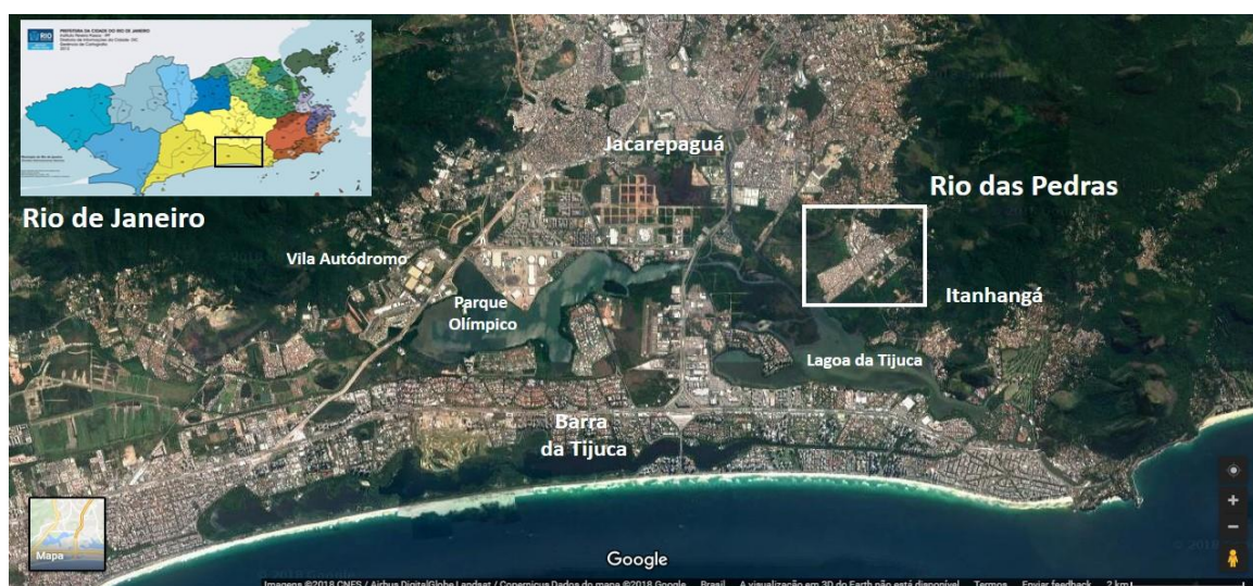
Fig.7 - Localização de Rio das Pedras.

No entanto, com o desenvolvimento da Barra da Tijuca, através das obras do plano Lucio Costa, um grande contingente de mão de obra foi atraído para a proximidade das áreas de serviço da construção civil. Em 1966, surge a primeira ameaça de remoção, através de uma ordem judicial de desocupação do terreno e o então governador, Negrão de Lima (1965-1971), decreta a área como de utilidade pública para desapropriação, com destinação de colônia agrícola e de integração da reserva biológica de Jacarepaguá.