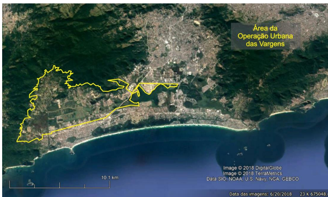
Fig. 3 – OUC das Vargens. Em amarelo a área da operação.

Em resumo, o histórico das legislações segue o seguinte processo: o Decreto nº 322 de 1976 aprova o regulamento de Zoneamento do Município do Rio de Janeiro; a área da baixada de Jacarepaguá é definida como Zona Especial (ZE-05), por meio do Decreto nº 324 de 1976; em 1981, o Decreto nº 3.046 detalha e amplia os índices construtivos para a região. Por fim, de 1981 à 2004, algumas alterações são realizadas pela prefeitura, com destaque para o Decreto nº 5648 de 1985, que define as áreas de Vargem Grande e Vargem Pequena como de interesse agrícola, e o Plano Diretor Decenal (1992) que desestimula o parcelamento das áreas ocupadas e define as áreas de proteção ambiental de lagoas, canais, maciços e morros da região (NEPLAC, 2017, p. 22).