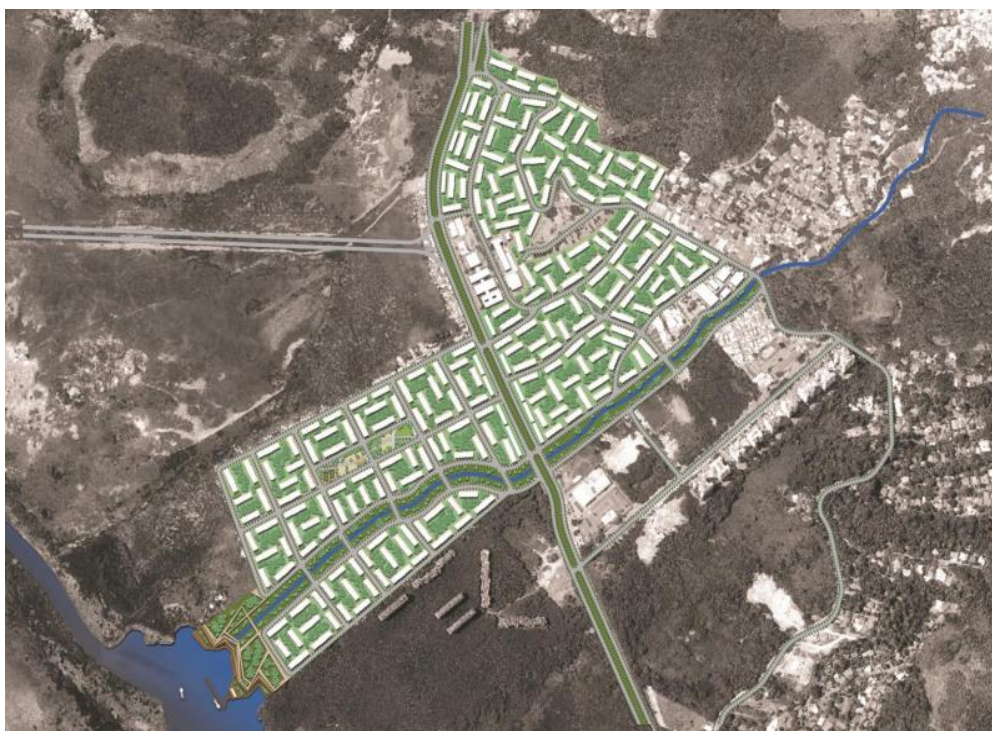
Fig. 9 - Ocupação de Rio das Pedras na Proposta da OUC.

Por fim, a proposta de ocupação da comunidade prevê a demolição de todas as habitações e todo o investimento público e privado já realizado na comunidade, como vimos na terceira parte. As famílias residentes serão distribuídas em centenas de blocos de 12 pavimentos, articulados a um faseamento, em que os moradores de uma quadra demolida para dar lugar aos novos prédios e, portanto, sem residência, aguardariam em edifícios provisórios a construção de sua moradia. Em resumo, essa é a proposta que foi apresentada.