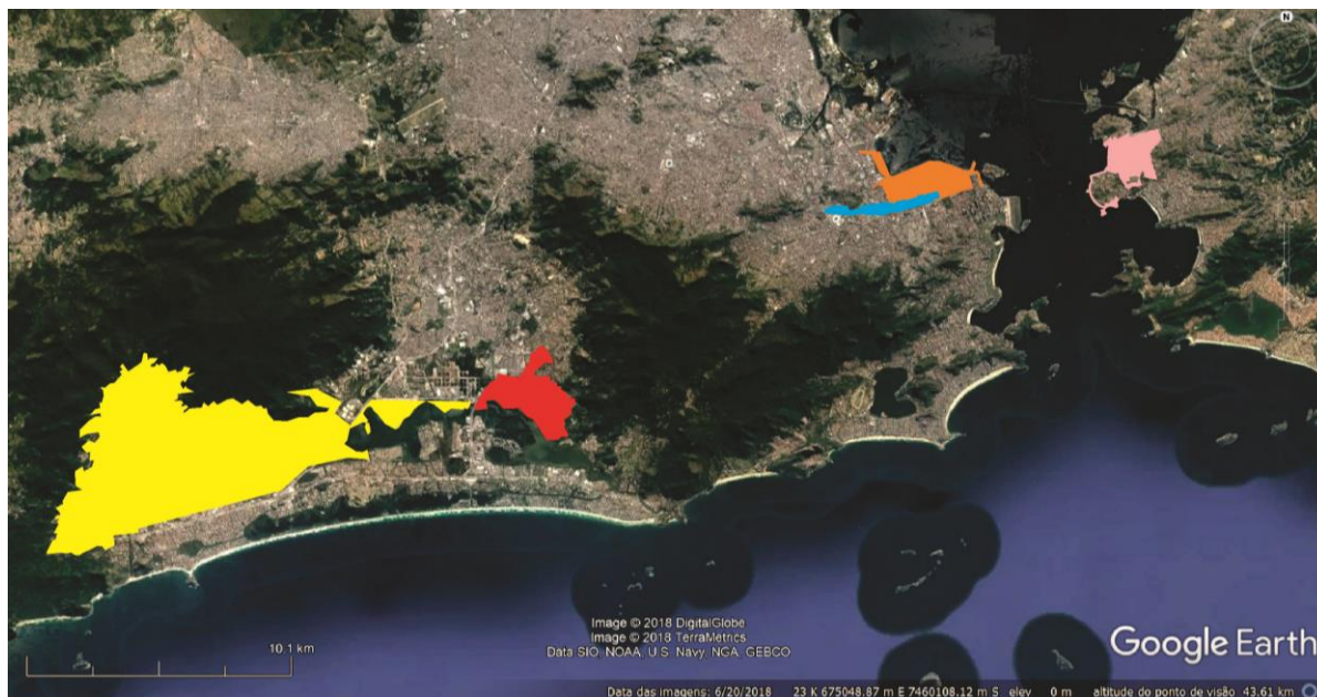
Fig. 10 - Mapa síntese das principais propostas de OUC na região metropolitana do Rio de Janeiro. Em amarelo: Vargens. Em vermelho: Rio das Pedras. Em azul: Presidente Vargas. Laranja: Porto Maravilha. Rosa: Niterói.

Resumindo, chegamos a situação de termos uma grande parcela do território da cidade do Rio de Janeiro tomado por iniciativas de Operações Urbanas Consorciadas (Fig. 10), o que abre uma nova fase de disputas no plano político e simbólico.