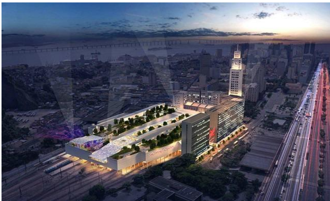
Fig. 6. Projeto de renovação da Estação Central do Brasil. Fonte: Talen Editora & Eventos. Disponível em: < http://www.revistainfra.com.br/Textos/17455/Revitaliza%C3%A7%C3%A3o-da-Central-do-Brasil-inclui-shopping-center-para-2020 >. Acesso em: 18/11/2018.

Paralelamente, ao longo do ano 2018, Marcelo Crivella busca, através de um acordo de cooperação com o governador Luiz Fernando Pezão, aproximar parceiros com o intuito de revitalizar a área da Central do Brasil. A revitalização visa transformar a estação em um terminal multimodal (Fig. 06), com intervenções que vão desde o reordenamento do fluxo de passageiros até a construção de um shopping sobre as plataformas. Segundo O Globo (07/08/2018), “durante o encontro, no entanto, não foram detalhadas ações concretas e nem o investimento necessário. Tampouco foi apresentado um cronograma para o projeto”.