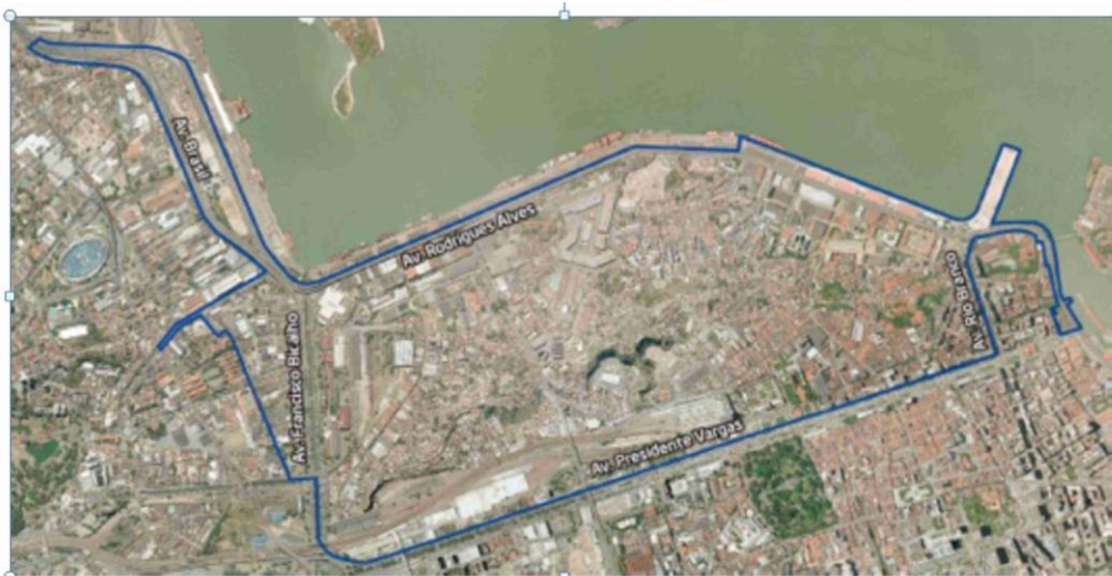
Fig. 1 - Porto Maravilha (delimitada em cor azul). Disponível em: < http://portomaravilha.com.br/web/sup/OperUrbanaPresent.aspx >. Acesso em: 21/01/2014.

O lançamento deste projeto, iniciado efetivamente em 2010, constituiu indiscutivelmente um importante passo na direção da construção de uma cidade que não mais representaria a possibilidade de uma gestão urbana calcada no ideário do “desenvolvimento e igualdade”, mas sim, no que atendia aos novos tempos do capitalismo financeiro e globalizado, ou seja, “desenvolvimento e competitividade”.