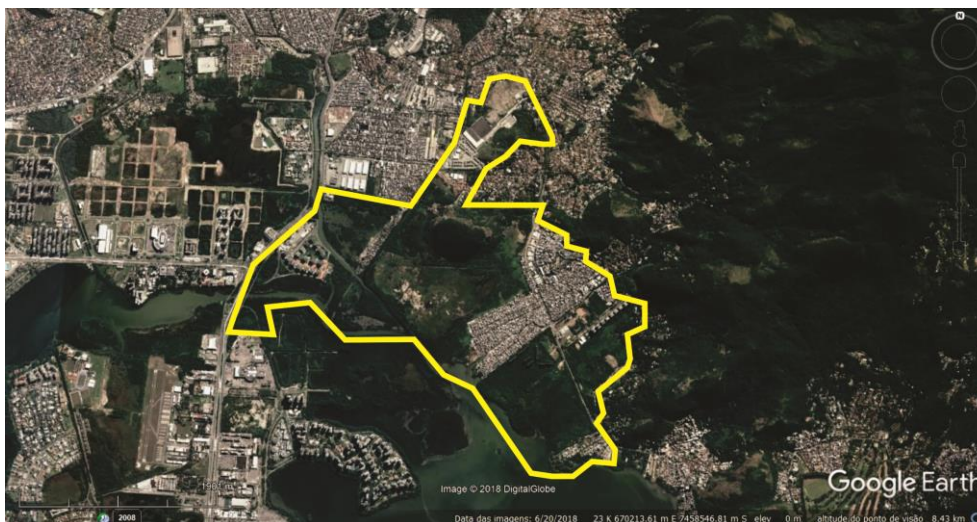
Fig. 8 - OUC Rio das Pedras, em amarelo a poligonal da Operação.

Popular do Rio de Janeiro, bem como de uma rede apoio técnico ligado aos movimentos sociais. Porém, o esforço da prefeitura de passar tranquilidade em relação à proposta não foi suficiente e a comunidade se fortaleceu e continuou suas articulações para tentar impedir a viabilização da proposta. Por sua vez o prefeito Crivella, para acalmar os ânimos, publicou um vídeo no Facebook (Disponível em: < https://youtu.be/IQXaP0HsJ4E >. Acesso em: 21/02/2018), onde afirma, entre outras coisas, “que não haverá remoção na comunidade”, mostrando as perspectivas do projeto. No entanto, o efeito dessa publicação foi justamente o contrário e a mobilização foi ainda mais ampliada.