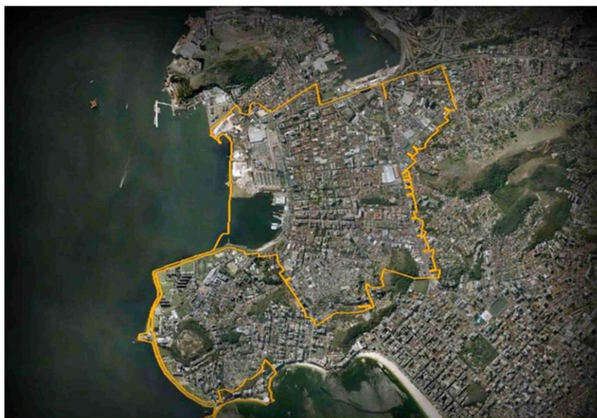
Fig. 2 – OUC-Niterói (área delimitada na cor amarela). Disponível em: < http://centro.niteroi.rj.gov.br/oprojeto/ocentroquequeremos.php >. Acesso em : 23/03/2014.

A OUC-Niterói refere-se a uma área maior do que o distrito central de negócios, incluindo partes de bairros vizinhos e o maior complexo de favelas da cidade (morros do Estado, Arroz e Chácara) (Fig. 2). Do ponto de vista legal, esta OUC descartou as iniciativas pretéritas de planejamento urbano, como o “Plano Diretor” (1992), o Plano Urbanístico Regional de ordenamento territorial (2002), além da lei voltada para a preservação do patrimônio edificado e urbano representado pela ambiência urbana como testemunho da história da cidade.