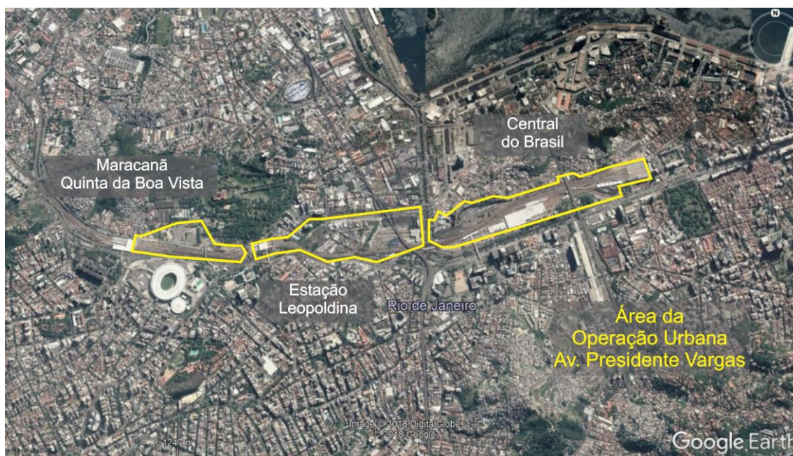
Fig. 5 – OUC Av. Presidente Vargas. Em amarelo área da OUC.

O procedimento propõe a realização de estudos em três grandes áreas da região central, a primeira diz respeito a Central do Brasil, a segunda da Estação Leopoldina e a terceira, a região do Maracanã e Quinta da Boa Vista (Fig. 5).