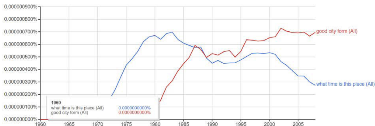
Figura 2 : Gráfico com o percentual de vezes em que os livros selecionados aparecem entre os bigrams (termos com duas palavras) na amostragem de livros escritos em inglês e publicados nos EUA, entre 1960 e 2008.