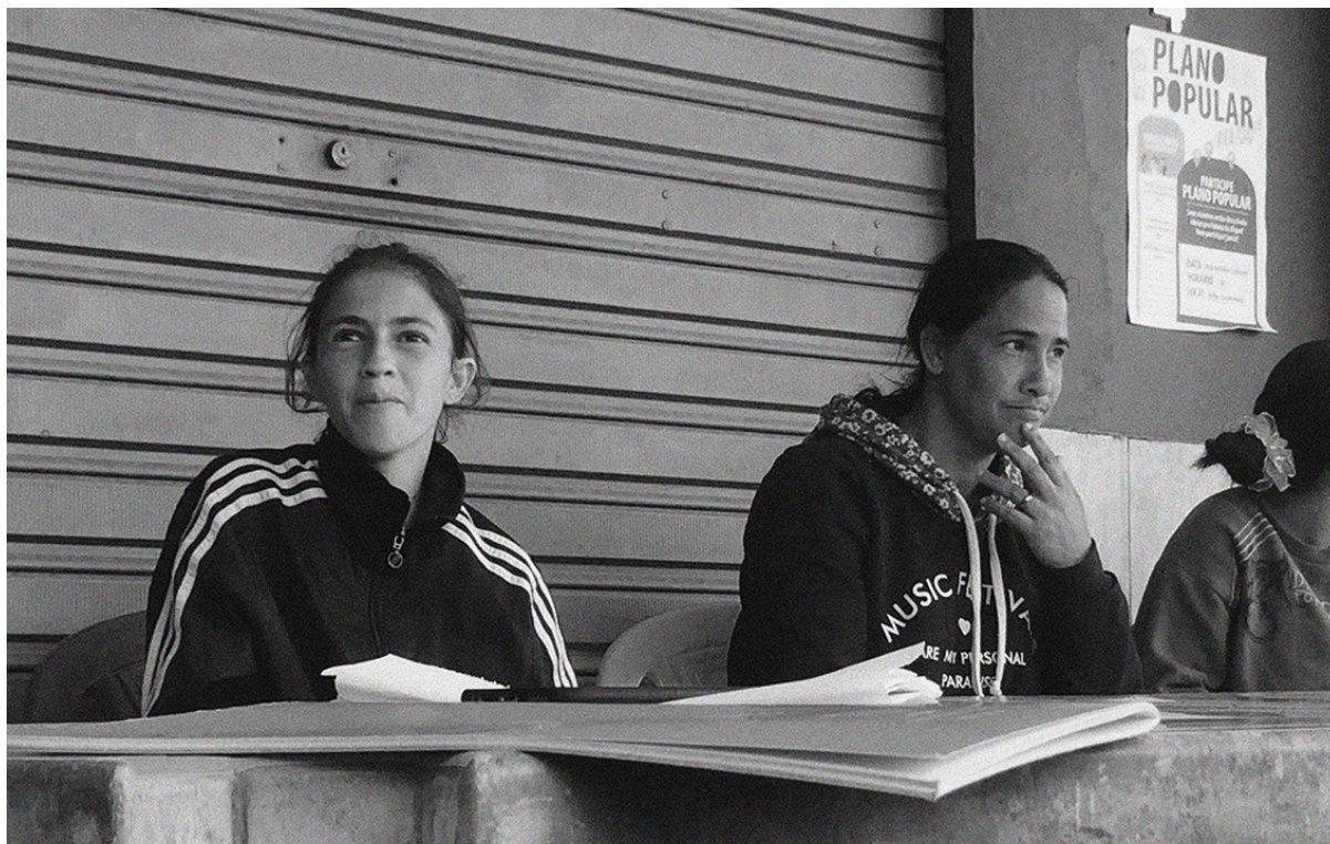
Figura 4. Encontro de debates sobre a comunidade.