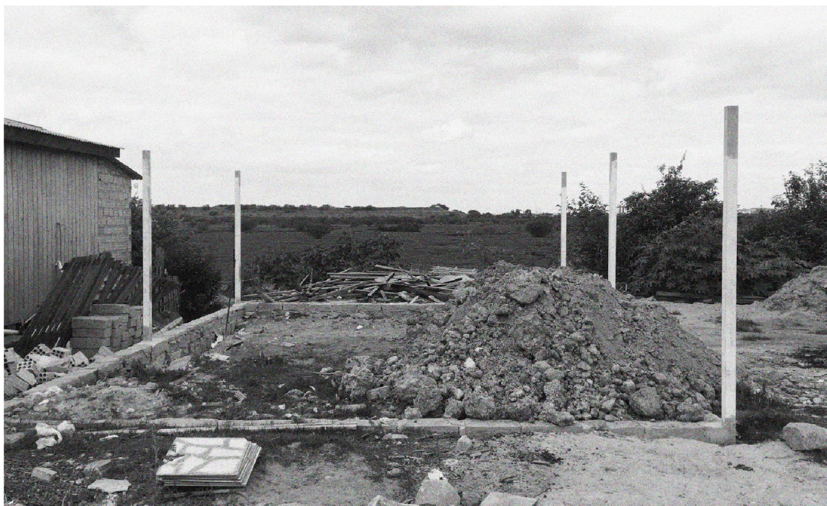
Figura 5. Pilares e fundações da nova associação de moradores da Vila Dique. (Foto: EMAV, 2018)