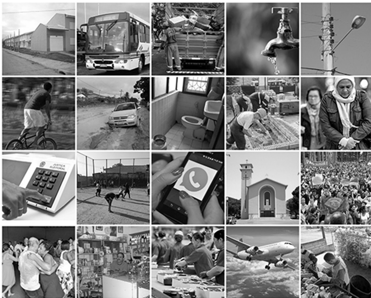
Figura 3. Algumas imagens do banco de figuras de auxílio a representação dos temas geradores.

Pressionados pela falta de tempo, utilizamos parte desta metodologia e adaptamos alguns aspectos para adequarmos a realidade da Vila Dique, como por exemplo o acréscimo de imagens junto aos temas (Figura 3), com o objetivo de tornar a dinâmica mais inclusiva e não constranger a participação dos moradores analfabetos. Em relato de uma experiência com alunos da zona rural, Freire (1983) problematiza os limites da comunicação e do ensino através de uma linguagem técnica: