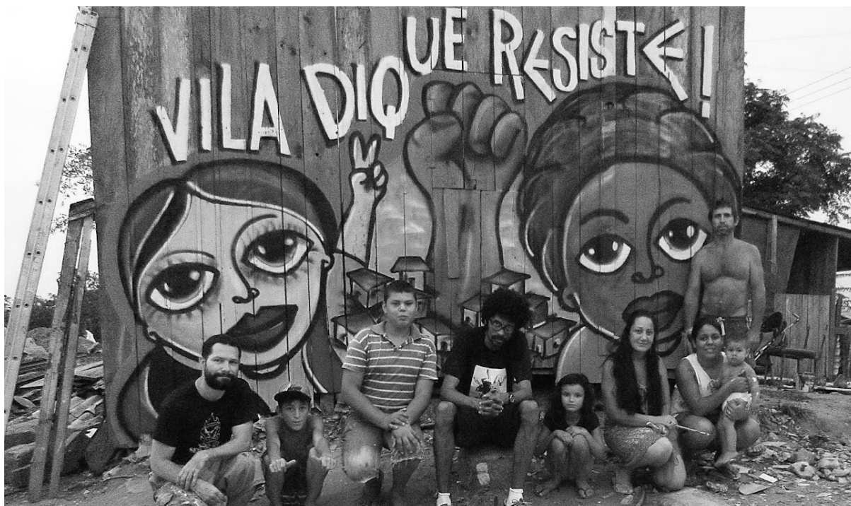
Figura 2. Primeira sede da associação Vila Dique Resiste!

Foi em resistência a este cenário, que alguns moradores que não queriam ser realocados e outros que decidiram voltar para a comunidade após morarem nas novas unidades habitacionais, fundaram em 2015 uma nova associação de moradores chamada “Vila Dique Resiste!” (Figura 2), dando continuidade a luta pela permanência e com o objetivo de conquistar os direitos básicos retirados pela prefeitura ao longo do processo de remoção.