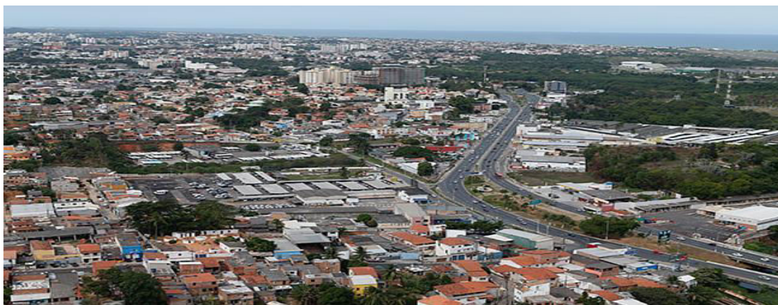
Figura 3 – Visão Panorâmica do Município de Lauro de Freitas