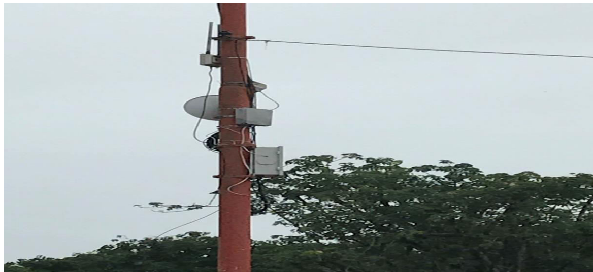
Figura 9 - Equipamento (Antena) para Acesso ao WIFI