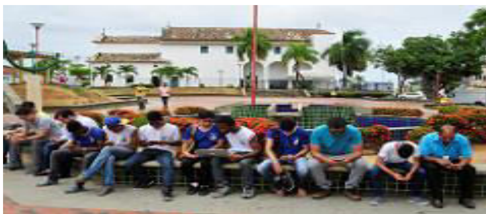
Figura 6 – Fotos da Inauguração do wifi na Praça Matriz Santo Amaro de Ipitanga