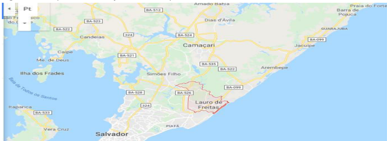
Figura 4 – Mapa de Localização do Município de Lauro de Freitas