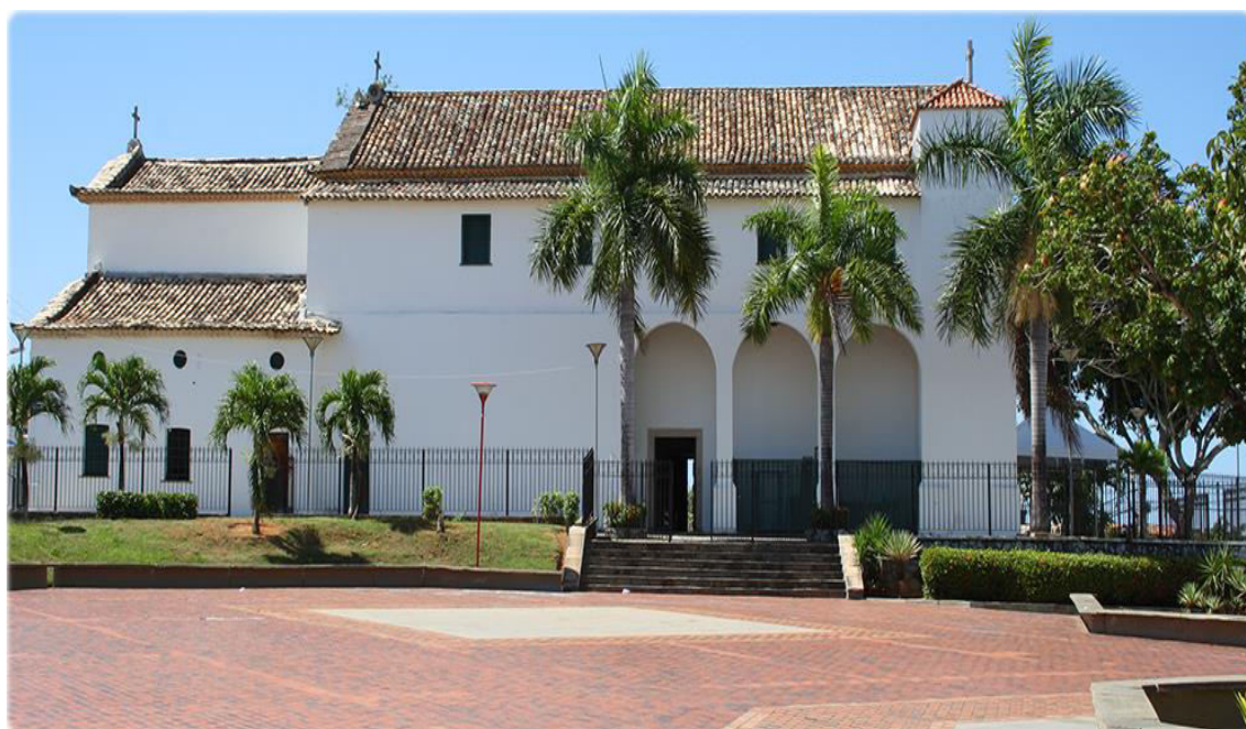
Figura 8 - Visão Externa da Igreja de Santo Amaro de Ipitanga – Lauro de Freitas/Ba