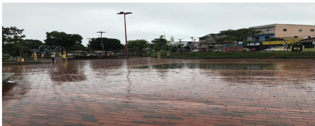
Figura 7 - Visão Panorâmica da Praça Matriz

Para a praça de Lauro de Freitas, como os demais espaços públicos e históricos, que transcenderam gerações, assistem à passagem do tempo e as mudanças no cotidiano da cidade. Sendo um espaço urbano, a praça matriz sempre foi celebrada como um espaço de convivência e lazer dos cidadãos. Estando localizada no bairro central do município, onde se encontram a principal igreja, a prefeitura e alguns outros órgãos de gestão do município, já recebeu diversas mostras, eventos e apresentações teatrais nacionais e internacionais. São diversos eventos culturais destinados ao entretenimento de seus moradores. A programação é variada, sempre envolvendo serviços de cidadania, cultura e religião. Em épocas festivas, a praça é um equipamento público de grande importância para o incentivo à cultura no município, servindo de palco para diversas manifestações artísticas, como shows de diversos artistas locais e nacionais, peças teatrais (destacando-se a encenação da paixão de cristo e do presépio do natal).