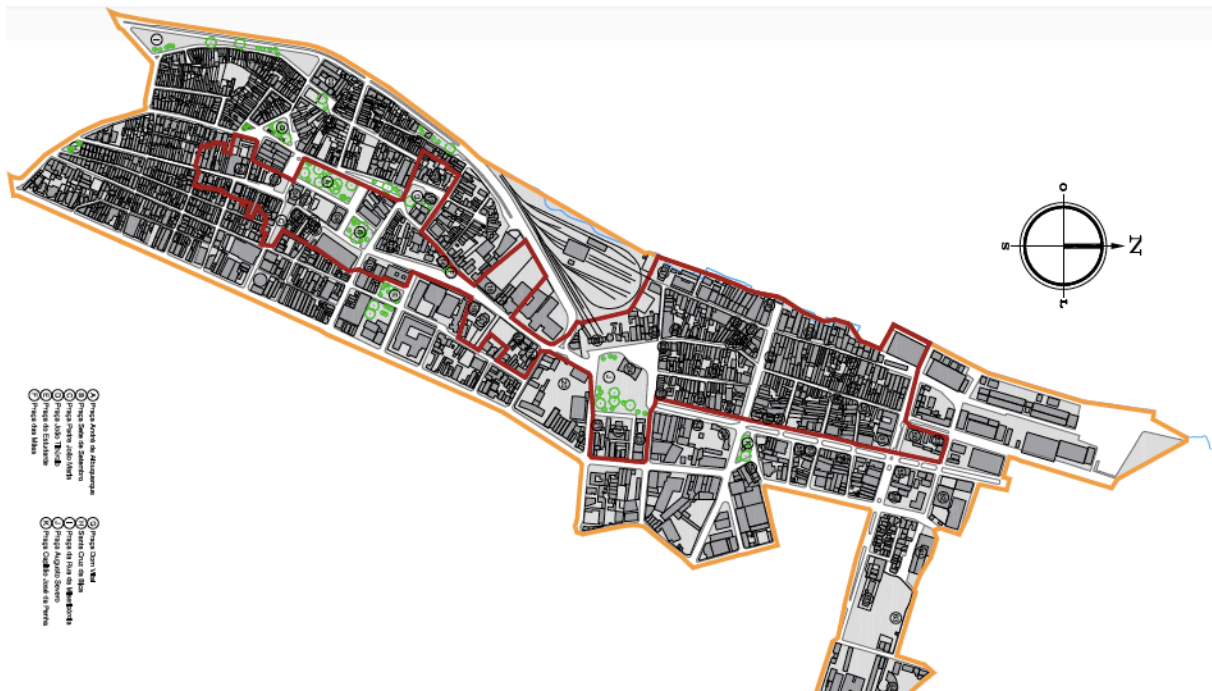
Figura 3 - Mapa Geral do Sítio Histórico de Natal

Assim, esta situação mostra uma drástico desmonte de tempos históricos importantes da arquitetura e da sociedade natalense, que até meados do século XX era possível observar de maneira impregnada nas formas urbanas como um todo. Consequentemente, hoje presenciamos essa interferência na historicidade local e a privação da população a um legado cultural importante na contemporaneidade.