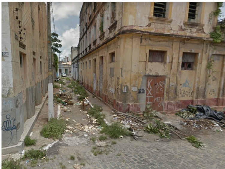
Figura 4 - Lixo e entulhos na Travessa Venezuela

Os olhos que reconhecem a presença de muitos resquícios históricos impregnados nas formas urbanas também viram muito lixo acumulado nas ruas que faltam lixeiras, situação bem comum na área, com destaque para os becos e travessas da Ribeira, onde em muitos casos, para se atravessar, é preciso pisar no lixo (Figura 4). Viram também esgotos a céu aberto, acúmulo de entulhos, fezes de animais e animais comuns de serem encontrados nestes casos, como ratos, baratas e até cobras.