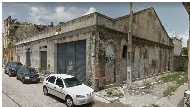
Figura 5 - Edifícios degradados na Rua Chile

Nos edifícios, elementos da forma urbana que se sobressaem em relação aos demais pela riqueza de detalhes que as fachadas apresentam, os aspectos mais observados foram as portas fechadas para visitação de algumas instituições públicas, associando este fato à falta de uma maior política de preservação, a grande quantidade de imóveis desocupados, que muitas vezes assustam pelas vedações das aberturas com tijolos ou avançados níveis de degradação (Figura 5), as preservações e descaracterizações das fachadas.