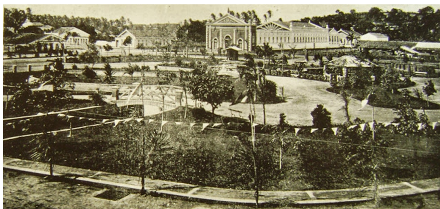
Praça da República em 1906

No espaço público, destacavam-se as construções de praças, largos e avenidas com canteiros centrais, decisivos para espraizar o sentimento de se estar vivendo em uma cidade em transformação (DANTAS, 2003). Foram significativas as obras de construção do Porto, o aterro e a drenagem da Praça da República (Figura 2), hoje conhecida por Praça Augusto Severo (Ribeira), a abertura de estradas carroçáveis e de ferro, diminuindo o isolamento da cidade com o interior, o surgimento novos bairros (Cidade Nova, entre 1901 e 1904, e Alecrim, oficializado em 1911), a retificação de algumas ruas, como a Rua do Comércio (atual Rua Chile); a abertura de novas ruas (Rua Sachet, atual Duque de Caxias, Almino Afonso e a Tavares de Lyra); o aterro e nivelamento da Praça Leão XII e o aformoseamento da Cidade Alta, com o calçamento e arborização das principais ruas e a demolição de dezenas de edifícios que não atendiam as exigências de alinhamento e salubridade.