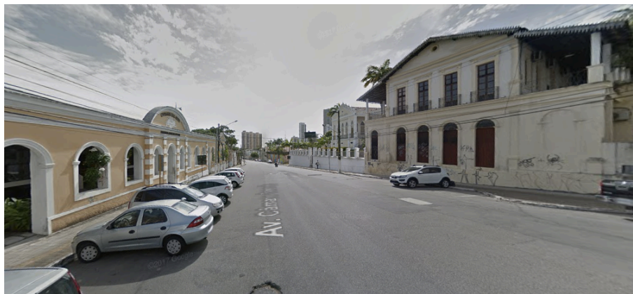
Figura 6 - Conjunto de edifícios da Av. Câmara Cascudo

Os edifícios preservados e em bom estado de conservação geraram a percepção de imponência nos caminhantes. Entre eles, destacaram-se a Igreja do Galo (Santo Antônio), a Igreja de N. S. da Apresentação, o prédio do Instituto Histórico e Geográfico do RN, a Pinacoteca (Palácio Potengi), a Casa do Estudante, o edifício do DNOCS (Antiga Estação Ferroviária da Esplanada Silva Jardim) e o conjunto de edifícios ecléticos da descida da Av. Câmara Cascudo (Figura 6), que independente do estado de conservação, foram identificados como arquiteturas monumentais e de muito valor patrimonial.