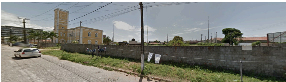
Figura 8 - Muro em torno da antiga estação ferroviária da Esplanada Silva Jardim

Algumas sensibilidades se voltaram para a relação entre urbanidades e lugares inóspitos. Nas ruas do entorno do Conjunto São Pedro, as crianças jogando bola, a criação de galinhas, a plantação de hortas, entre outros comportamentos da vizinhança, demonstram a apropriação do espaço em direção à urbanidade, no sentido de “fazer exatamente o que lhe convém e quando lhe convém” (CULLEN, 2013, p. 23); enquanto as grades e cercas de arame farpado que impedem o acesso físico e visual ao Rio Potengi, os muros que circundam o antigo parque ferroviário das Rocas (Figura 8), entre outras paredes cegas encontradas em todo o sítio histórico, a insegurança sentida nos espaços desertos de pessoas e próximos aos pontos de consumo de drogas, entre outros aspectos que desintegram pessoas e lugares, muitas vezes se tornam ambientes sociofugidios.