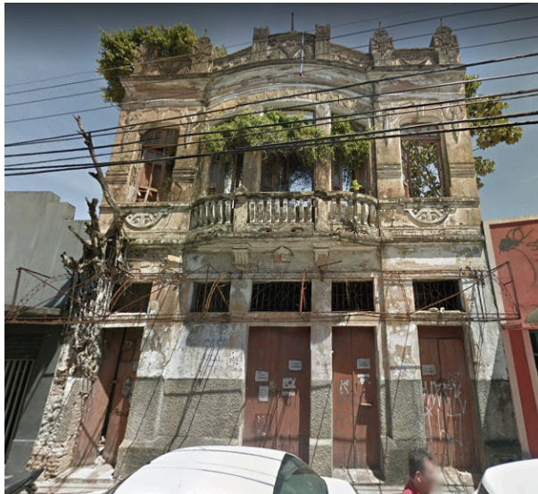
Figura 7 - Ruína A Samaritana

mais imponentes do que os da Cidade Alta e apresentando maior contraste entre os edifícios vizinhos, em geral, muito malconservados.