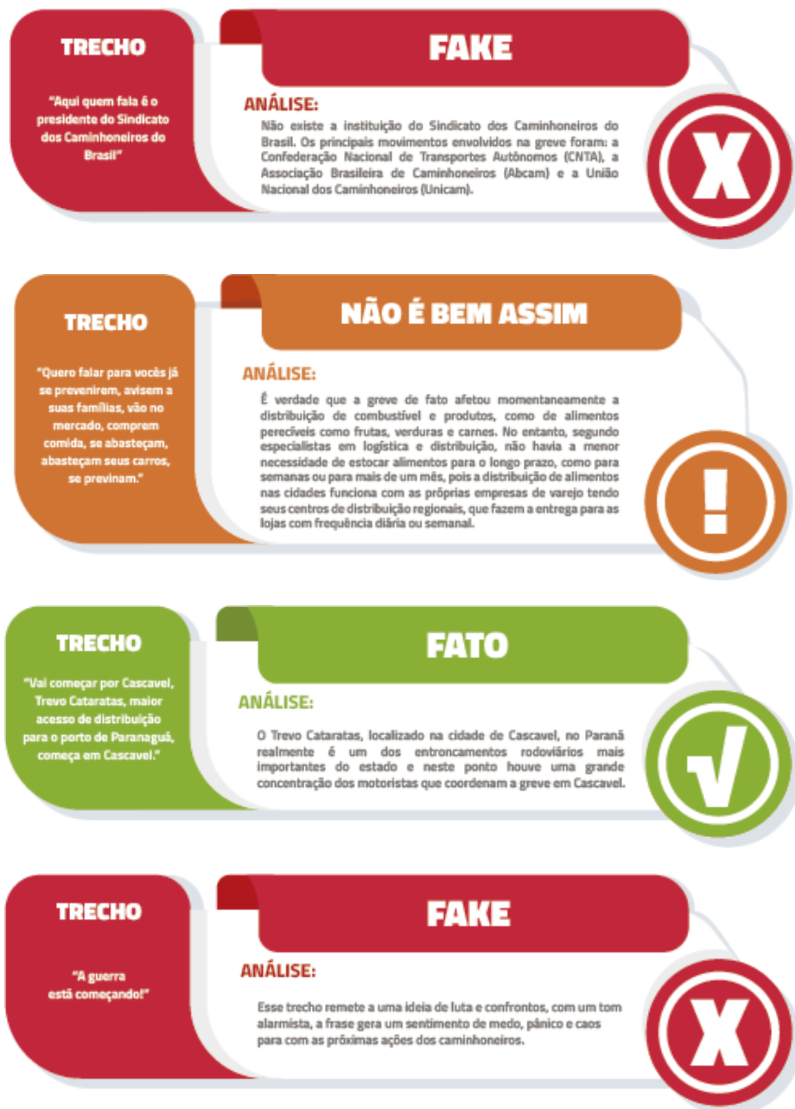
Figura 1: Análise da Fake News sobre o desabastecimentos de supermercados