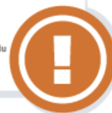
Figura 3: Análise da Fake News sobre a invasão à base Santa Maria Fonte: Elaborado pelos autores

O general da reserva Antônio Hamilton Mourão deu declarações à Folha e disse que a população não pode se tornar refém da greve dos caminhoneiros. Esse mesmo general foi afastado de uma secretaria do Exército por criticar Michel Temer e sugerir intervenção militar no final de 2017. Entretanto, na mesma entrevista para o jornal Folha, Mourão afirmou que não concorda com uma ação militar contra o governo federal para encerrar essa crise política. Além disso, para acabar com a polemica, O general Villas Boas emitiu uma nota de esclarecimento, sendo bem enfático sobre o papel do exército de obedecer o Executivo, e repeliu qualquer manifestação de intervenção.