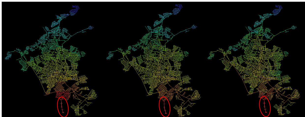
Figura 2: Análise Angular de Segmentos da Av. Totonho Rezende com relação aos outros segmentos do sistema. Da esquerda para a direita: distância métrica, distância topológica e distância angular.

distâncias angulares. Os resultados são expostos abaixo da esquerda para direita respectivamente.