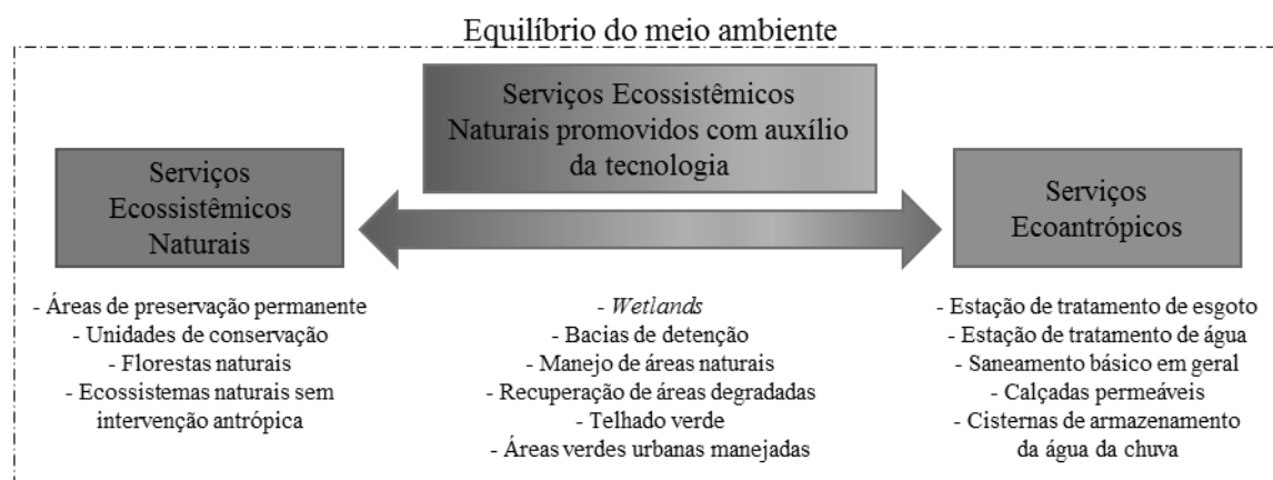
Figura 2 – O equilíbrio ambiental baseado na relação entre os serviços ecossistêmicos naturais e antrópicos e seus exemplos.