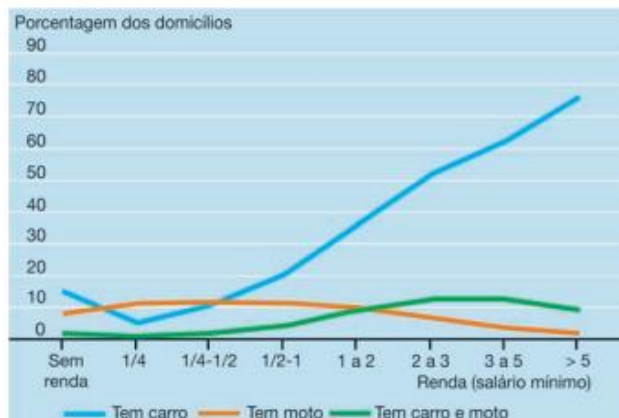
Figura 3- Posse de veículos motorizados nos domicílios do Brasil por nível de renda em 2009.