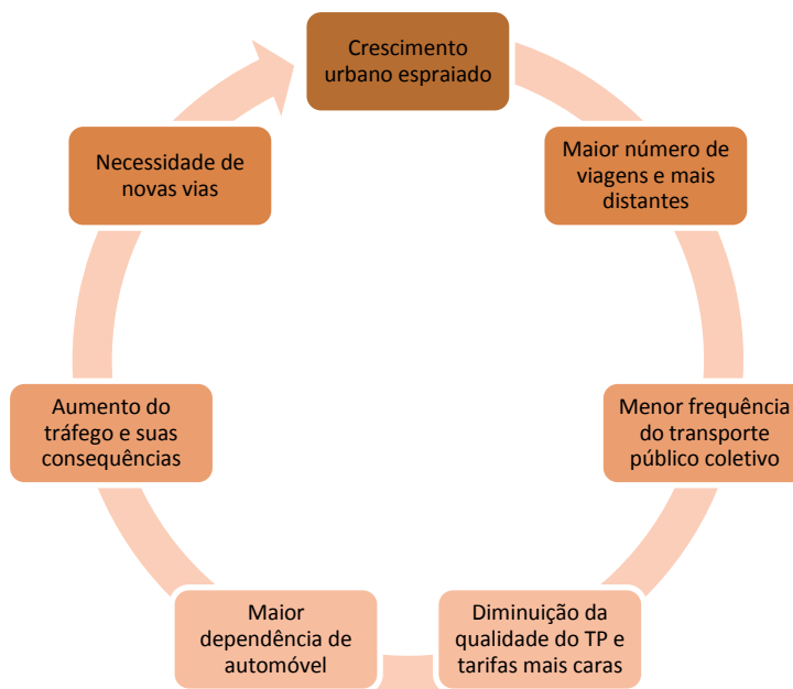
Figura 2- Ciclo crescimento urbano desordenado e condição a mobilidade