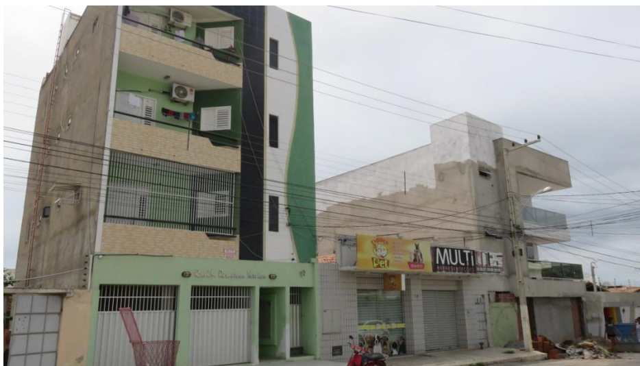
Figura 08 - Mudança de uso na Rua Monsenhor Gurgel, com uso edifício residencial (esquerda), comercial (centro) e quitinete vertical (direita).