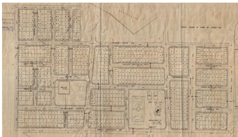
Figura 02 - Partido Urbanístico do Abolição I digitalizado e vetorizado na plataforma AutoCad (abaixo)