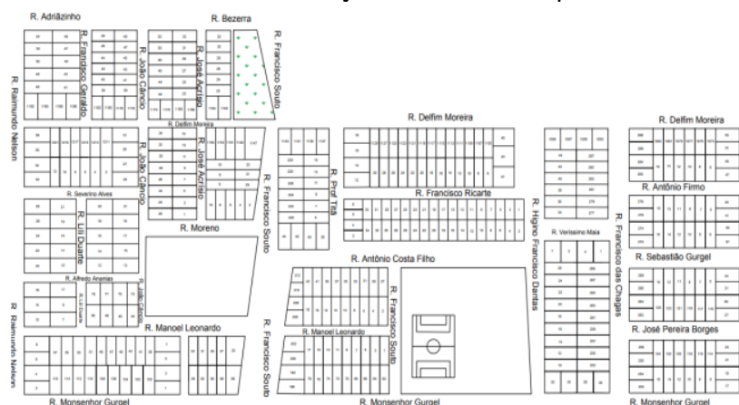
Figura 03 - Partido Urbanístico do Abolição vetorizado na plataforma AutoCad