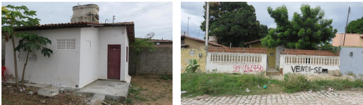
Figura 10 - Imóvel com padrão original preservado (esquerda) e imóvel abandonado (direita).

ser o segundo mais jovem, expressou maior abandono de residências, conforme observado na Tabela 01. Essa realidade remete às reflexões teóricas de Marcuse (1985), em que os processos de valorização e abandono acontecem simultaneamente na mesma área, um ciclo vicioso em que a população de baixa renda está em constante pressão de abandonar as áreas em que vivem.