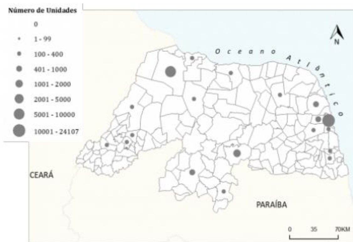
Figura 01 - Distribuição espacial e proporcional dos empreendimentos com mais de 100 unidades, construídos pela Cohab/RN, até 1991