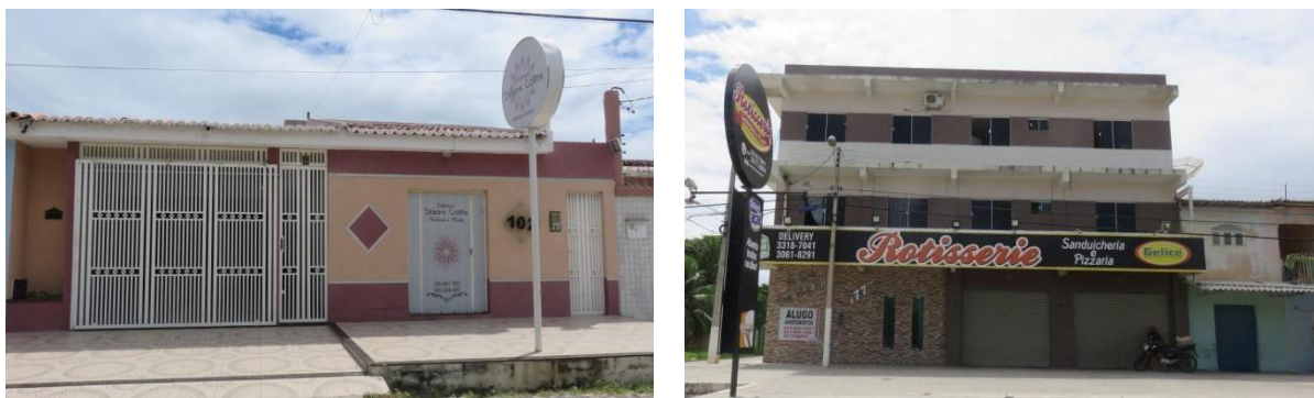
Figura 07 - Mudança de uso - Uso misto simples (esquerda) e misto duplex (direita)