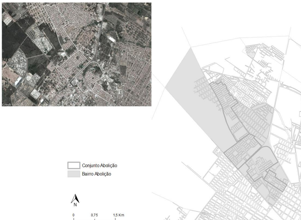
Figura 04 - Conjunto habitacional Abolição localizado no bairro Abolição, Mossoró-RN