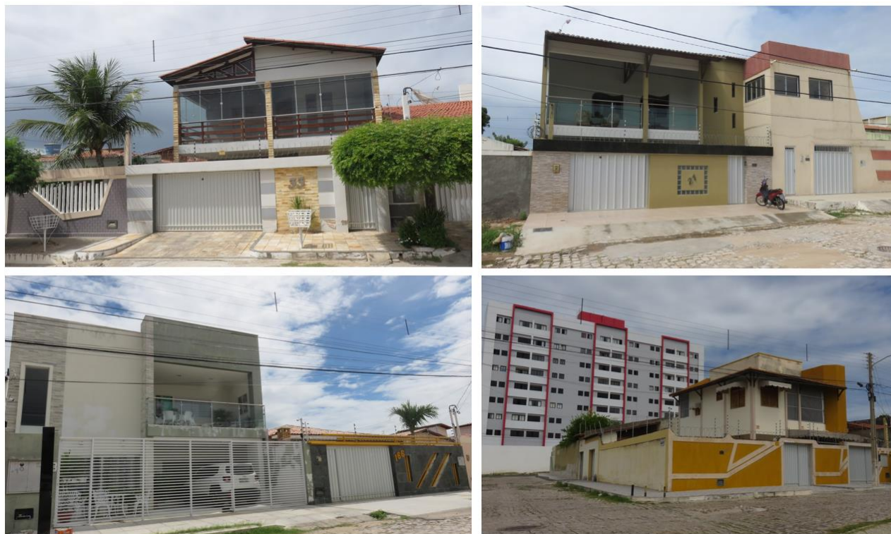
Figura 11 - Casas com padrão elevado