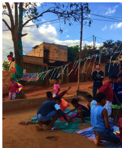
Figura 4 e 5 - Criança brincando com velotrol em uma segunda-feira e crianças fazendo pipas no Festival de Pipas que ocorreu dia 08/07/2017