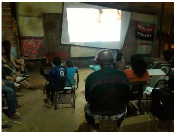
Figura 3: Sessão de cinema meio 2017

Sendo nítido o interesse e encantamento dos moradores pelo cinema, a outra sessão ocorreu em meio de 2018, e fechamos um micro-ônibus com aproximadamente de 25 pessoas (crianças e 2 mães) e seguimos para o Cinema na região central de Belo Horizonte, onde passou o filme do Bob Esponja. Vale ressaltar que nenhuma das crianças nem das mães tinham ido a um cinema, e logo após a sessão foi feito um lanche e brincadeiras na Praça Duque de Caxias, no Bairro Santa Tereza.