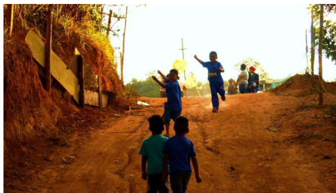
Figura 7 - Crianças soltando pipa próximo a Quadra 13 - Rosa Leão

Os “pedaços” são formados por pessoas de vivem próximas, e uma das características das ocupações é a proximidades dos parentes, ou seja, os vizinhos muitas vezes também são primos. A presença de muitas crianças acaba por contribuir para a formação de núcleos de brincadeiras. Geralmente há um adulto por perto assistindo, mas não há um controle e imposição das atividades exercidas.