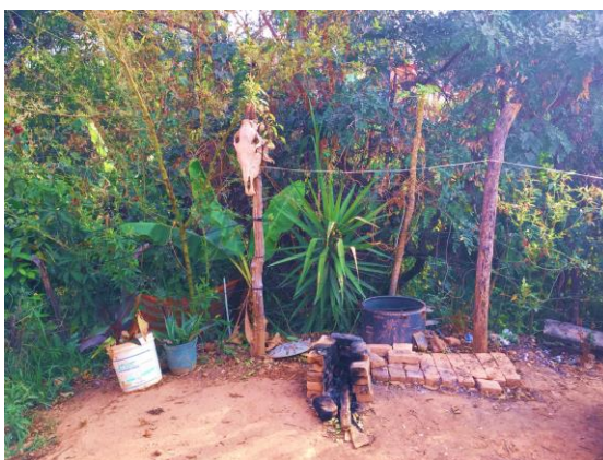
Figura 2 - Churrasqueira na Rua Pedro Pomar

Nos finais de semana são os dias de mutirão, o que não se restringe a um dia de trabalho. Muito pelo contrário: o mutirão é um momento de socialização e riso em muitos momentos. O trabalho pesado acontece junto com uma churrasqueira improvisada, cerveja e som alto.