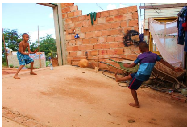
Figura 6 - Meninos jogando futebol e utilizando o portão como trave.

Em maio de 2017 conversamos com aproximadamente 15 crianças, e ao perguntar o que elas mais gostam de fazer para brincar, o que foi levantado foi soltar pipa, subir em árvore, brincar de esconder, jogar bola, e brincar de escolinha. Ao refletirmos sobre estas atividades, ressaltamos que nenhuma das práticas, exceto brincar de escolinha, necessita de um espaço fixo. Ou seja, o importante é que tenham árvores, que tenha um espaço aberto para jogar bola, mas não necessariamente restringe-se o brincar a um espaço de parquinho ou praça. As brincadeiras são brincadeira de rua.