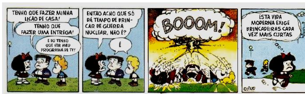
Figura 1- Tirinha Mafalda

O caráter revolucionário do brincar no contexto das ocupações urbanas. 1