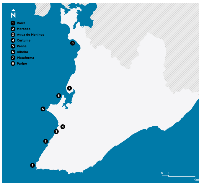
Imagem 03: Mapa com a localidade das feiras livres de Salvador segundo relato dos mestres saveiristas. Autoria própria.

Mestres e tripulantes se preparam para as complicadas manobras de atracação, arriam as velas, e o saveiro, lentamente, se acomoda na pequena enseada. E começam a sair dos saveiros balaios de quiabos, de mangas, porcos, mantas de toucinho, latas de dendê, feixes de lenha, cajus, mudanças, cerâmica e um mundo imprevisível de coisas; tudo é desembarcado na cabeça dos carregadores, verdadeiros equilibristas que passam de um saveiro a outro com agilidade de gatos, não importa se levam três sacos de farinha ou um galo de briga, a elegância é a mesma. No desembarcar cachos de banana ou feixes de lenha jogam a carga que é aparada por outro, e por outro até que é arrumada no cais. (CARYBÉ, 1987, p. 223-225)