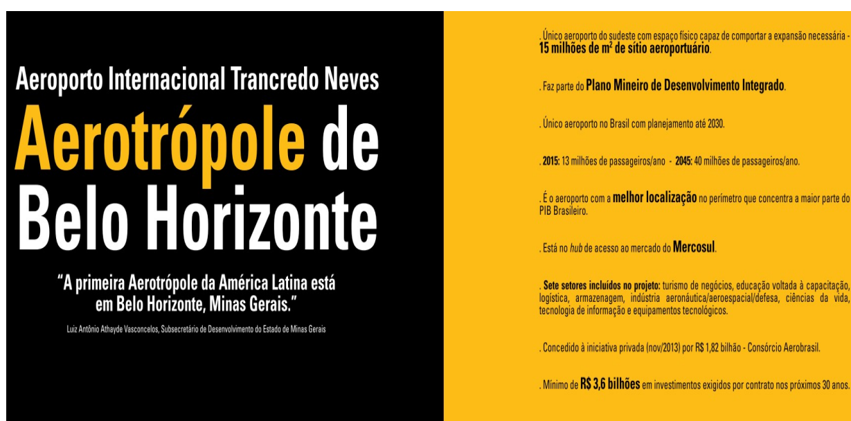
Figura 2: Trecho de Flyer para divulgação da Aerotrópole Belo Horizonte.

Ainda assim, o Aeroportos Internacional de Viracopos e outros sob o regime de concessão, como o Aeroporto Internacional de Brasília e Aeroporto Internacional de Guarulhos, são objetos de planos de expansão para uma inserção competitiva de suas concessionárias em áreas que extrapolam a prestação do serviço público de transporte aéreo. Com isso, inserem as propriedades públicas na dinâmica especulativa do mercado imobiliário e empresarial corporativo, sem a promoção de usos públicos e pautando a utilização desses espaços a um padrão de consumo específico. Ainda que não utilizem diretamente os conceitos citados anteriormente, essas concessionárias não estão afastadas da visão que coloca os aeroportos como grandes equipamentos economicamente multifuncionais e espaços competitivos.