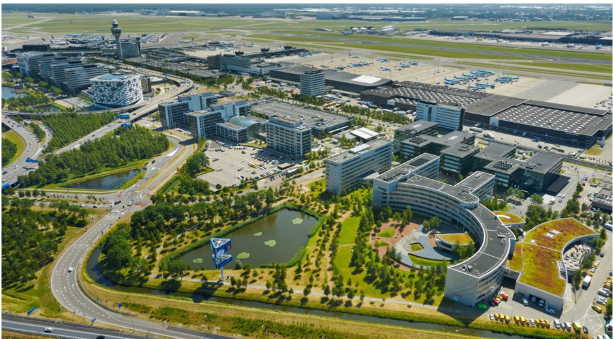
Figura 3: Aerotrópole do Aeroporto de Amsterdã Schiphol. Fonte: Royal Schiphol Group. Disponível em < https://www.schiphol.nl/en/schiphol-group/page/partners-mainport-schiphol/ > Acesso em Nov. de 2018

John Kasarda afirma que “existem 80 aerotrópolis em desenvolvimento no mundo, seja em planejamento ou já em implementação. Outras cerca de oito ou dez estão prontas e funcionando. O terminal de Schipol, em Amsterdã, é um bom exemplo de aerotrópolis desenvolvida” (PORTO, 2014). Ele é responsável por desenvolver mais profundamente e popularizar o conceito, e tem prestado consultoria para implantação de aerotrópoles em cidades do mundo inteiro, incluindo o caso de Belo Horizonte. Kasarda está há alguns anos trabalhando em parceria com o governo de Minas Gerais acompanhando o desenvolvimento do projeto de implantação da aerotrópole, que orienta diversas intervenções urbanísticas direta ou indiretamente relacionadas ao complexo aeroportuário de Belo Horizonte.