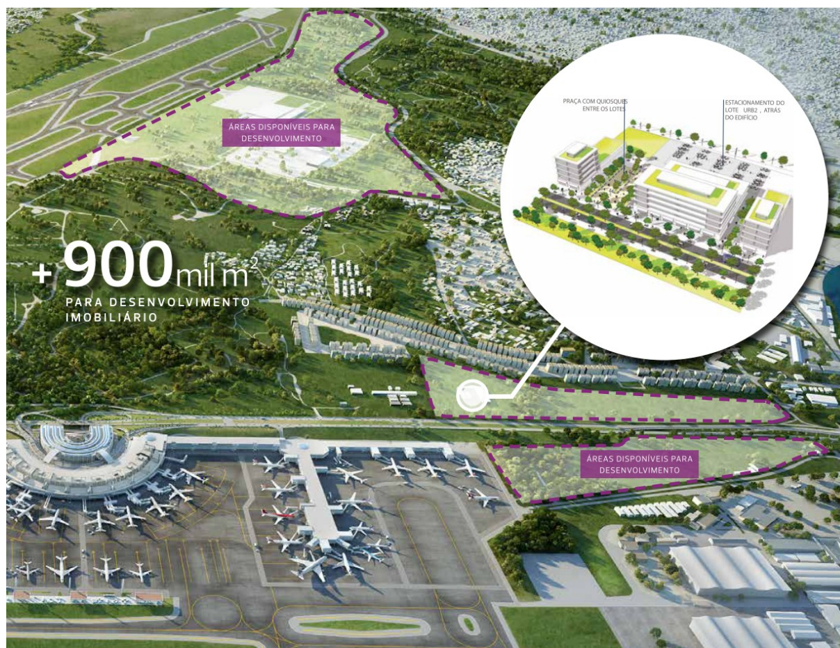
Figura 4: Folder de divulgação do projeto de desenvolvimento imobiliário. Fonte: Rio Galeão. Disponível em < http://www.riogaleao.com/negocios/sites/default/files/riogaleao-comercial-desenvolvimento-imobiliario.pdf > Acesso em Nov. de 2018

Mas em uma leitura mais profunda, e considerando sua efetiva consolidação, dentre os conceitos de complexos aeroportuários já discutidos neste trabalho, o projeto para o entorno do Galeão estaria mais próximo do chamado aeroporto-cidade. Pois a inexistência de políticas de neutralidade fiscal não permite que seja caracterizado como aeroporto industrial e a ausência do Estado na provisão de uma infraestrutura específica, bem como a falta de intervenções espaciais de abrangência metropolitana impedem que seja classificado como uma aertrópole. O que não impede que o posterior crescimento imobiliário e econômico da região do projeto o transforme em uma.