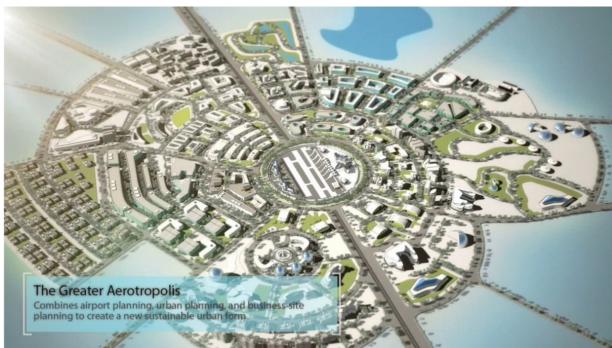
Figura 1: Simulação de aerotrópole desenvolvida. Disponível em < https://www.archdaily.com.br/br/01-107129/aerotropolis-cidade-aeroporto-a-chave-para-uma-cidade-prospera-do-seculo-xxi > Acesso em Nov. de 2018

Os dois últimos conceitos, aeroporto industrial e aerotrópole, têm sido mais utilizados por algumas empresas concessionárias do setor aéreo no Brasil para promover um modelo de desenvolvimento econômico e imobiliário nos complexos aeroportuários e no seu entorno. São tipologias que induzem uma maior interação cotidiana entre os aeroportos e espaço urbano, implicando diretamente na forma como este se expande, se densifica e se organiza. De certa forma, é lavar para os aeroportos a função que as estações ferroviárias e os portos já tiveram no passado como epicentro do desenvolvimento urbano.